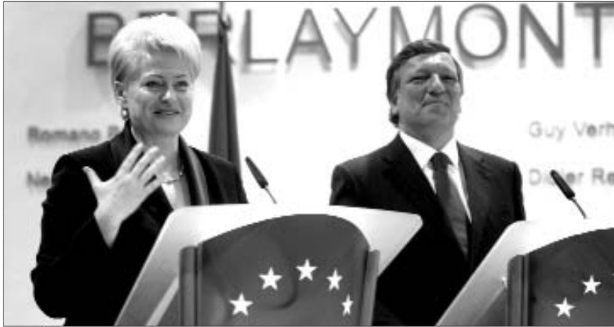
Prezidentė D. Grybauskaitė Briuselyje susitiko su EK pirmininku J. M. Barosso.

Briuselis , rugpjūčio 25 d. (ELTA) – Belgijos Karalystėje viešinti prezidentė Dalia Grybauskaitė su Europos Komisijos (EK) prezidentu Jose Manuel Barosso aptarė svarbiausias Lietuvai problemas ir rudenį įvyksiančius Europos Sąjungos Ta-