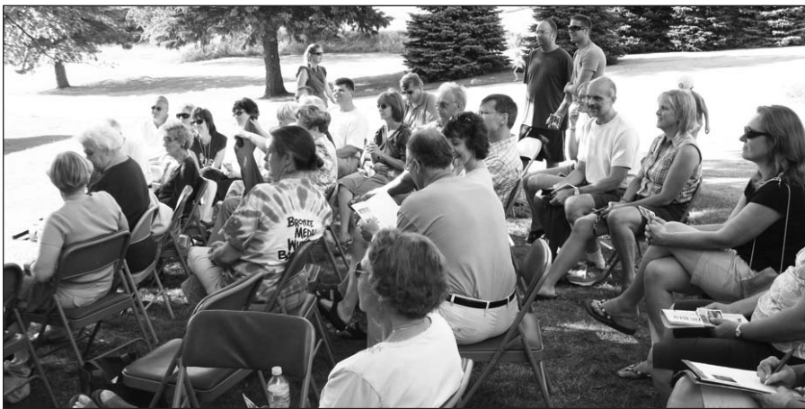
Ateitininkų studijų savaitgalis Dainavoje.

◆ Rugsėjo 12 d., šeštadienį, 6 val. v. Ateitininkų Namų 30 metų sukakties šventė vyks Ateitininkų namuose, 1380 Castlewood Dr Lemont, IL.