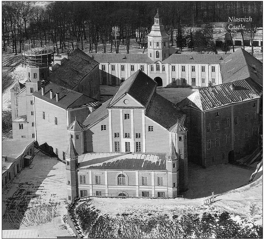
Nesvyžiaus Radvilų pilies.