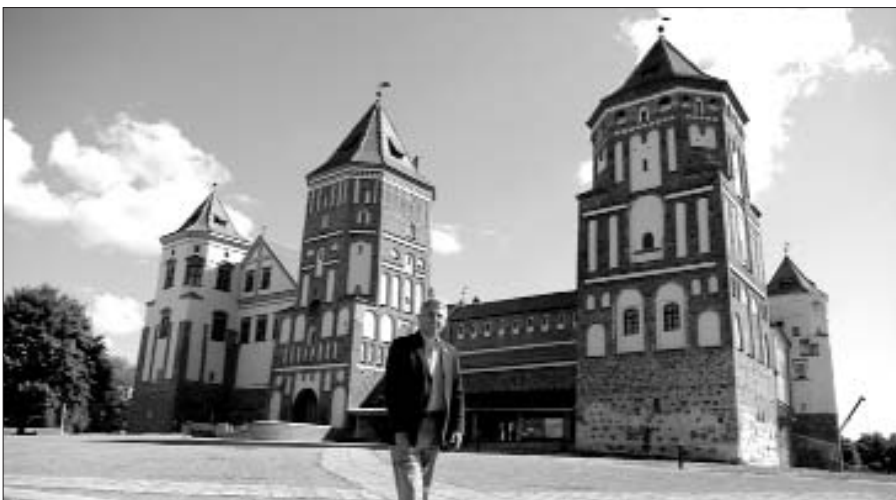
Užsienio reikalų ministras Vygaudas Ušackas prie Myriaus pilies Baltarusijoje.

Vilnius , rugpjūčio 25 d. (ELTA) – Užsienio reikalų ministras Vygaudas Ušackas siūlo apsvarstyti galimybę įkurti Lietuvos ir Baltarusijos istorinės atminties forumą, bendradarbiauti abiejų šalių nacionaliniams dailės muziejams siekiant sutvarkyti ir išsaugoti Lietuvos Didžiosios Kunigaikštystės (LDK) paveldo objektus, parengti kelionių vadovą LDK keliais.