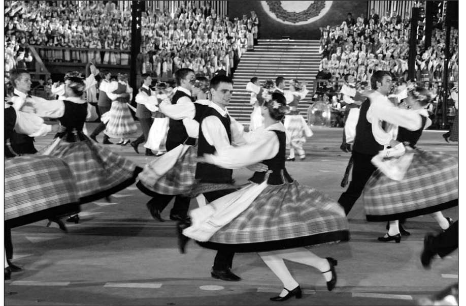
Ansamblių vakaras Kalnų parke.