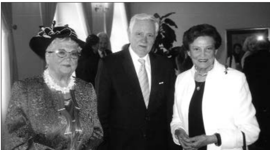
Buvęs Lietuvos Respublikos prezidentas Valdas Adamkus dalyvavo daugelyje Lietuvos vardo paminėjimo tūkstantmečio renginių bei priėmimų.