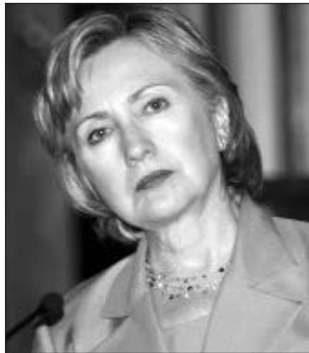
H. Clinton sako, kad net ir įgijęs branduolinį ginklą Iranas netaptų labai stipresnis.

Izraelio dienraštis „Haaretz“ rašo, kad Washington paprašė 10 valstybių, turinčių gausius urano išteklius, atidžiau kontroliuoti šios medžiagos pardavimą Teheranui. JAV tikisi, kad Irano urano atsargos pasibaigs jau 2010 metais. Dokumentas, raginantis atidžiau kontroliuoti urano pardavimus, nusiųstas Rusijai, Kanadai, Australijai, Prancūzijai, Vokietijai, Didžiajai Britanijai, Kazachstanui ir dar 3 valstybėms.