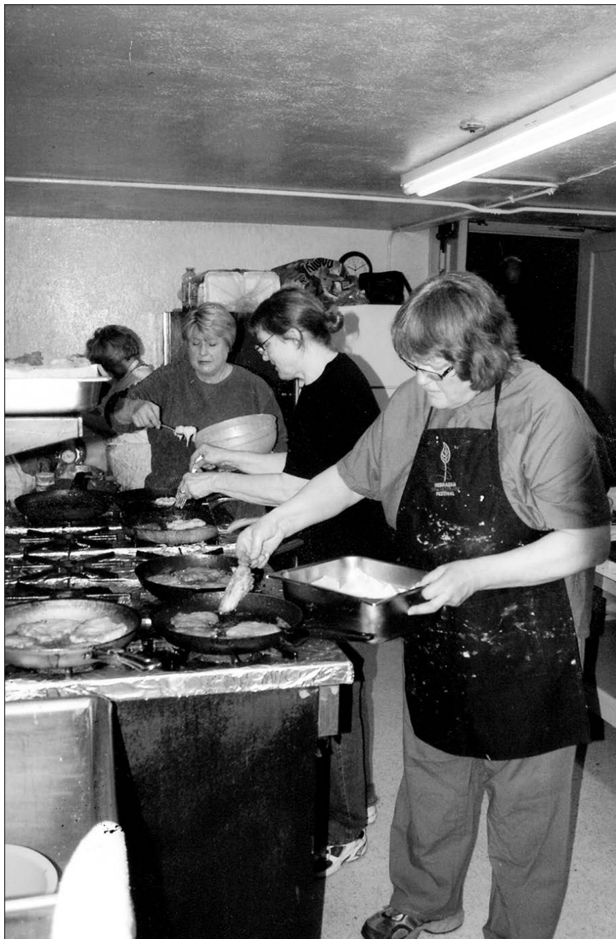
Omaha moterų klubas ruošė blynų priešpiečius.