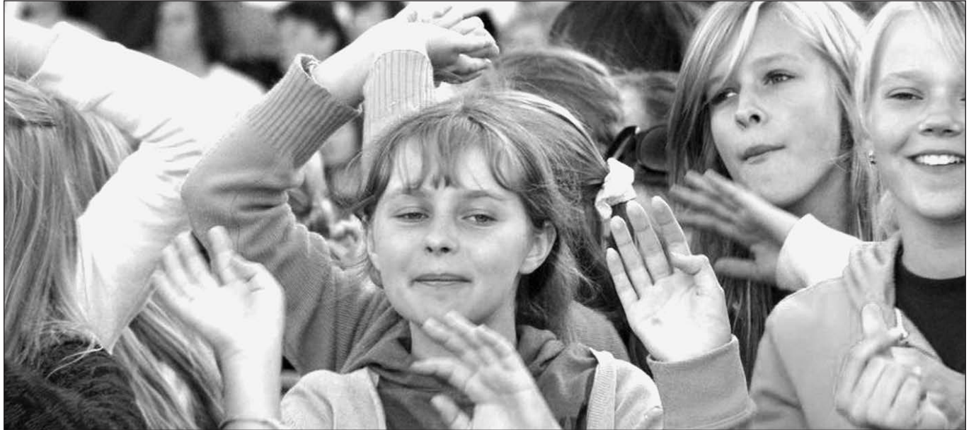
Vilnius, 2009 m.

Pažvelkime į statistiką. Norint išlaikyti krašto kultūrą reikia išlaikyti minimalų gimstamumą – 2.11 vaikų šeimoje. Jei gimsta 1.9 vaiko, dar nebuvo tokio atvejo, kad būtų sugrąžinta kultūra, o jei gimsta 1.3 vaiko, tada apskritai neįmanoma kultūros susigrąžinti. Pažiūrėkime, kas šiuo metu vyksta Europoje. Prancūzijoje gimstamumas yra 1.8 vaiko, Anglijoje – 1.6, Graikijoje – 1.3, Vokietijoje – 1.3, Italijoje – 1.2, Ispanijoje – 1.1 ir t.t. Europos Sąjungos 31 krašte gimstamumas yra 1.38 vaiko, tačiau gyventojų skaičius nemažėja, o 90 proc. atvykstančių į Europą yra musulmonai, tad krikščionybė aki-vaizdžiai nyksta. 2050 m. Vokietija bus musulmonų valstybė, Europoje už poros dešimtmečių trečdalis vaikų bus musulmonai. JAV padėtis šiek tiek skirtinga. Nors vaikų gimstamumas yra 1.6 vaiko, tačiau dauguma imigrantų yra iš Meksikos, kurie yra krikščionys. Lietuvoje gimstamumas 2003 m. buvo 1.43 vaiko, 2005 m. nukrito iki 1.19, o 2008 m. pakilo iki 1.22 vaiko. Kultūros likimas Lietuvoje yra pasiekęs labai pavojingą ribą.