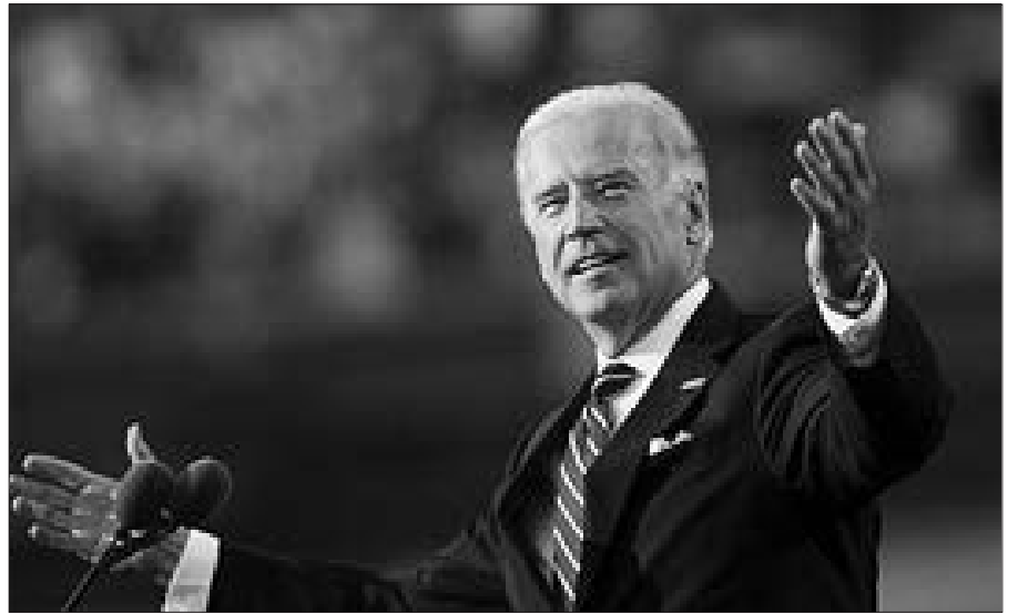
Joe Biden pabrėžė, kad Jungtinės Valstijos nori, jog Ukraina būtų stipri ir klestinti valstybė.

Ukrainos pareigūnai siekia užtikrinimo, kad Jungtinių Valstijų tikslas pagerinti įtemptus santykius su Rusija nebus įgyvendinamas Kije-