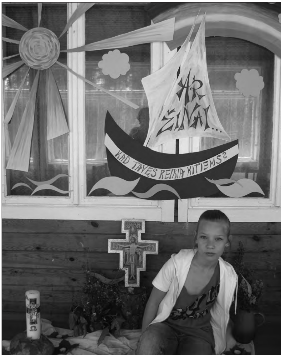
Nuotraukos iš „Vilties angelo“ stovyklos vaikams ir paaugliams bei jų mamoms.