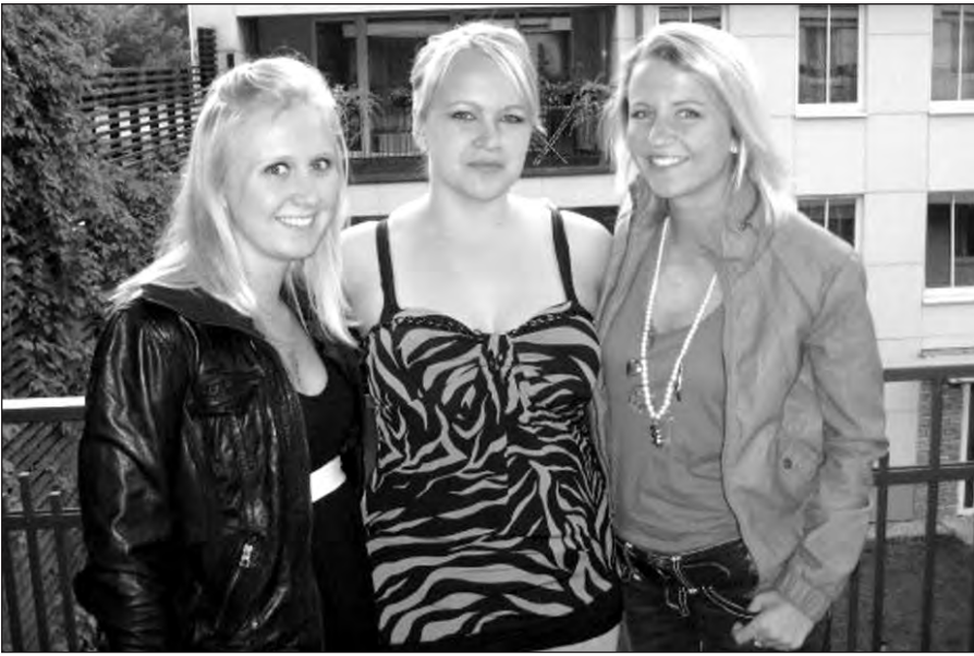
Linksmi leidžiame laiką savaitiniuose susirinkimuose.