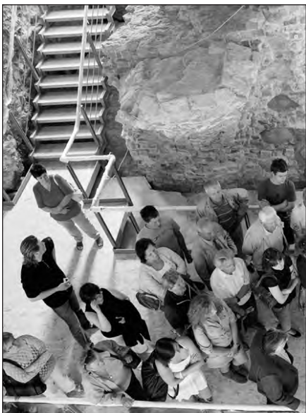
Ekspursija Valdovų rūmuose.

Liepos 7 d. atkurti, bet iki galo neįrengti Lietuvos Didžiosios Kunigaikštystės Valdovų rūmai pirmą kartą oficialiai atvėrė duris Lietuvos visuomenei bei užsienio svečiams. Čia kasdien nuo 11 val. r. iki 6 val. v. rengiamos nemokamos iš anksto užsiregistravusiųjų ekspursijos. Valdovų rūmų svečiai, apsilankę šioje svarbioje Lietuvai ir visai Europai istorinėje vietoje, pamato autentiškas senosios rezidencijos liekanas, Didįjį kiemą, atkurtus reprezentacinių salių interjerus ir išpūdingiausius jų elementus – portalus, krosnis, grindis, lubas, židinius. Kartu pristatoma didaktinė Lietuvos didžiųjų kunigaikščių rūmų