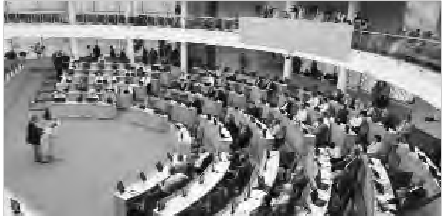
Seimas pritarė „Leo LT“ panaikinimui.

„Tokio „Leo LT“, koks buvo iki šiol, neturėtų likti“, – sakė premjeras Andrius Kubilius. Jo teigimu, sprendimas reikalingas „tiek dėl visuomenės nuomonės ir kompromitacijos viso energetikos reikalo“, tiek dėl Eu-