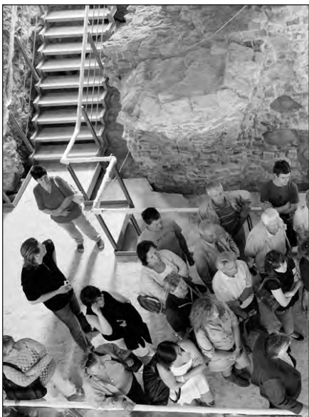
Ekskursija Valdovų rūmuose.

Liepos 7 d. atkurti, bet iki galo neįrengti Lietuvos Didžiosios Kunigaikštystės Valdovų rūmai pirmą kartą oficialiai atvėrė duris Lietuvos visuomenei bei užsienio svečiams. Čia kasdien nuo 11 val. r. iki 6 val. v. rengiamos nemokamos iš anksto užsiregistravusiųjų ekskursijos. Valdovų rūmų svečiai, apsilankę šioje svarbioje Lietuvai ir visai Europai istorinėje vietoje, pamato autentiškas senosios rezidencijos liekanas, Didįjį kiemą, atkurtus reprezentacinių salių interjerus ir išpūdingiausius jų elementus – portalus, krosnis, grindis, lubas, židinius. Kartu pristatoma didaktinė Lietuvos didžiųjų kunigaikščių rūmų