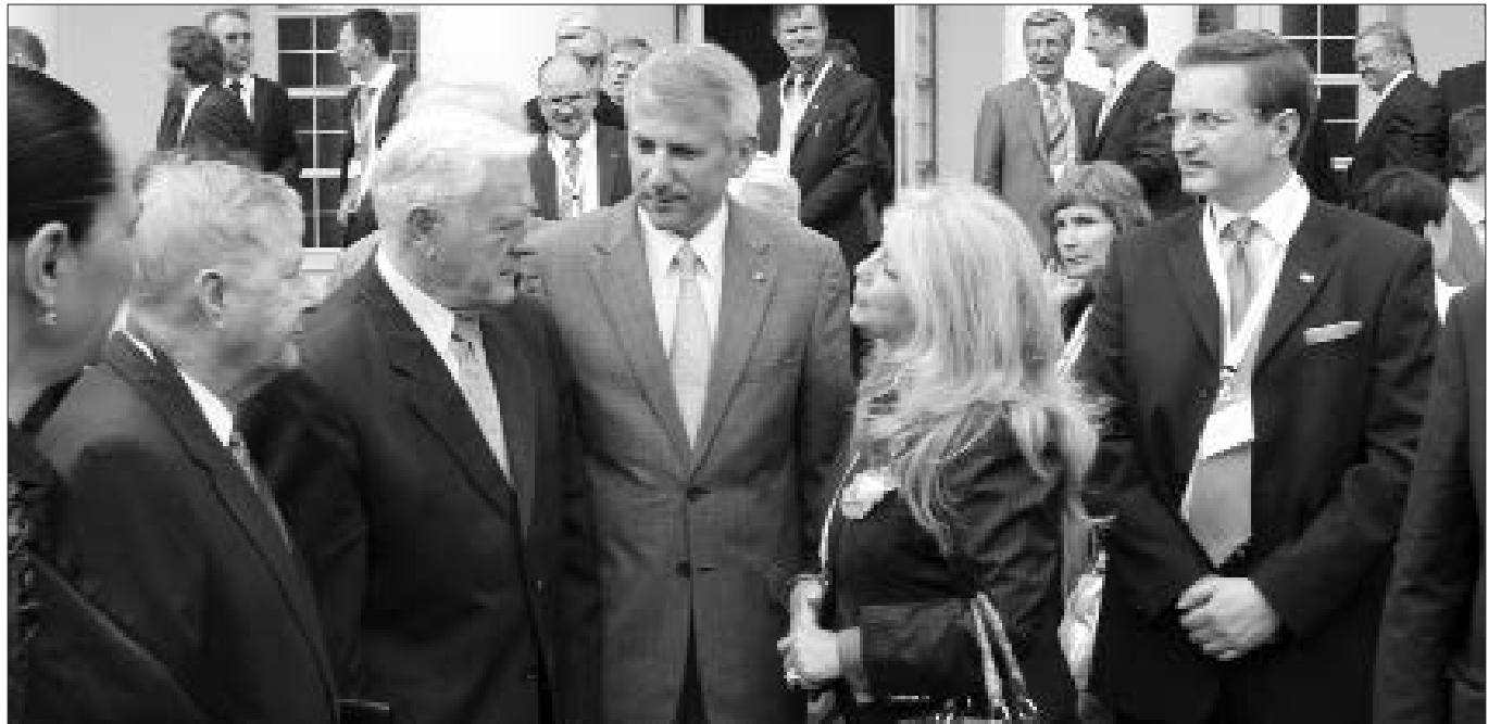
Vilnius, 2009 m. liepos 2 d. (ELTA) – Daugiau kaip 300 tautiečių iš 32 pasaulio šalių susirinko į trečiąją Pasaulio lietuvių ekonomikos forumą (PLEF), kuris ketvirtadienį prasidėjo Vilniuje, Prezidentūroje. Prezidentas Valdas Adamkus ir užsienio reikalų ministras Vygaudas Ušackas bendrauja su Pasaulio lietuvių ekonomikos forumo dalyviais.

NEWSPAPER - DO NOT DELAY - Date Mailed 07-02-09