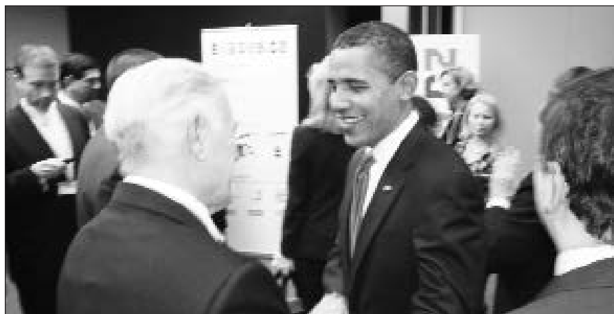
JAV prezidentas Barack Obama pasveikino LR prezidentą Valdą Adamkų ir visus lietuvius Lietuvos tūkstantmečio proga.

Vilnius, liepos 2 d. (ELTA) – Jungtinių Valstijų vadovas Barack Obama pasveikino prezidentą Valdą Adamkų ir visus Lietuvos žmones tūkstantmečio proga.