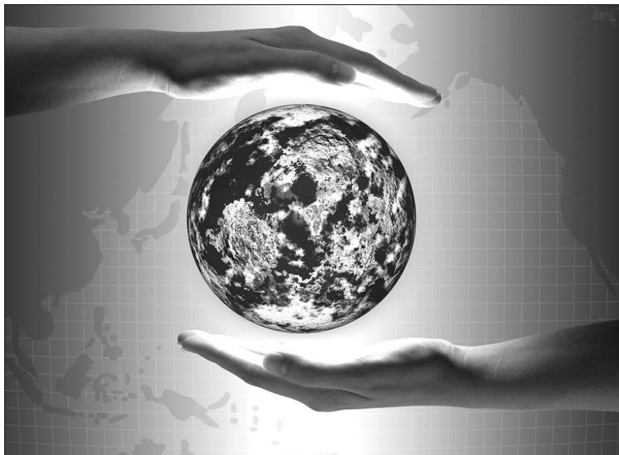
Taigi, kur mes esame klimato klausimu?

Šią žiemą lankydamasis Vilniaus Gedimino technikos universitete gavau progą dalyvauti Žemės dienos (Earth Day) šventėje. Atrodo, kad vyksta rimtas judėjimas. Gavau puikiai išleistą P. Baltrėno, D. Butkaus,