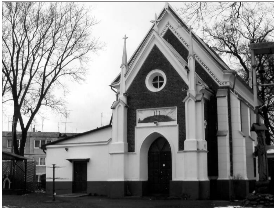
Alvito šv. Onos bažnyčia.

Atkarpos tęsinį skaitykite kitą šeštadienį.