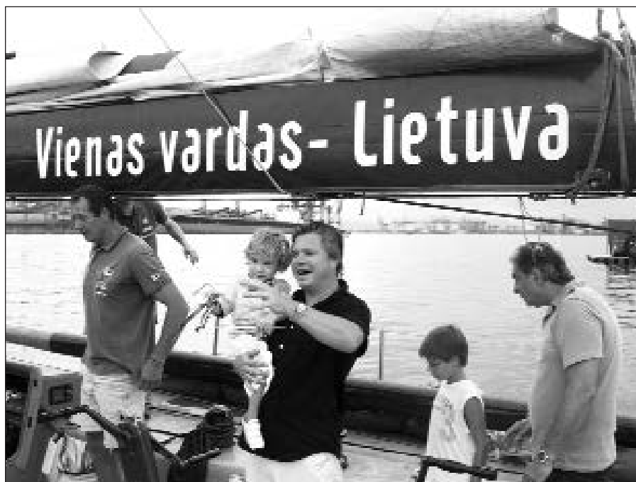
„Ambersail“ šūkis – „Vienas vardas Lietuva“.

Šiame epiniame žygyje reikia ne tik mūsų lietuvių herojų fizinio pa-siruošimo, mus stebina emocinė pu-siausvyra ir altruizmas buriuotojų, kurie visam pasauliui parodo besąly-ginę meilę savo tautai. Ne veltui žy-gis pavadintas „Tūkstantmečio odi-sėja“ ir jo šūkis – „Vienas vardas – Lietuva“. Beje, pagal Houaiss brazi-lišką žodyną, odisėja reiškia „ilgą ke-lionę, pažymėtą avantiūrą su nenu-matytais ir unikaliais nuotykiams“. Drįstu pridurti, kad mūsų buriuoto-jams Odisėja reiškia dar daugiau – įveikiant vandenyną, skleisti idealą ir