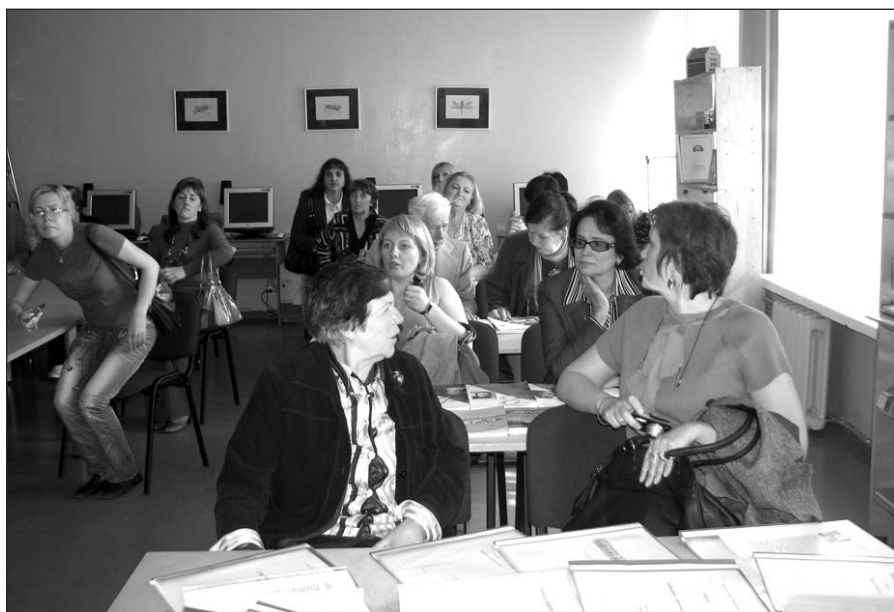
Seminaro dalyviai Šiaulių „Santarvės” vidurinėje mokykloje.