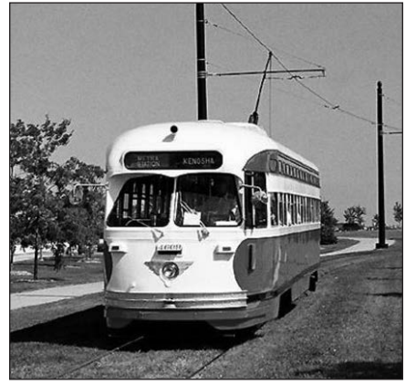
Kenosha galite pasivažinėti tramvajumi.

Palapsniui Kenosha tapo industriniu miestu. 1902–1988 metais šio miesto fabrikuose buvo pagaminta milijonai automobilių. „The Thomas B. Jeffery Company“, „American Motors Corporation“ ir daugelis kitų – gerai žinomos amerikiečiams. Daugelyje tų kompanijų dirbo ir lietuviai,