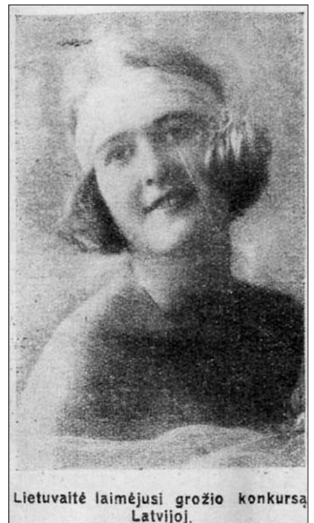
Lietuvaite laimėjusi grožio konkursą Latvijoje.

1927 m. rašoma, kad žurnalo „Jauna Nedelia“ suorganizuotame Latvijos grožio konkurse laimėjo lietuvaite iš Panemunėlio, gyvenanti Latvijoje.