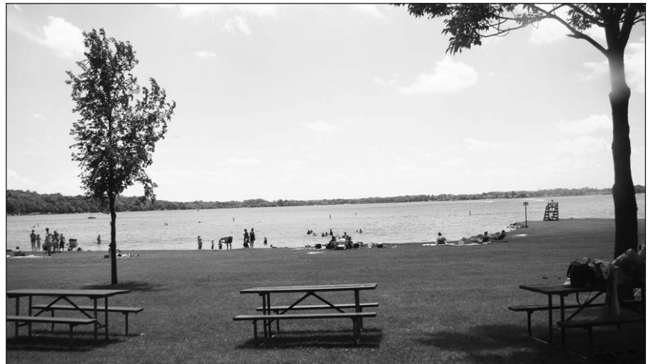
Silver Lake ežeras.

Pereitais metais duris atvėrė Pilietinio karo muziejus (The Civil War Museum, 5400 First Ave., Kenosha, WI 53140; tel.: 262-653-4140). Tai vienintelis muziejus visoje Amerikoje, kur taip pilnai atskleidžiama šios šalies pilietinio karo istorija. Muziejuje veikia ne tik pastovi ekspozicija, čia organizuojama nemažai parodų. Štai liepos 18 d. numatoma atidaryti parodą „Abraham Lincoln – A Dramatic Bicentennial Tribute“. Prie muziejaus veikia teatras, statan-