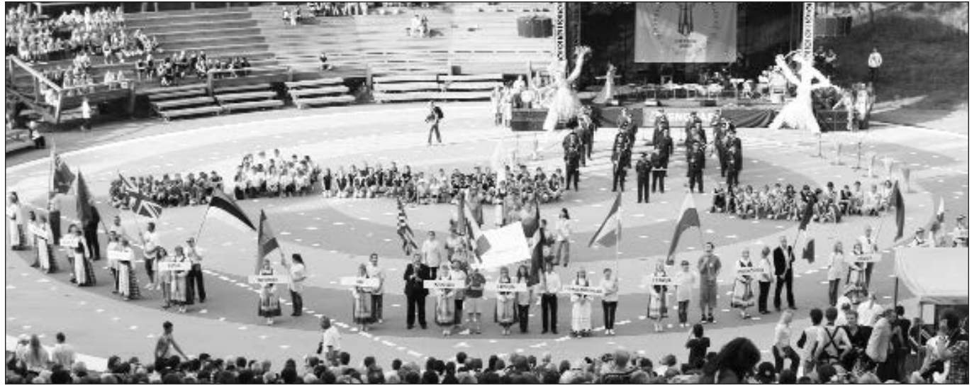
VIII Pasaulio lietuvių sporto žaidynių atidarymo akimirka.