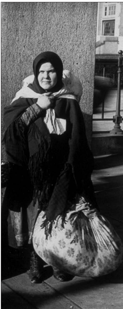
Ellis Island, 1915 m.

Šių įvykių fone tegul meilė Lietuvai nuskamba aplink pasaulį ir dar giliau išsiskaidys mūsų širdyse!