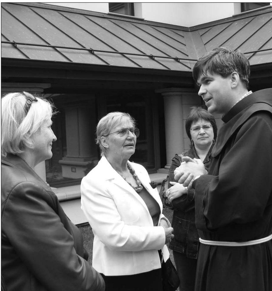
Vienuolyne prie Kryžių kalno.