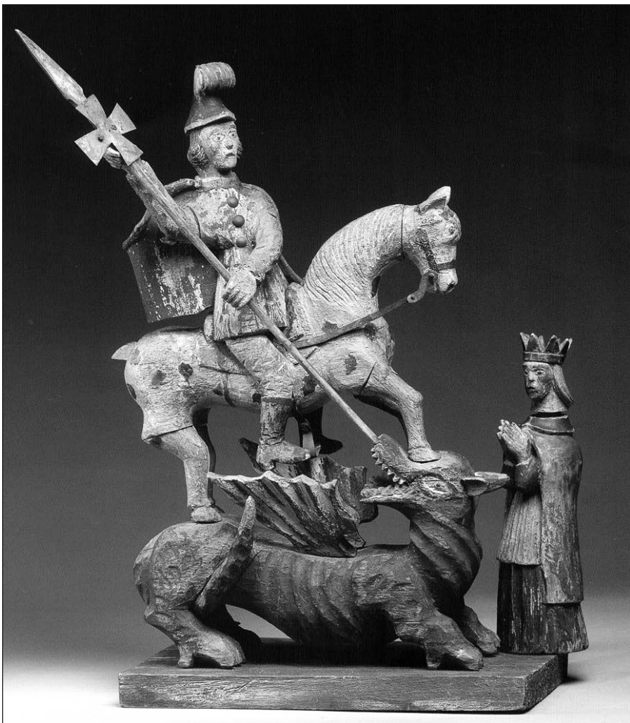
„Kryždirbystė Lietuvoje“ šiuo metu „vieši“ Lietuvių dailės muziejuje, PLC. Šv. Jurgis. XIX a. pabaiga.