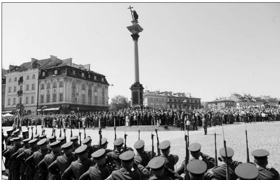
Rusai teigia, kad Lenkija atsisakė įvykdyti „pagrįstus“ Adolfo Hitlerio reikalavimus atiduoti naciams dalį savo teritorijos.