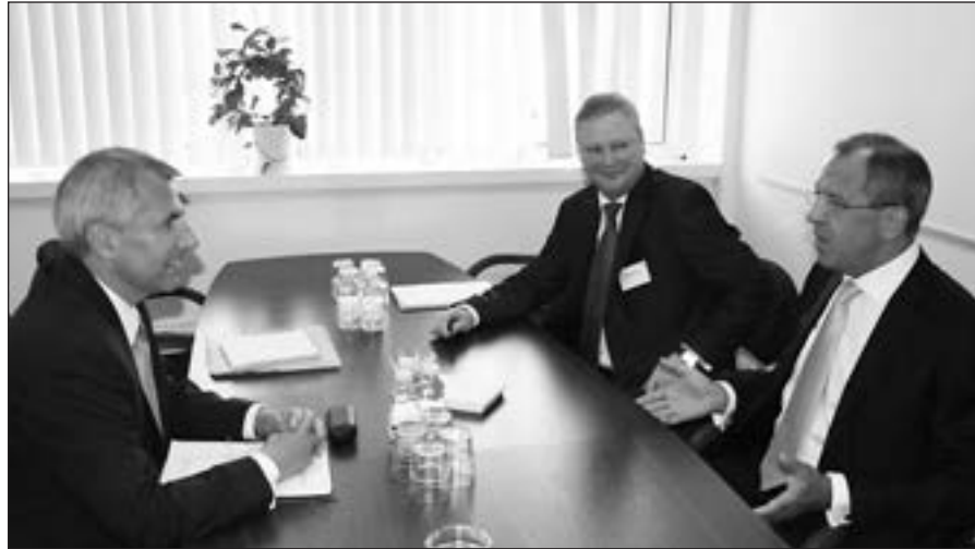
Lietuvos užsienio reikalų ministras Vygaudas Ušackas (k.) susitiko su Rusijos užsienio reikalų ministru Sergej Lavrov (d.).

Vilnius , birželio 4 d. (BNS) – Užsienio reikalų ministras Vygaudas Ušackas Danijoje susitikęs su Rusijos diplomatijos vadovu Sergej Lavrov sakė, kad Lietuva yra suinteresuota palaikyti abipusiškai naudingus bei teisingumu grįstus dalykinius santykius.