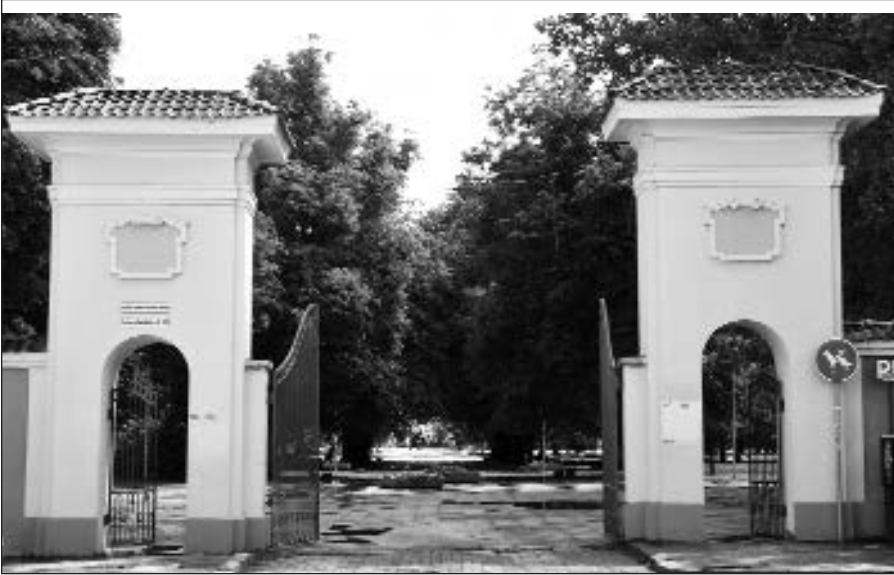
Vilnius , birželio 4 d. (ELTA) – Sostinės valdžia puoselėja viltį antram gyvenimui prikelti Vilniaus Sereikiškių parką ir jį paversti patraukliu poilsio ir pramogų centru. Parengtame Sereikiškių parko pertvarkos projekte norima sugrįžti prie parko vaizdo 1895 metais.