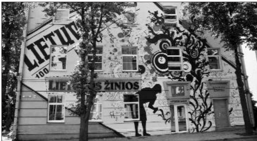
Redakcijos pastatas Žvėryne šimtmečio proga pasipuošė išraiškingais piešiniais.