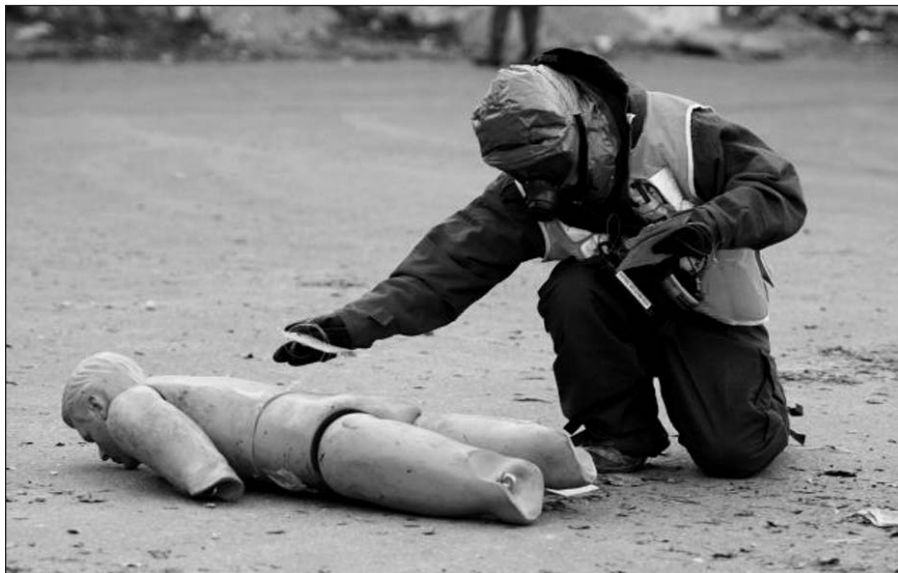
Karinėse pratybose dalyvauja visa tauta.

Vilnius , birželio 1 d. (AFP/BNS) – Izraelyje sekmadienį prasidėjo pačios didžiausios šalies istorijoje karinės pratybos, kuriose dalyvauja visa tauta. „Turning Point 3“ pavadinti mokymai, kurie truks iki ketvirtadienio, skirti pasiruošti didelio masto karo veiksams.