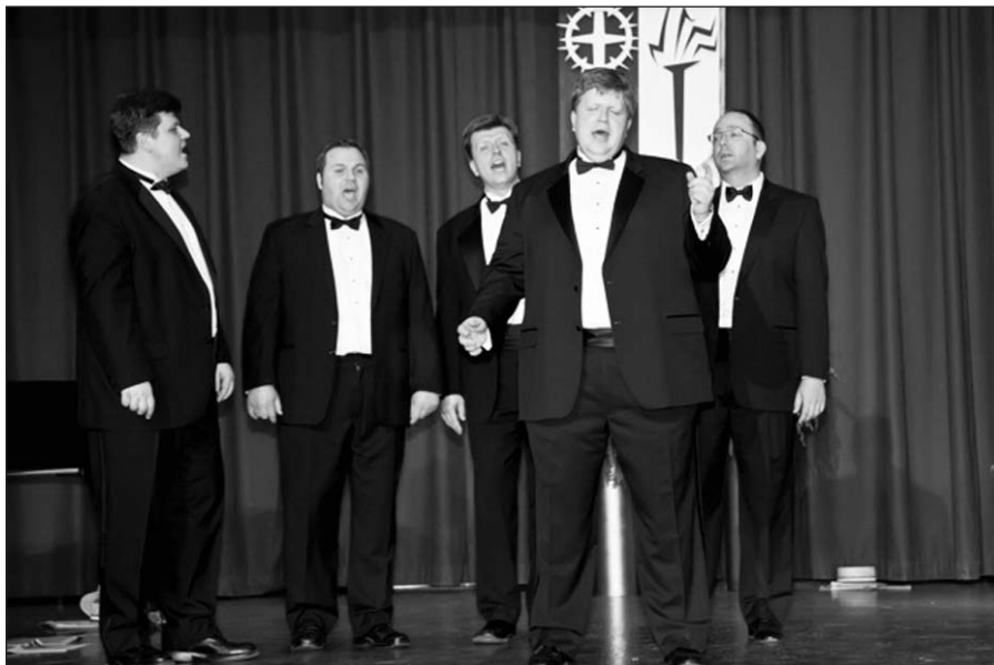
„Tėviškės žiburių“ gimtadienio dovana buvo „Dainavos“ vyrų ansamblio koncertas.

Lai ši pakili nuotaika ir gražiausi linkėjimai įkvepia visus „Tėviškės žiburių“ darbuotojus tolesniam darbui ir ateities gimtadieniams.