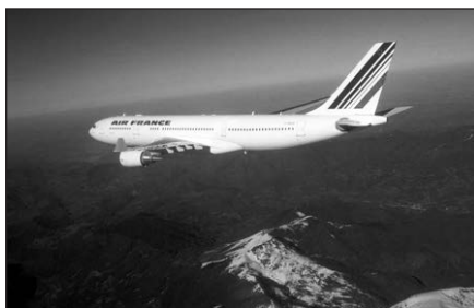
Lėktuvu „Airbus A330“ daugiausia skrido iš atostogų grįžtantys prancūzai.

Lėktuvas tikriausiai dingo virš Atlanto vandenyno dėl nelaimingo atsitikimo, o ne buvo pagrobtas, pirmadienį sakė Prancūzijos ekologijos,