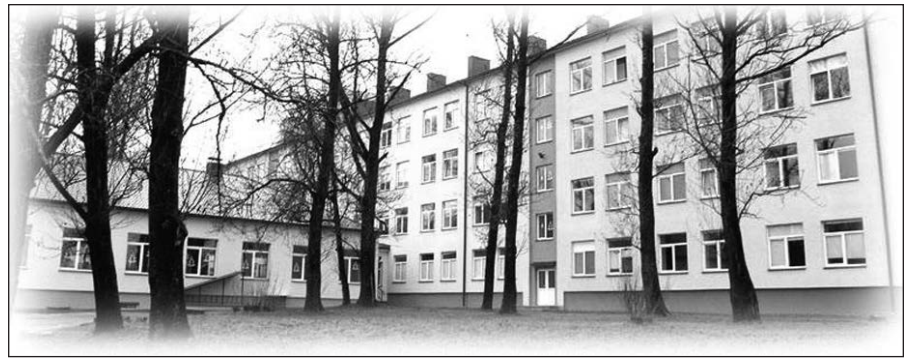
Mokykla „Lietuvių namai“ Vilniuje.