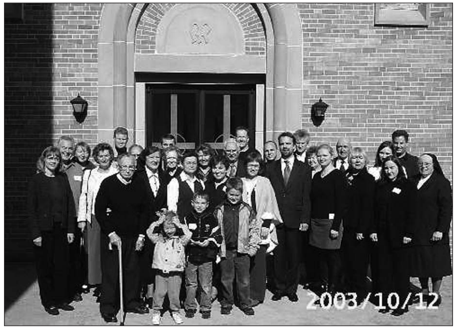
Susiatrinimo šventės, vykusios 2003 m. Putnam, dalyviai prie bažnyčios.

Daugiau informacijos: www.zemaiciukalvarija.lt