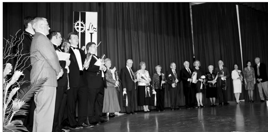
Šventės pabaigoje „Tėviškės žiburių“ redaktoriai, administracija, pagalbinkai ir svečiai iš Čikagos buvo apdovanoti dovanėlėmis.