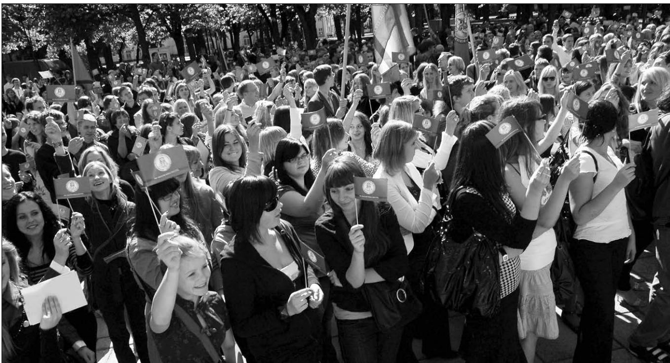
VDU studentai rugsėjo pirmosios šventėje 2008 metais.

Esame vieningi dar vienu pagrindu: visi esame dvidešimčiai metų senesni. Jaučiame, kaip laiko ir erdvės vientisas laukas saisto mūsų žmogiškas galimybes fizinėje tikrovėje. Tačiau, nors ir praėjo du dešimtmečiai, ar ne tiesa, kad daugelis jaučiamės išsaugoje dvasinę jaunystę ir galime toliau Nukelta į 9 psl.