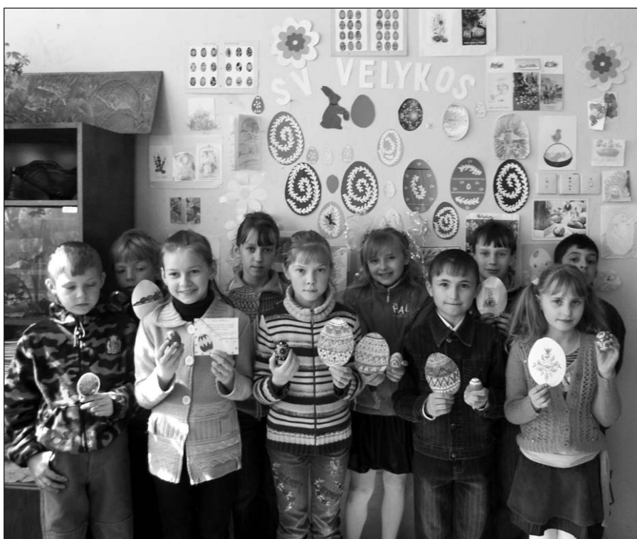
Va, kokie gražūs mūsų margučiai.

„Drauge“ galima įsigyti puošnius vestuvinius pakvietimus. Tel. 773-585-9500