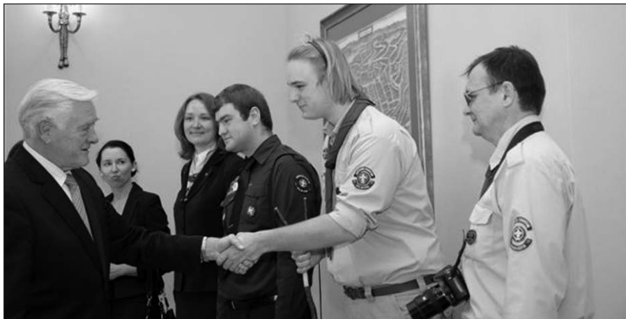
LR Prezidentas Valdas Adamkus priėmė Lietuvos skautijos ir Pasaulinės skautų organizacijos fondo atstovus.