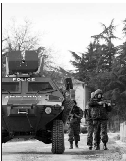
Gruzija pastarosiomis savaitėmis išgyvena politinį nestabilumą.

Maištas kilo po Vidaus reikalų ministerijos pranešimo, kad ji atskleidė Rusijos remiamą sąmokslą nuversti vyriausybę ir suėmė įtariamą organizatorių. Sąmokslininkai, ku-