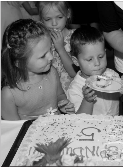
Neseniai „Spindulėlis“ šventė savo penketį.

◆ Kviečiame apsilankyti vaikų darželyje „Spindulėlis“ gegužės 7 d. (ketvirtadienį) ir 8 d. (penktadienį) organizuojamos Atvirų durų dienos. Nuo 10 val. r. iki 12 val. p. p. galėsite susipažinti su darželio vaikų veikla, apžiūrėti vaikų darbelius, užsiregistruoti naujiems mokslo metams. Tęsiasi registracija į paruošiamąją klasę (Kindergarten) 2009 – 2010 m. m. Lietuviškai kalbantys vaikai ruošiami sklandžiam perėjimui mokytis angliškai pirmoje klasėje. Iš anksto susitarus galite mus aplankyti gegužės mėnesį penktadieniais. Laukiame. Mūsų adresas: 9000 S. Menard Ave., Oak Lawn, IL 60453. Tel.: pasiteiravimui: 708-422-1433.