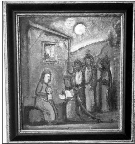
Ši P. Domšaičio paveikslą Lietuvių Fondas 2007 m. padovanojo Balzeko lietuvių kultūros muziejui.

Manoma, kad iš viso dailininkas yra sukūręs per 900 paveikslų. Jų yra Vokietijos ir Pietų Afrikos muziejuose, Australijos ir Amerikos žemynuose, galerijose ir privačiose kolekcijose, jie yra paklausūs pasauliniuose meno aukcionuose.