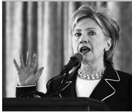
JAV valstybės sekretorė Hillary Clinton

Komiteto pirmininko demokrato Howard Berman paklausta, kiek gali prireikti laiko, kad būtų pasiekta re-