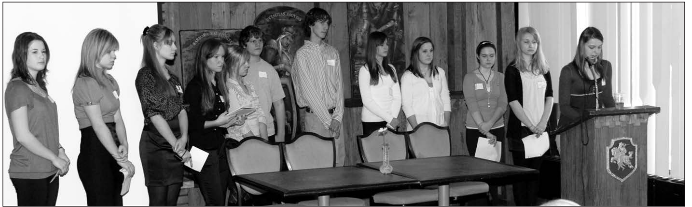
Maironio lituanistinės mokyklos Lemont moksleiviai.

Mums, suaugusiems, Lietuva suteikia prasmę mūsų veiklai išemigravavę, kad nesijustume tarsi pakibę tarp žemės ir dangaus. O ką apie savo lietuvišką šaknis galvoja jaunoji karta? Maironio lituanistinės mokyklos abiturientai ir devintų klasių atstovai savo mintis turėjo progą išsakyti vasario mėnesį Pasaulio lietuvių centre (Lemont, IL) vykusiame Laisvės premijos politinių studijų savaitgalio moksleivių simpoziume. Maironio lituanistinė mokykla garsi ne tik tuo, kad tai didžiausia lietuvių mokykla už Lietuvos ribų. Ją baigusieji plačiai dalyvauja lietuvių bendruomenės ir organizacijų veikloje. Buvę mokyklos auklėtiniai važiuoja į Lietuvą ir dirba labdaros organizacijose, globojančiose benamius vai-