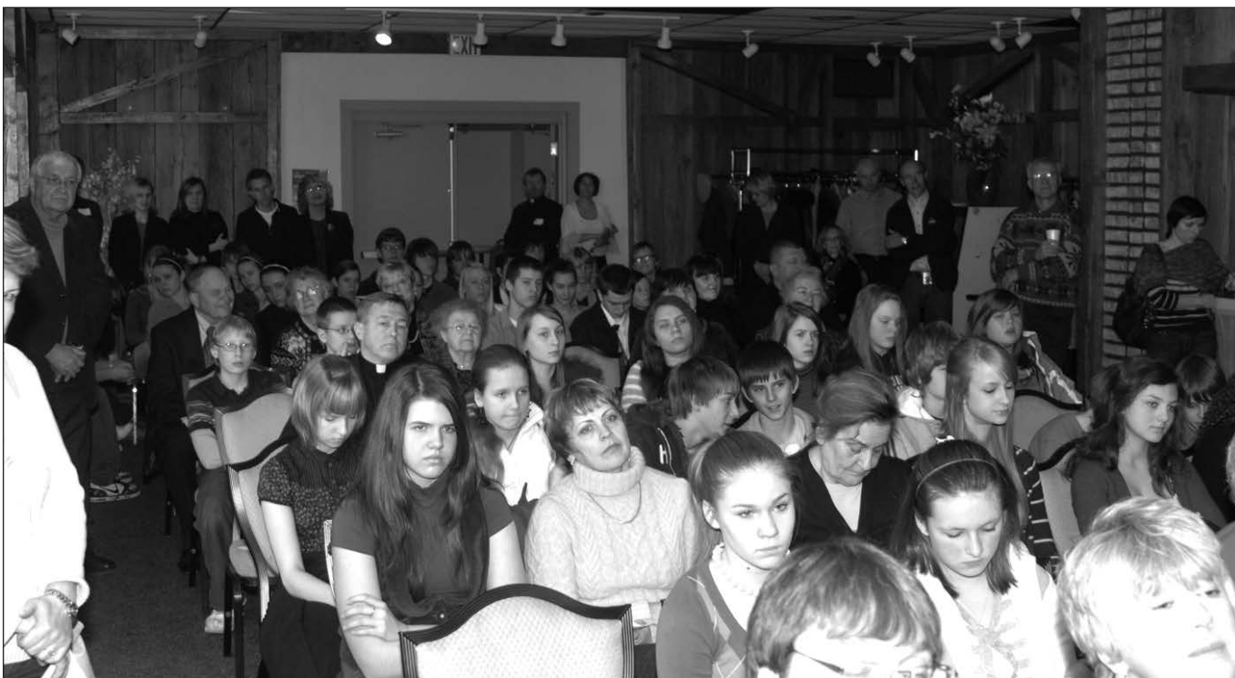
Žiūrovai ir moksleiviai Laisvės premijos politinių studijų savaitgalio moksleivių simpoziume.