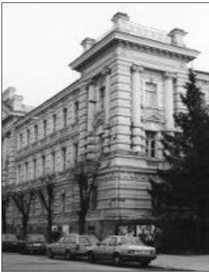
Ypatingasis archyvas Vilniuje, kuriame saugomos KGB bylos.

Vilnius , balandžio 23 d. (BNS) – Kadangi buvo pavišintos slaptųjų sovietų saugumo bendradarbių pavardės, reikėtų paskelbti ir buvusių kadrinių KGB darbuotojų pavardes – tai numatančią įstatymo pataisą Seime įregistravo parlamento Nacionalinio saugumo ir gynybos komiteto