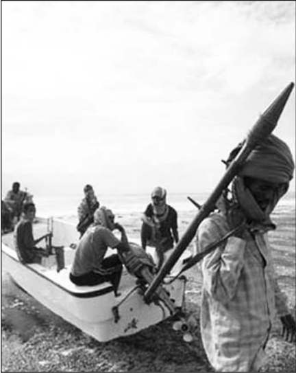
Vien šiais metais piratai puolė daugiau nei 80 laivų.

Nairobi , balandžio 20 d. (AP/BNS) – NATO sraigtasparniams ir karo laivams paleidus kelis išpėjamuosius šūvius baigėsi Norvegijos tanklaivį Adeno įlankoje puolusių 7 Somalio piratų dramatiškos gaudynės.