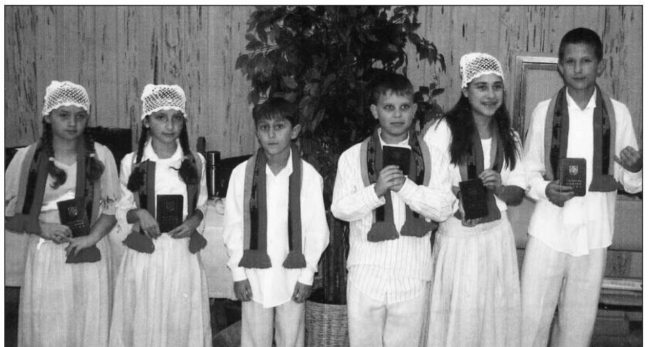
Palm Beach apylinkės jaunimas, dalyvavęs minėjimo meninėje programoje.