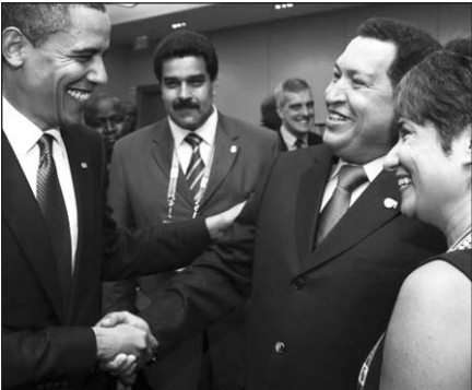
B. Obama spaudžia ranką Hugo Chavez.

Vilnius , balandžio 20 d. (BNS/Balsas.lt) – JAV prezidentas Barack Obama pareiškė, kad sieks naujų santykių su Kuba bei „lygios partnerystės“ su kitomis Amerikos šalimis, rašo BBC. B. Obama dalyvavo Amerikos viršūnių susitikime Trinitade ir Tobage.