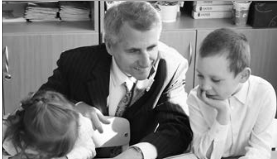
Vygaudas Ušackas aplankė Seinų „Žiburio“ gimnazijos moksleivius.

Seinai/Punskas , balandžio 20 d. (ELTA) – Plėsti Lenkijos ir Lietuvos ryšius skatinant bendravimą tarp žmonių, užmezgant glaudžius ryšius tarp mokyklų, bendruomenių, nevyriausybinių ir religinių organizacijų susitikimuose kvietė Seinuose ir