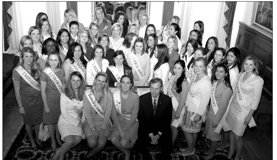
Šių metų vyšnių žydėjimo festivalio dalyvės apsilankė Lietuvos ambasadoje Washington, DC.

◆ Jaunųjų ateitininkų sąjungos stovykla Dainavoje vyks liepos 5–15 d. 7–14 metų amžiaus vaikams. Stovyklos programa vyks lietuvių kalba. Registracijos anketos tinklalapyje www.ateitis.org .