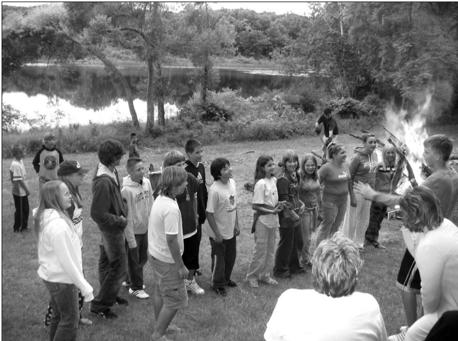
Smagu stovykloje prie laužo.