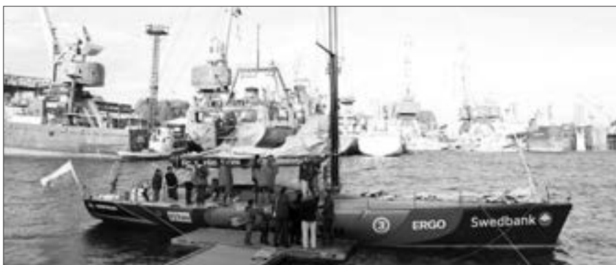
Balandžio 16 d. New York pasiekę buriuotojai susitiks su Šiaurės Amerikos lietuviams.