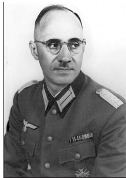
Majoras Karl Page, išgelbėjęs ne vieną žydų šeimą.

Parodoje šalia majoro Plage gyvenimo apybraižų pateikiama ir platesnė istorinė apžvalga – dėmesys skiriamas Lietuvos istorijai bei išskirtinei Lietuvos žydų istorijai, neatsiejamai nuo Vilniaus – jų dvasinės sostinės. Taip pat aptariamas metodiškas Lietuvos žydų naikinimas.