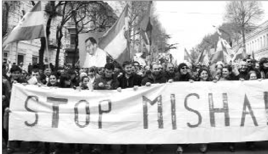
Tbilisio gatves vėl užvėdė dešimtys tūkstančių protestuotojų.

Vilnius , balandžio 13 d. (ELTA) – Gruzijoje kelias dienas nesiliauja protesto akcijos, nukreiptos prieš šalies vadovą Michail Saakašvili. Gruzijos opozicijos vadovų surengtoje protesto akcijoje Tbilisio centre praėjusią savaitę dalyvavo apie 50