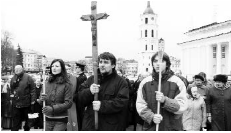
Tradicinė Kryžiaus kelio procesija Vilniuje.