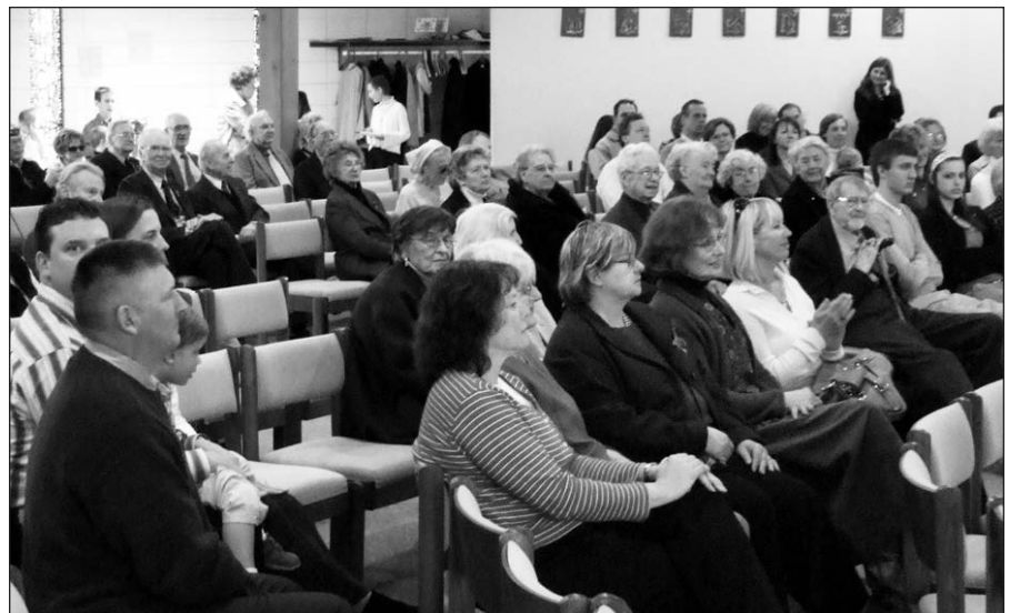
Smagu buvo matyti, kad susidomėjimą renginiu parodė ne tik abiejų paskutinių emigracijos bangų lietuviai, bet trečios ar net ketvirtos kartos vietiniai lietuvių kilmės amerikiečiai!