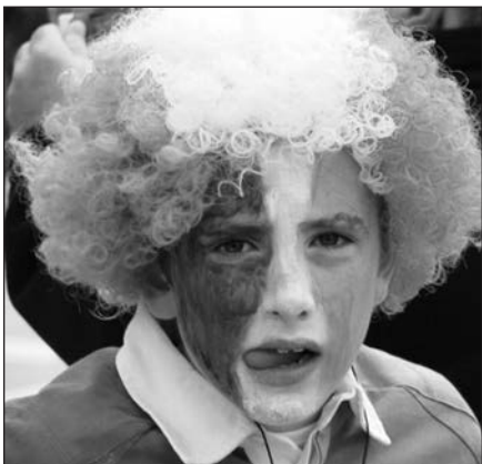
Šv. Patriko dienos dalyvis.

Savo mokymuose misionierius nevengdavo naudoti trilapį dobilą šv. Trejybei aiškinti, o pagonys airiai pradėjo dabindavo jais rūbus. Būtent iš čia atkeliavo tradicija dėvėti kuo daugiau žalios spalvos per Šv. Patriko dieną.