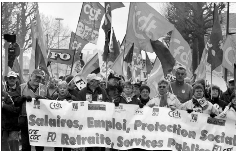
! Prancūzijos gatves išėjo minios protestuotojų.

Popiežius Benediktas XVI musulmonų vadovams pareiškė, kad tikra religija turi atmeti prievartą. Taikų krikščionių ir musulmonų gyvenimą popiežius pavadino gaire, kuria turi sekti kitos Afrikos tautos. Kamerūno sostinės futbolo stadione, kuriame popiežius aukojo šv. Mišias, Benediktą XVI pasitiko 40 tūkst. žmonių minia. Popiežius antrąją savo vizito Kamerūne dieną ragino vyskopus ginti vargšų teises ir esmines Afrikos šeimų vertybes, bet aplinkos reakcijoje vyravo komentarai apie jo nusistatymą prieš prezervatyvus.