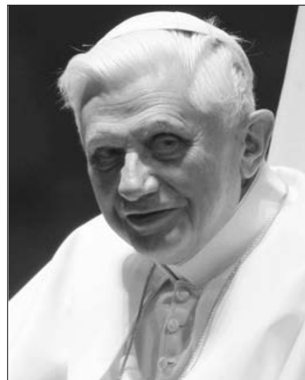
Popiežius Benediktas XVI.