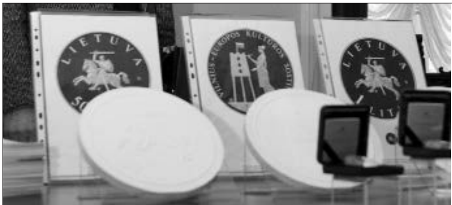
Monetoje pavaizduota piešianti mūza.