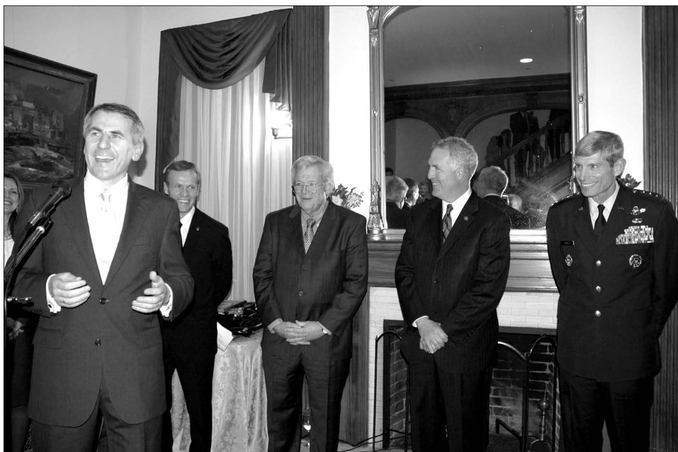
V. Ušackas pasidžiaugė, kad pagaliau šis labai svarbus Lietuvos atstovybės kampelis prasiplėtė, pastatas padidėjo dvigubai.