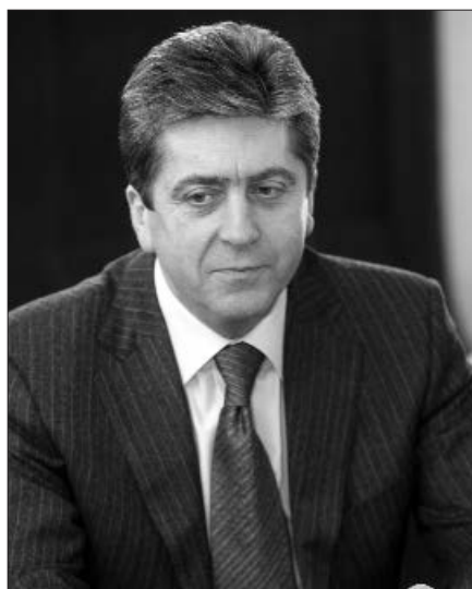
Lietuvoje vieši Bulgarijos prezidentas Georgi Parvanov.