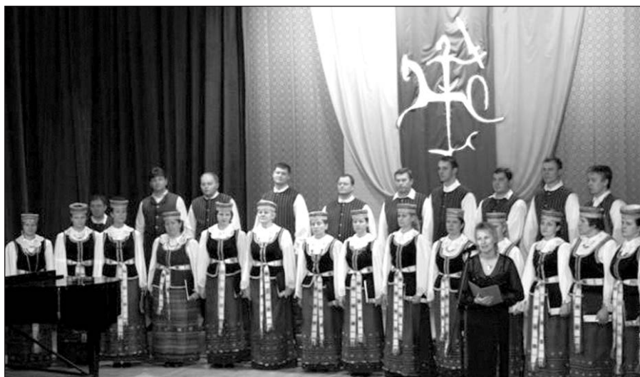
Projekto LT 1000 komanda įamžino Vasario 16-osios renginį Punske (Lenkija).