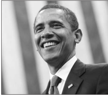
JAV prezidentas Barack Obama

Ataskaitoje teigiama, kad būtina užkirsti kelią Rusijos pastangoms atkurti ankstesnę įtakos buvusios Sovietų Sąjungos ribose, tačiau administracija taip pat raginama „iš naujo