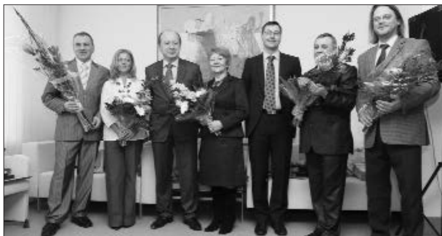
Vyriausybės vadovas įteikė premijas geriausiems 2008 metų mokytojams.