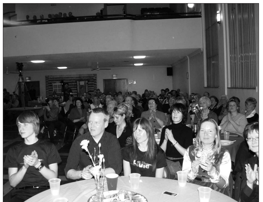
Gausiai susirinkę žiūrovai negalėjo plojimū. Priekyje sėdi University of Illinois at Chicago studentai.