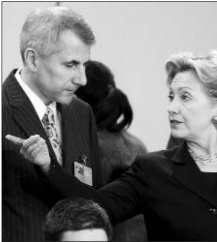
Lietuvos užsienio reikalų ministras V. Ušackas ir JAV valstybės sekretorė H. Clinton.

Briuselis , kovo 5 d. (ELTA) – Briuselyje vykstančiame NATO užsienio reikalų ministrų susitikime kilo ginčas dėl santykių su Rusija atnaujinimo.