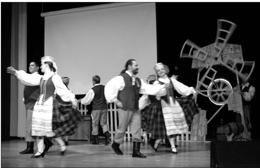
Smagiai sukasi „Suktinio“ poros.