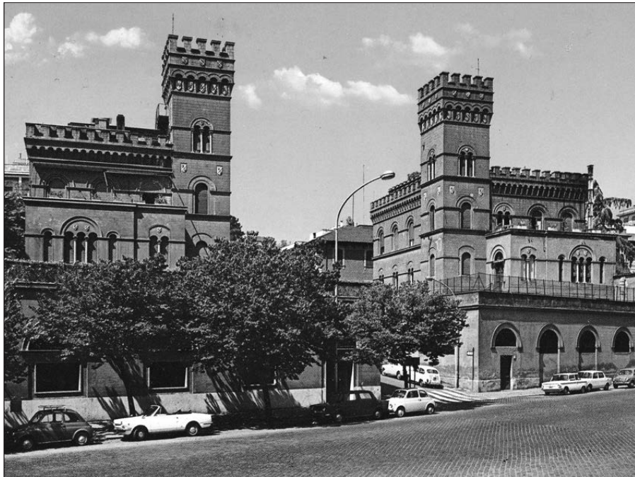
Villa Lituania ir Lietuvos Kolegija Romoje.