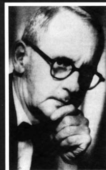
Kompozitorius, pianistas, kritikas, publicistas, pedagogas