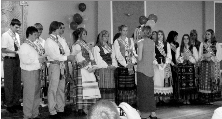
Maironio lituanistinės mokyklos moksleiviai atsisveikina su mokykla 2008 m.