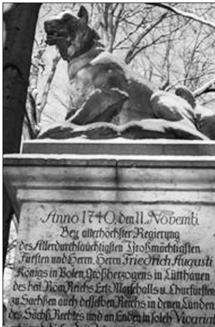
Vilko paminklas Saksonijoje.

Yra atminimo ženklų be datos. Prie Hanoverio paminkliniu akmeniu paminėtas nuo priešistorinių laikų egzistavęs vilkų takas Maskva-Ardėnai (Ardėnai – tai kalnai Belgijos, Liuksemburgo ir Prancūzijos teritorijose). Vilkai keliaudami instinktyviai laikėsi vieno kelio, nes jame buvo palyginti saugu ir sotu.