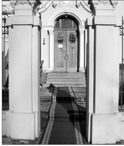
Garbingiems svečiams Šiauliuose buvo patiestas raudonas kilimas.

Vilnius , vasario 11 d. (URM/„Draugo“ info) – Lietuvos užsienio reikalų ministras Vygaudas Ušackas su Šiaulių miesto savivaldybės ir verslo atstovais aptarė investicijų pritraukimo ir eksporto skatinimo galimybes.