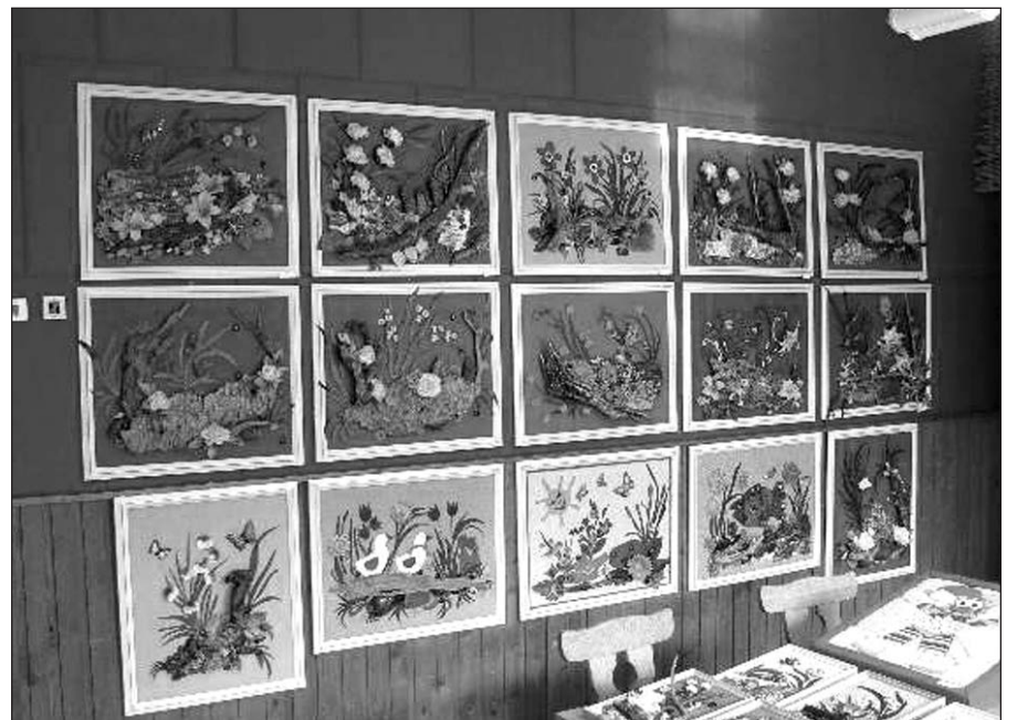
Darbelių paroda Viešvilės vaikų globos namų meno galerijoje.