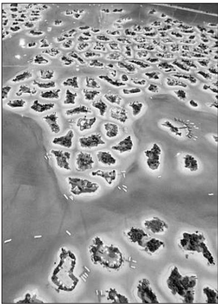
„Palm“ salų projektas Dubajuje.

Ko gero, niekas taip gerai neat-sispindi žmogaus puikybės kaip dirbtinės „Palm“ salos Dubajuje. Trijų salų kompleksas – „Palm Jumeirah“, „Palm Jebel Ali“ bei „Palm Deira“ – turėtų pridėti miestui 528 kilometrų pakrantės rėžį. Kai kurios „Palm Jumeirah“ salos dalys jau atvertos smalsioms lankytojų akims, o kitas žadama publikai pristatyti per ateinančius 10-15 metų. Planuojama, kad salos taps namais daugiau kaip 100 prabangių viešbučių, o „Palma Deira“ dydžiu prilygs Paryžiui.