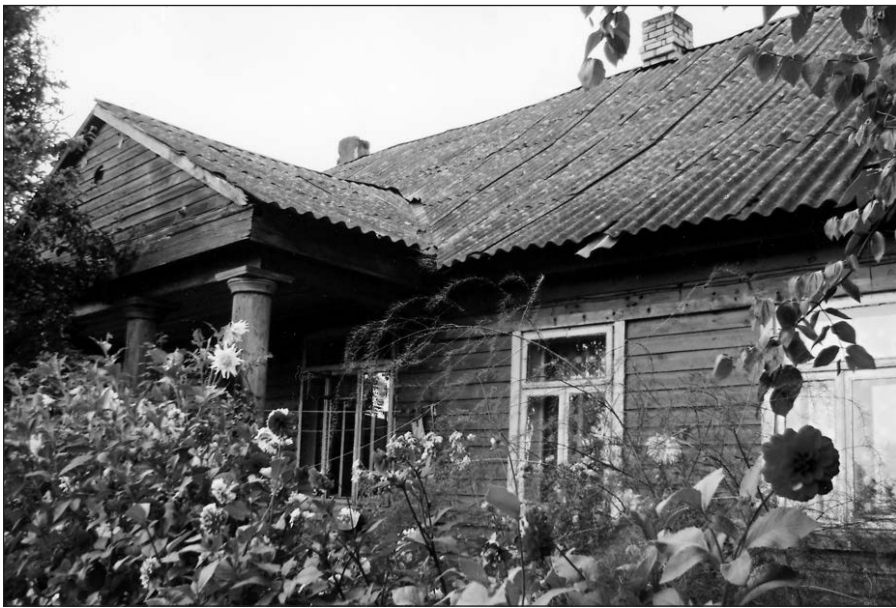
Jundeliškių dvarelio jurginai.