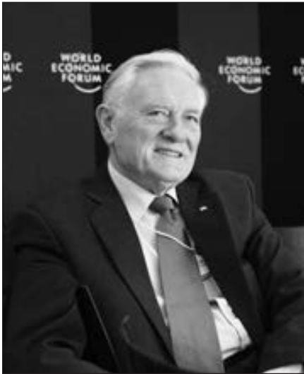
Pasaulio ekonomikos forume dalyvauja prezidentas Valdas Adamkus.