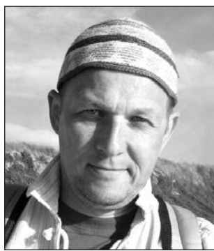
VYTAUTAS V. LADSBERGIS