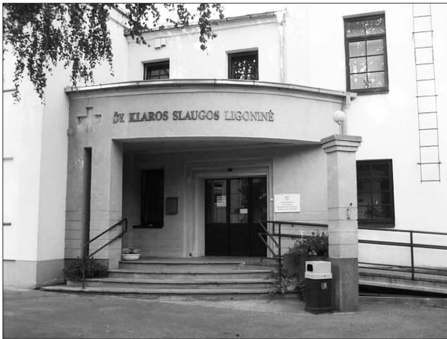
Utenos Šv. Klaros palaikomojo gydymo ir slaugos ligoninė.