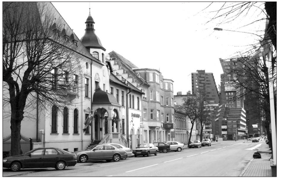
Buvę Klaipėdos krašto gubernatoriaus rūmai Klaipėdoje (nuotraukoje kairėje) tebestovi ir šiandien (nuotrauka dešinėje). Dabar tai DnB Nord Klaipėdos būstinė. Yra išlikęs autentiškas interjeras ir ypač nuostabūs laiptai.