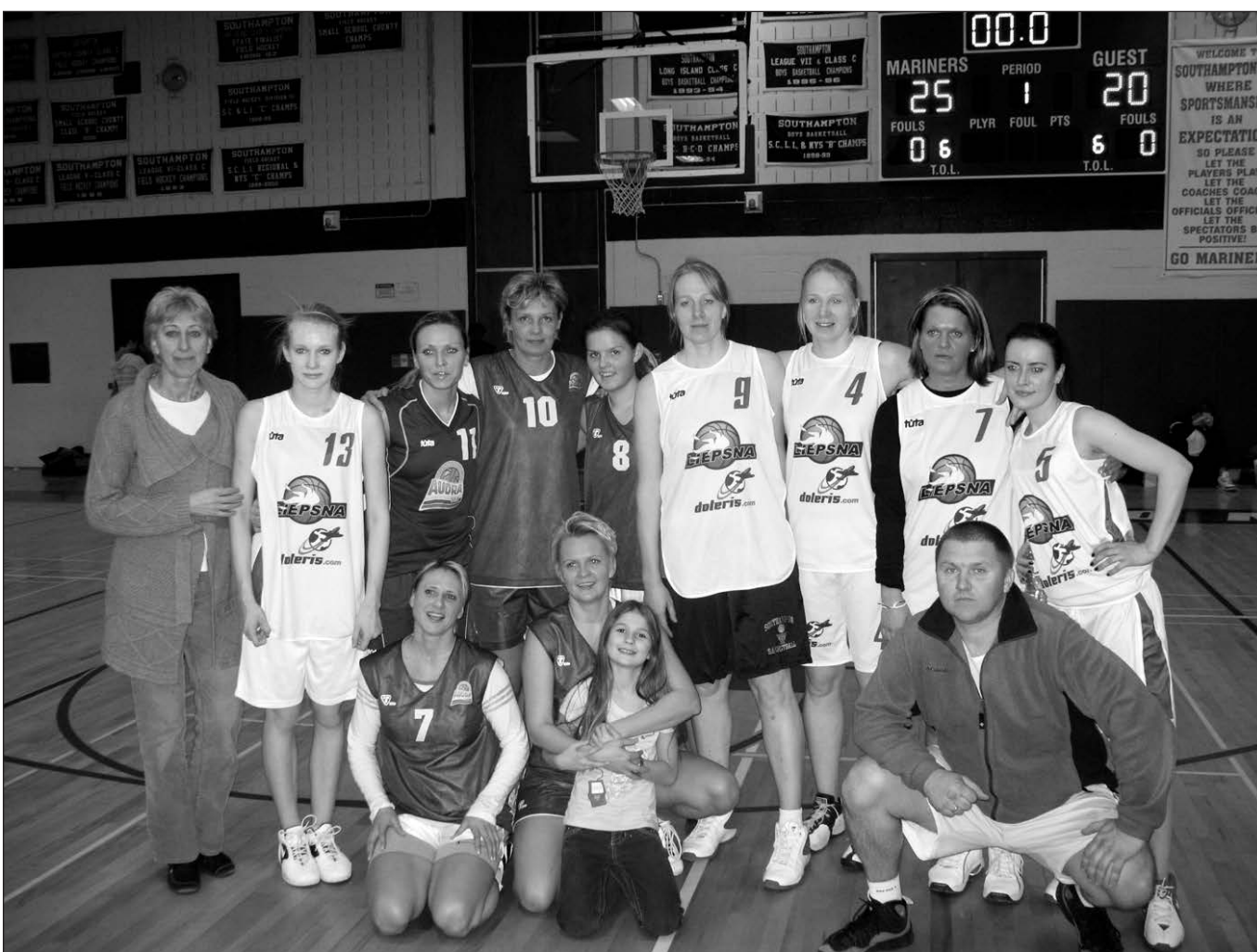
CT „Audros“ ir jungtinės NJ/NY moterų komandos po parodomųjų varžybų (laimėjo tamsesniais marškinėliais vilkinčios Naujosios Anglijos merginos).