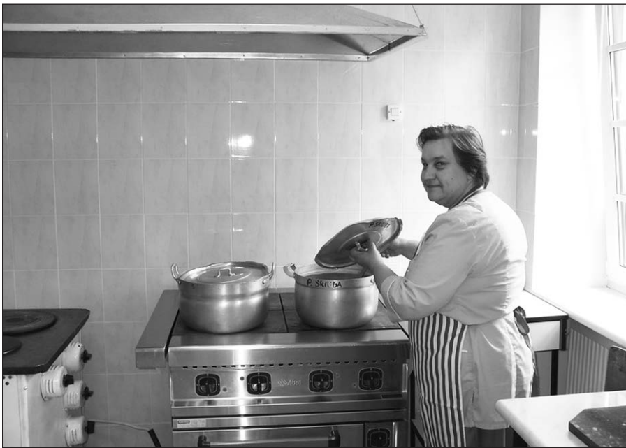
2008 metais atliktas virtuvės patalpų remontas.