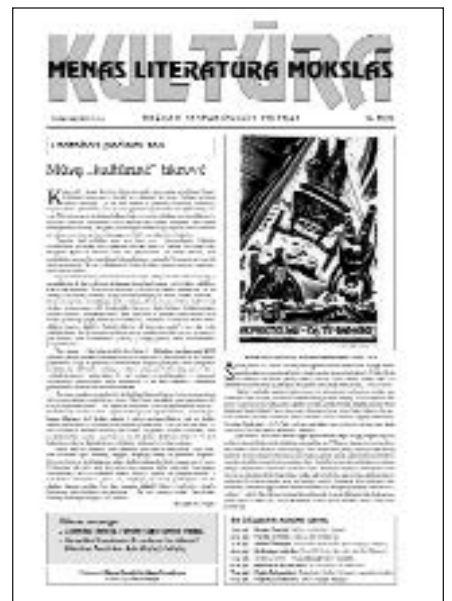
Šeštadienį — priedas Kultūra.