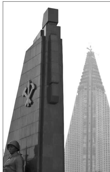
„Ryugyong“ viešbutis Šiaurės Korėjoje.

Manyto būsiant didingiausias „Ryugyong“ viešbučio Pchenjane, Šiaurės Korėjoje, konstrukcijos siekia 300 metrų. Jis turėjo turėti 105 aukštus ir net 4 aplink savo ašį besisukančius restoranus. Tačiau 1992 m. Šiaurės Korėją užgriuvus kitiems nemalonumams statybos darbai buvo atidėti, o viešbutis nesulaukė žadėtosios šlovės. Dabar Pchenjane galima išvysti piramidinį viešbučio karkasą, tačiau jam trūksta langų ir visa pastato armatūra laikoma nesaugia.