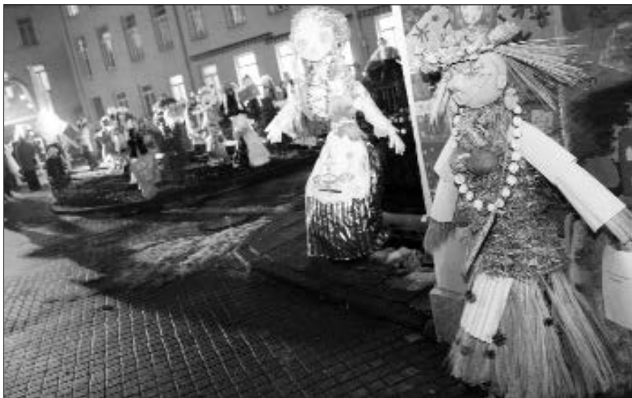
Vilnius , sausio 28 d. (ELTA) – Vilniaus mokytojų namų kiemelyje atidaryta mažųjų vilniečių sukurtų Morių paroda „Užgavėnių Morė“. Vilniaus mokytojų namai kartu su miesto savivaldybės Švietimo skyriumi pirmą kartą pristato proginę lėlių parodą. Joje dalyvauja apie 50 Vilniaus ikimokyklinių įstaigų.