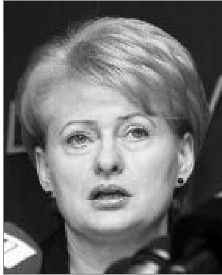
Dalia Grybauskaitė: „Lietuva vis dar yra ant nemokumo ribos.“