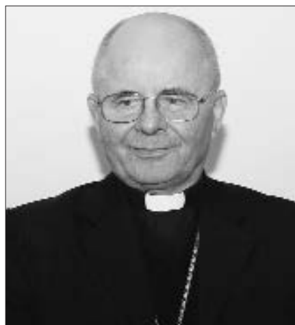
Kauno arkivyskupas S. Tamkevičius pažymėjo, kad Bažnyčia gali padėti keisti žmonių elgesį.

Kauno arkivyskupas S. Tamkevičius susisiekimo ministrui sakė,