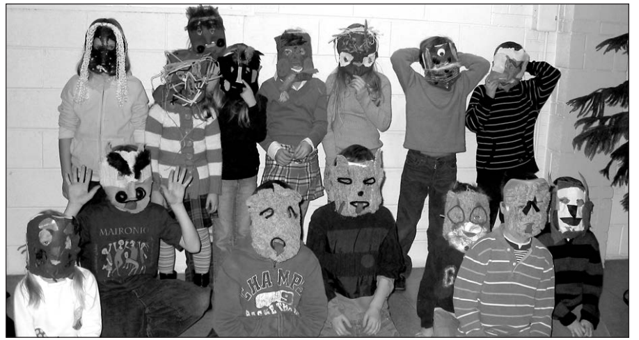
Užgavėnės Balzeko muziejuje. 2008 m.