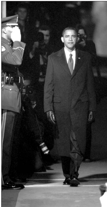
JAV prezidentas Barack Obama.

pradžią B. Obama išgyveno keletą jaudinančių akimirkų skaitydamas asmeninį laišką, kurį jam paliko G. W. Bush, perdavęs šalies vairą naujam prezidentui.