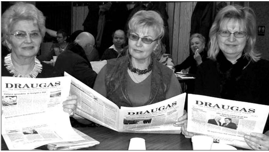
Sausio 18 d. Cicero lietuvių susibūrimo lankytojai domėjosi dienraščiu „Draugas“.