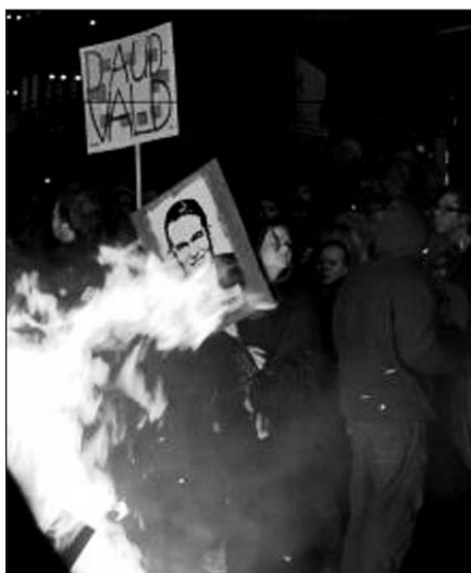
Protestai Islandijoje.

Protestai prieš vyriausybės ir centrinio banko politiką Reikjavike