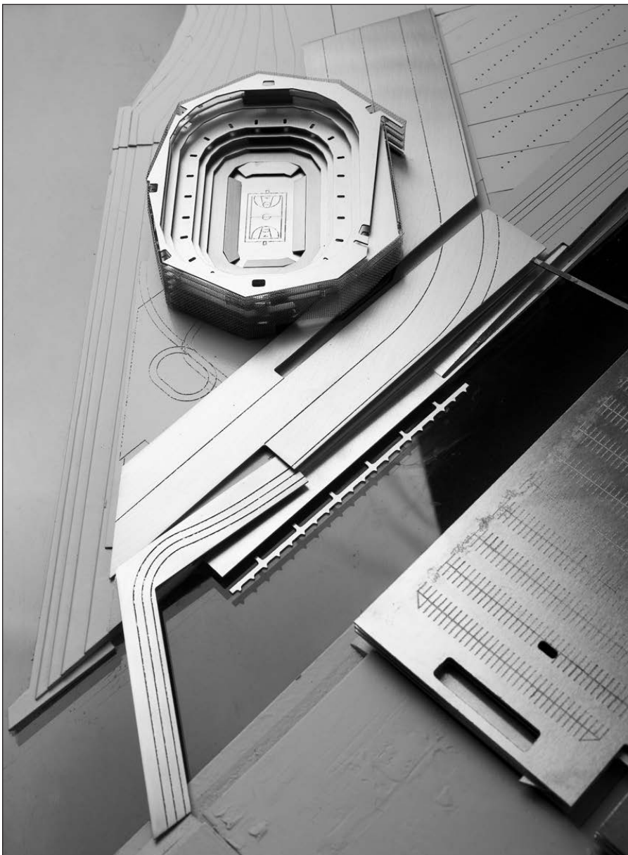
Taip atrodys naujieji Kauno pramogų ir sporto rūmai.

– Ačiū už pokalbį ir sėkmės įgyvendinant šį „amžiaus“ projektą!