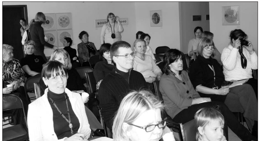
Paskaita Čikagos lituanistinės mokyklos mokytojams sukėlė daug diskusijų.

Knygą galima užsisakyti internetu: www.knygininkas.lt