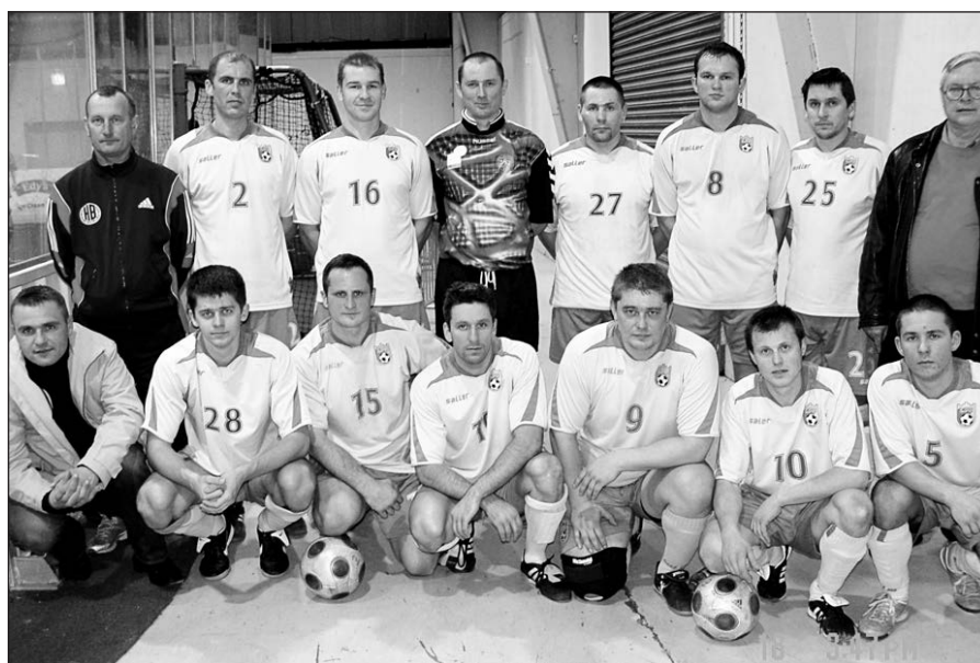
„Lituanicos“ („Liths“) komanda – žaidėjai ir vadovai po praėjusio sekmadienio rungtynių salės futbolo turnyre.

Užsiminus apie „major“ diviziją, reikia pažymėti, jog joje po trijų ratų su 9 taškais pirmąja dvi komandos: „Sockets“ ir „Schwaben“. Paskutinės dvi vietas be pergalių užima dvi serbų komandos: „Belgrade“ ir „United Serbs“.