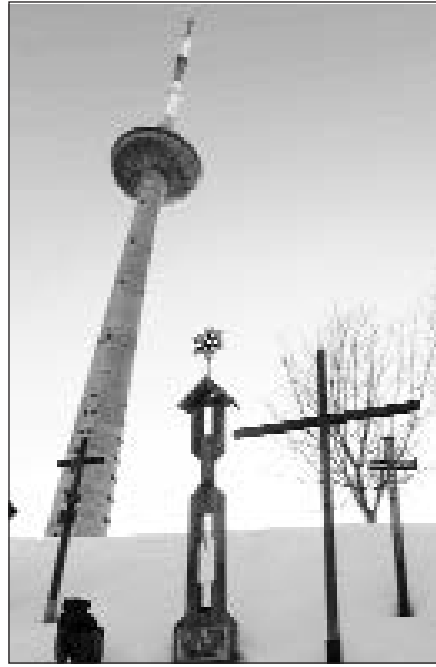
Ne vienas kalbėjęs iš Seimo tribūnos teigė, kad dvasiniai dalykai šiandien ne mažiau svarbūs nei ekonomika.