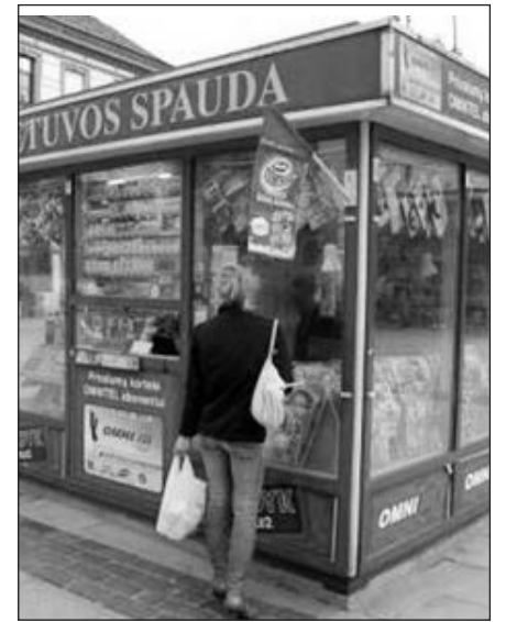
Lietuvos spaudos kioskas.