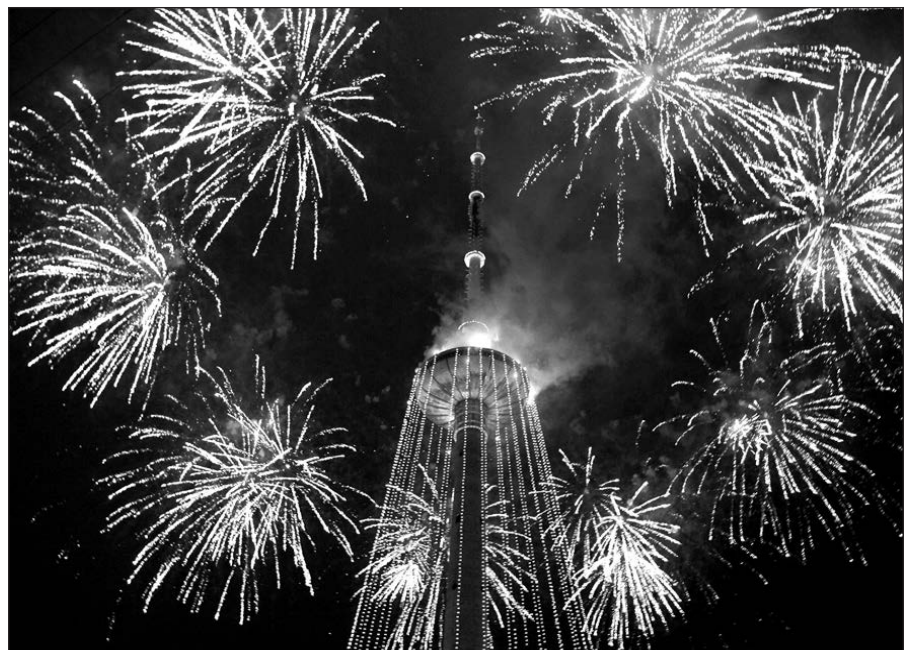
Įžiebta Televizijos bokštą karūnavo ugnies salvės.

Pirmą kartą Kalėdų eglė Vilniaus televizijos bokštas virto 2000 metais.