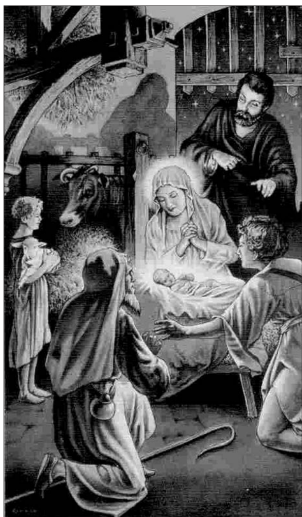
Prakartėlė Betliejuje – Kristaus kūdikėlio gimimo vieta.