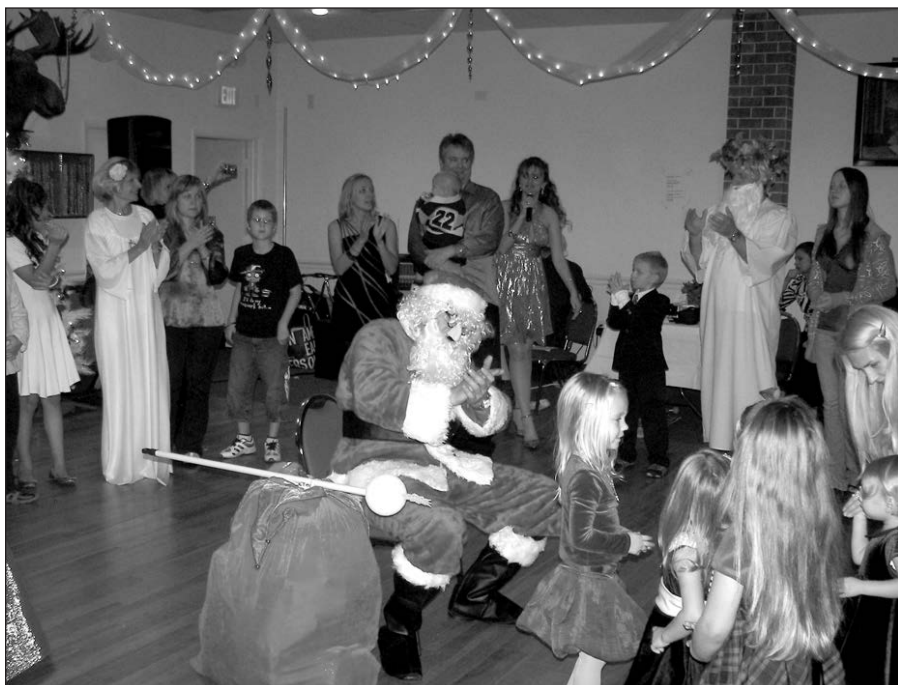
Nors Kalėdų senelis Floridoje gerokai aptirpo, didžiulis dovanų maišas nuo to visai nenukentėjo.

Pernakvoję pas draugus, namo grįžome tik vėlų sekmadienio vakarą. Ir tik pasirodžius Fort Myers žiburiams, prisiminiau, kad pasiimtos iš namų pagalpės taip ir neprireikė.