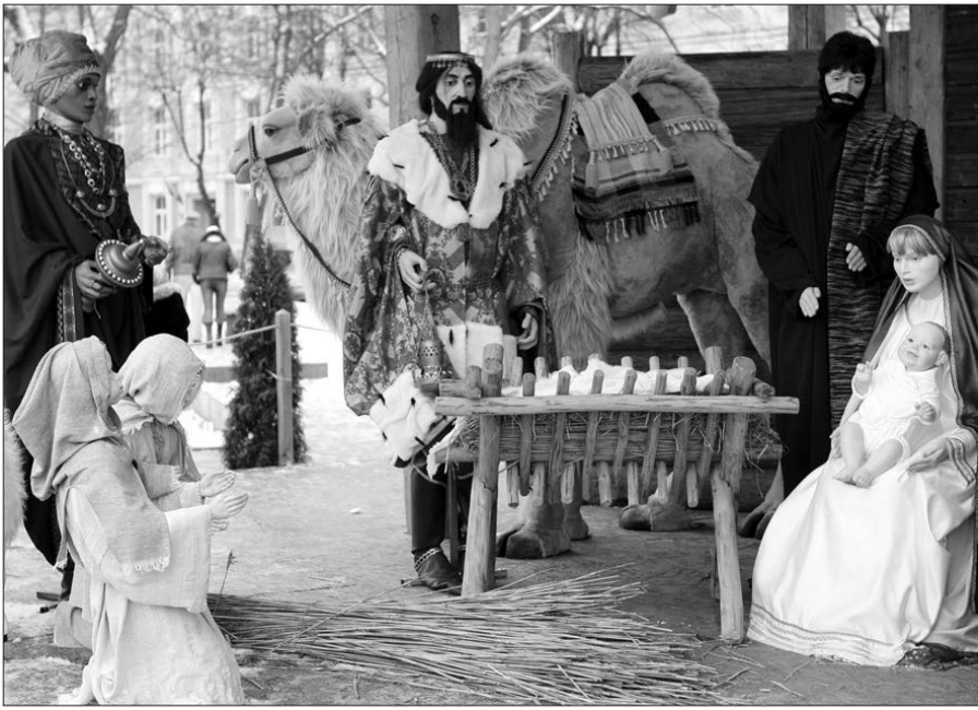
Didžioji prakartėlė sostinės Katedros aikštėje.