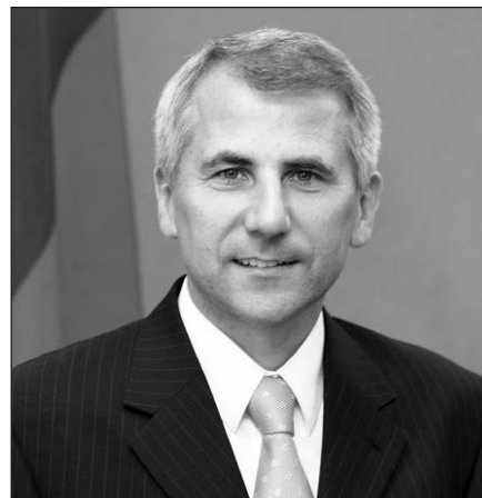
Užsienio reikalų ministras Vygaudas Ušackas.

NEWSPAPER - DO NOT DELAY - Date Mailed 12-26-08