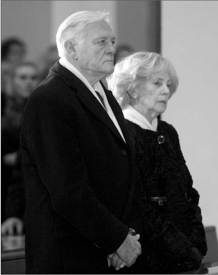
Prezidentas Valdas Adamkus ir Alma Adamkienė Piemenėlių Mišiose Vilniaus arkikatedroje.

Vilnius , gruodžio 24 d. (ELTA) – Prezidentas Valdas Adamkus už palaikymą sunkiu šaliai metu Gruzijoje išrinktas Metų žmogumi. Antroje vietoje liko Lenkijos Prezidentas Aleksander Kaczynski.