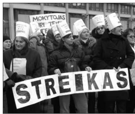
Alfa. It nuotrauka

Vilnius, gruodžio 22 d. (BNS) – Prie Prezidentūros Vilniuje pirmadienio vidurdienį prieš algų mažinimą protestuoja policininkai ir ugniagesiai, o Vilniaus universiteto (VU) ir Lietuvos kūno kultūros akademijos (LKKA) dėstytojai šalia vyriausybės rūmų iškėlė piketo plakatus.