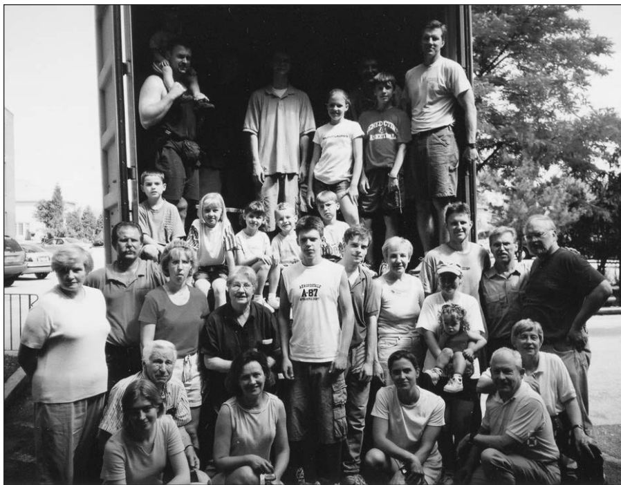
Talka kraunant „Saulutės” siuntinius į talpintuvą.