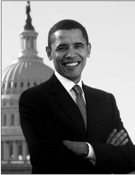
Barack Obama

Washington, DC, gruodžio 22 d. („Interfax“–BNS) – Amerikos savaitraštis „Newsweek“ pripažino Barack Obama įtakingiausiu žmogumi pasaulyje.