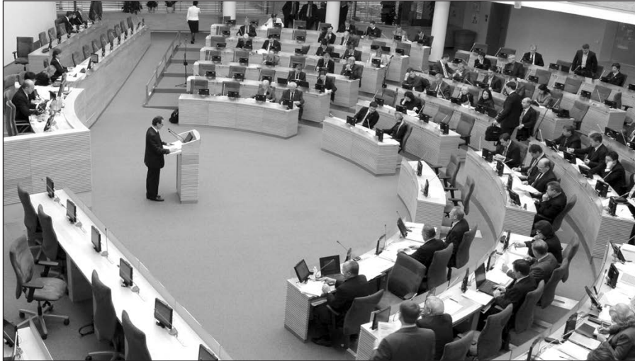
Seimas priėmė 2009 m biudžetą.