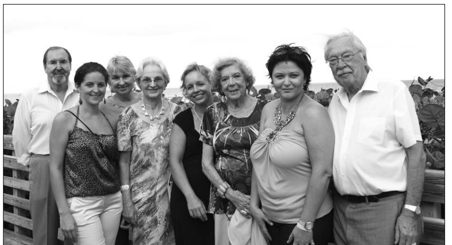
Šventės organizatoriai ir garbės svečiai.

Įdienojus visi smagiai leido laiką paplūdimyje – vieni, susibūrę į grupes, palaikė žaidėjus, kiti mėgavosi saule, o vaikučiai smagiai statė smėlio pilis ir pliuškenosi vandenyne. Varžybų aistroms nurimus, visi norintys buvo pakviesti žaisti estafetinių porų žaidimų, kuriuos suorganizavo ir