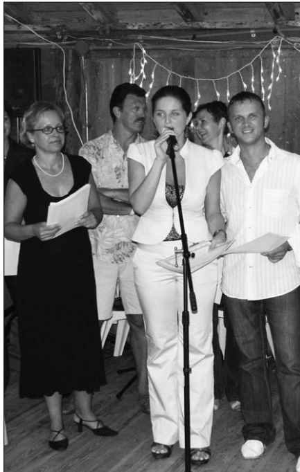
Įteikiami padėkos raštai.