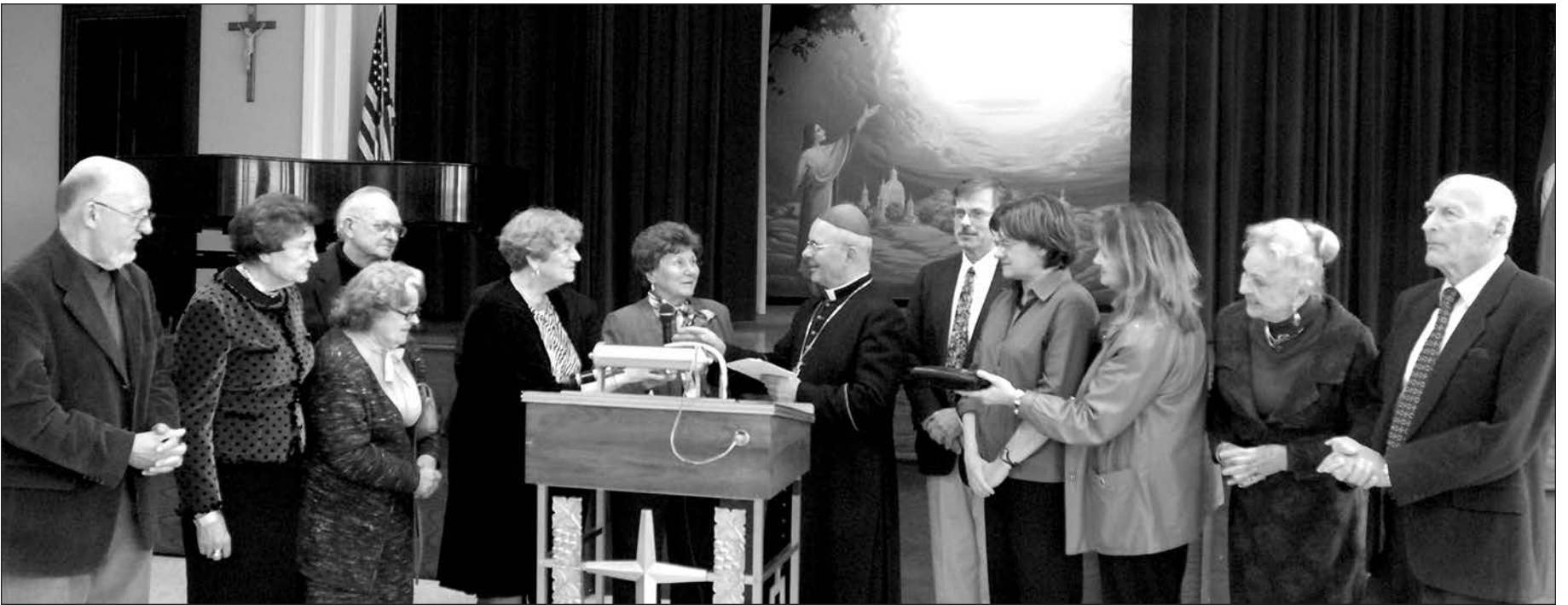
Susirinkime dalyvavo Cicero Šv. Antano parapijos nariai, kurie arkivysk. S. Tamkevičiui įteikė 1,000 dol.