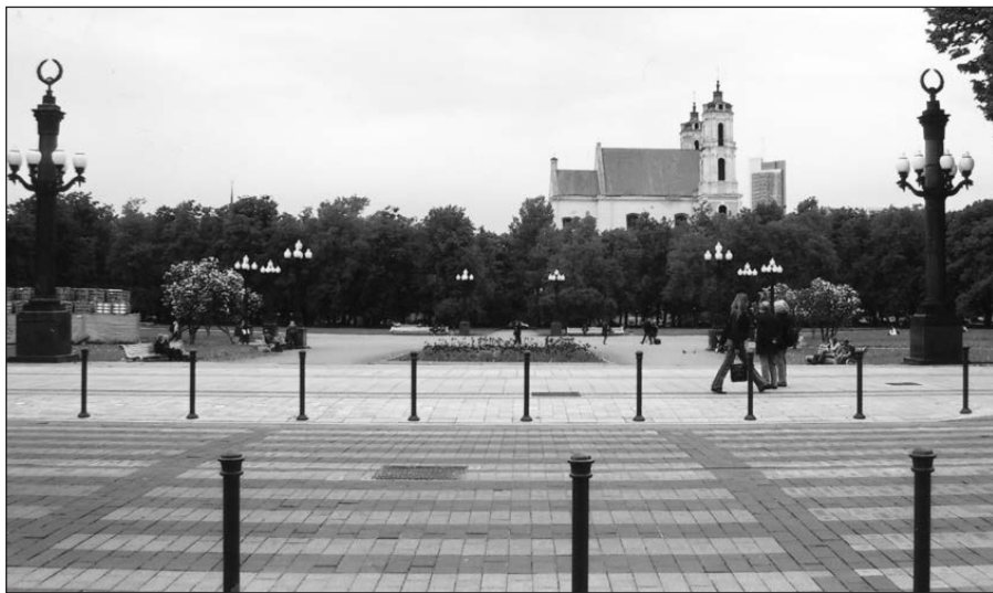
Vilnius. Lukiškių aikštė.