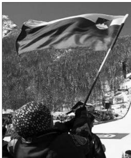
Plevėsuoja Slovėnijos vėliava.

Slovėnijoje, kuri yra vienintelė dabar ES priklausanti buvusios Jugoslavijos respublika, šie rinkimai vyko tokiu metu, kai premjerui J. Janša metami kaltinimai korupcija, o kairiųjų opozicija rodė vienybę ir siekė atgauti valdžią.