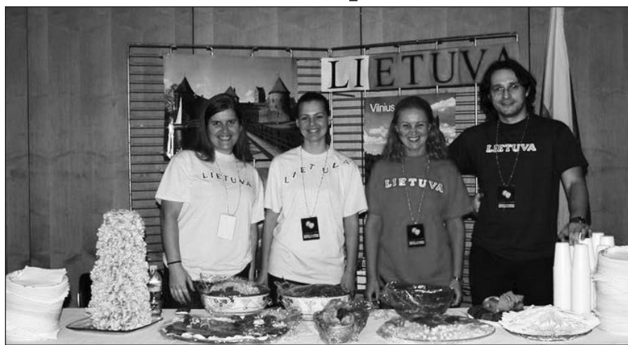
Lietuvos stendas susilaukė nemažo susidomėjimo.