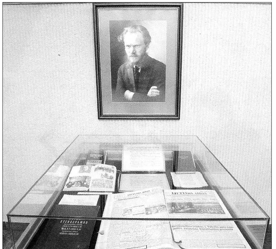
Nuotrauka iš „Lithuanian Parliamentary Mirror“, vaizduojanti Seime surengtą parodą apie Lietuvos žymų valstybininką Stasį Šilingą.

Abu šie žurnalai yra gera medžiaga tiems, kurie dabar domisi ar ateityje rinks medžiagą apie Lietuvos Seimo darbą. Bibliotekų saugyklose „Lithuanian Parliamentary Mirror“ turėtų išlikti ilgus metus ir liudyti kitakalbams apie Lietuvos Seimo veiklą.