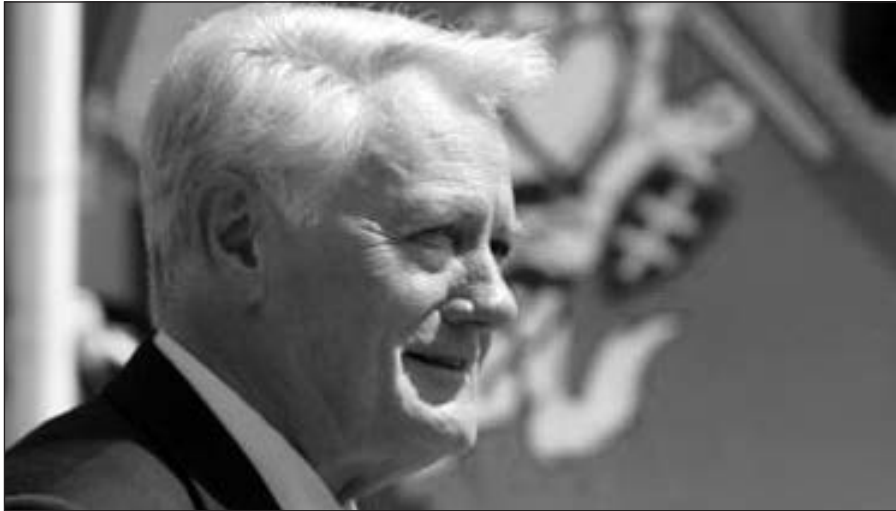
Prezidentas V. Adamkus sakys kalbą Jungtinių Tautų Generalinės Asamblėjos debatuose.

Vilnius , rugsėjo 22 d. (BNS/Alfa.lt) – Prezidentas Valdas Adamkus atvyko į Jungtines Amerikos Valstijas dalyvauti Jungtinių Tautų (JT) Generalinės Asamblėjos debatuose. Čia jis sakys kalbą apie naujus iššūkius tarptautinei bendruomenei ir Euro-