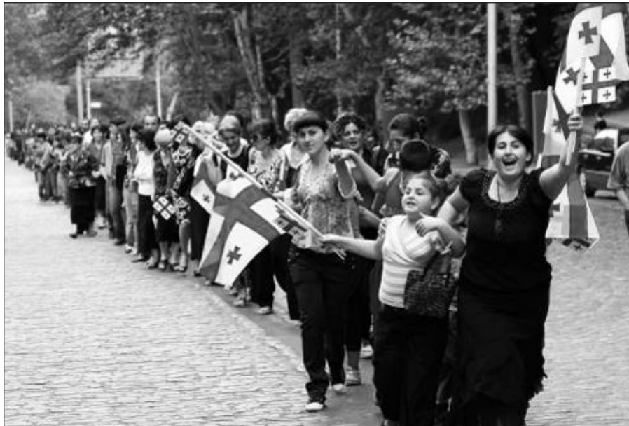
Protesto eitynės Tbilisyje.