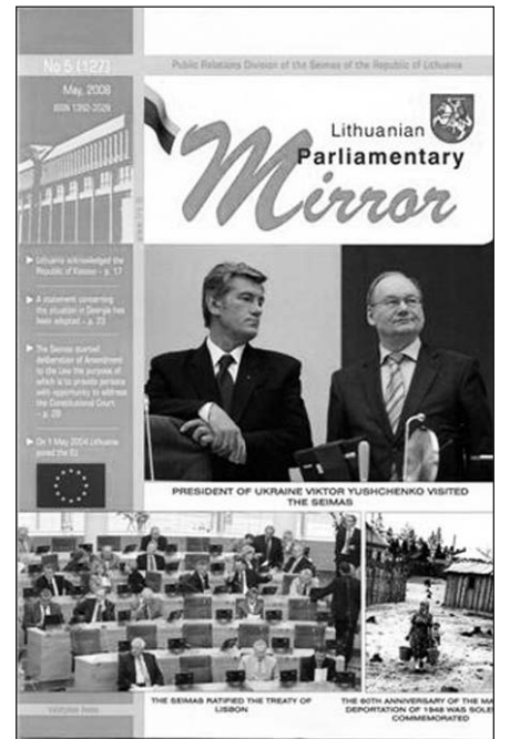
Žurnalo „Lithuanian Parliamentary Mirror“ paskutinio numerio viršelis.

Beje, ta pati Seimo spaudos leidybinių grupė nuo 1997 m. leidžia ir iliustruotą žurnalą „Seimo kronika“ lietuvių kalba. Jis iš biuletenio dabar tapo stamboku iliustruotu savaitiniu leidiniu. Šis žurnalas iki šiol daugiausiai buvo platinamas tarp politikų Lietuvoje bei užsienyje. Dabar Seimo