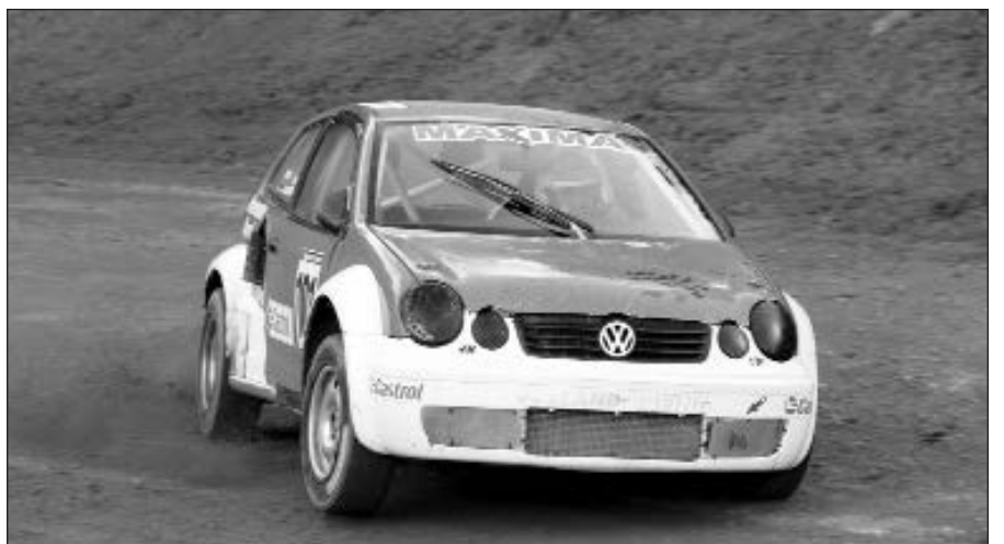
N. Naujokaičio vairuojamas automobilis.