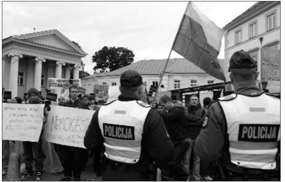
Protesto renginio dalyviai.