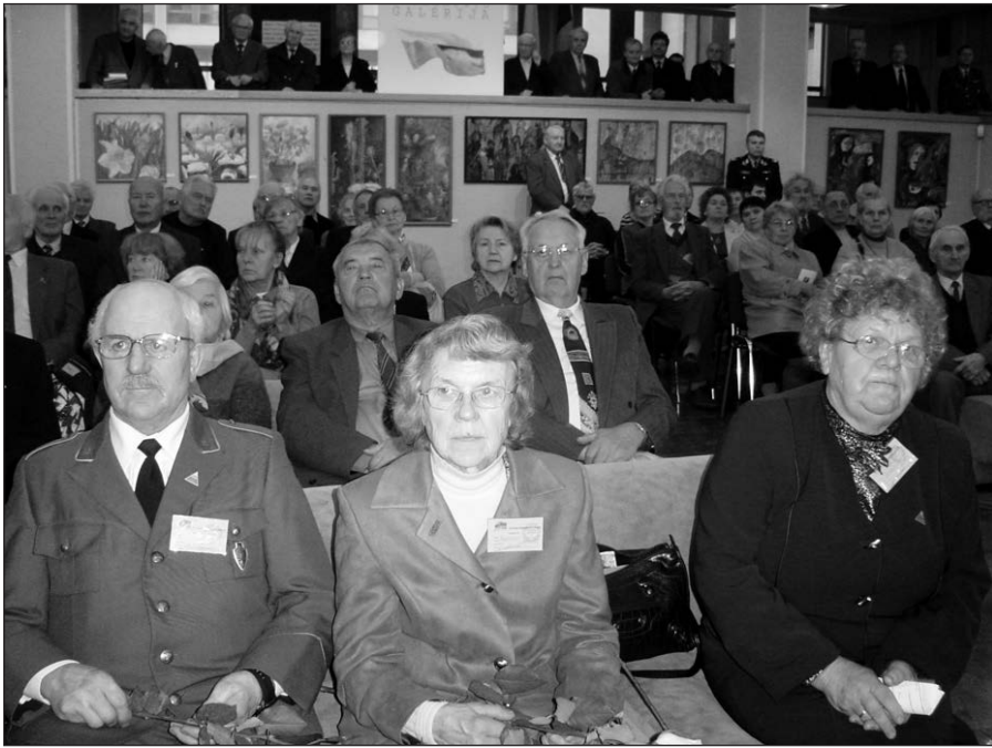
Vlodo Montvydo-Žemaitčio prisiminimų popietės dalyviai.