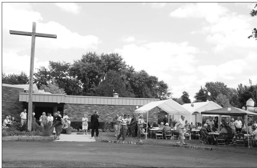
Smagu susitikti gegužinėje.