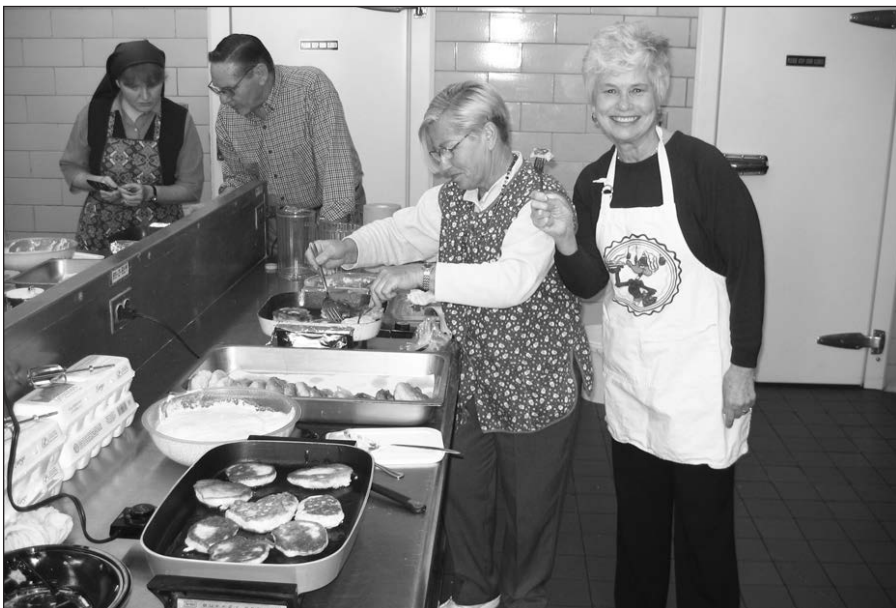
Savanorės moterys kepa Uzgavėnių blynus.