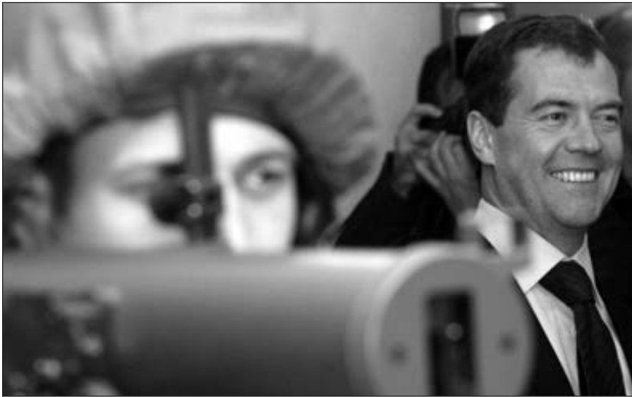
Rusijos prezidentas D. Medvedev.