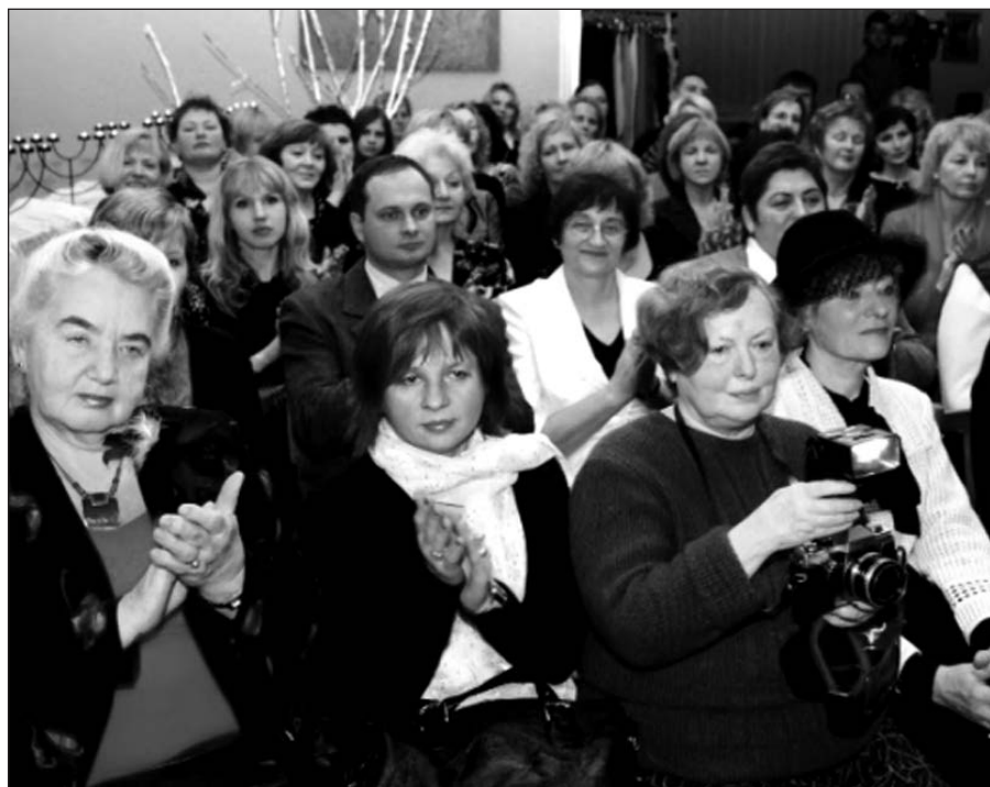
Ne viena Panevėžio politikė džiaugėsi, kad klubo veikloje dalyvaujančios moterys yra išsilavinusios, veiklios, draugiškos, nepaisant to, kad jos priklauso skirtingoms politinėms partijoms.

Galima spėti, jog burtis moteris skatina gilus gyvenimo prasmės suvokimas ir galimybė patikrinti vertybes, kuriomis grindžiamas ar turėtų būti grindžiamas žmogiškas bendravimas, o drauge – ir mūsų valstybės pamatai bei pažanga.