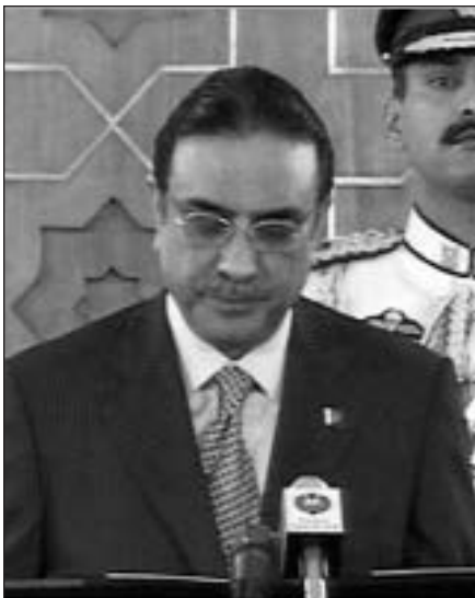
Asif Ali Zardari.

Vilnius , rugsėjo 9 d. (Balsas.lt) – Asif Ali Zardari prisaikdintas 14-uoju Pakistano prezidentu. Jis pakeitė šiose pareigose Pervez Musharraf, kuris atsistatydino vengdamas apkaltos. A. A. Zardari didele persvara laimėjo šeštadienį vykusius rinkimus.