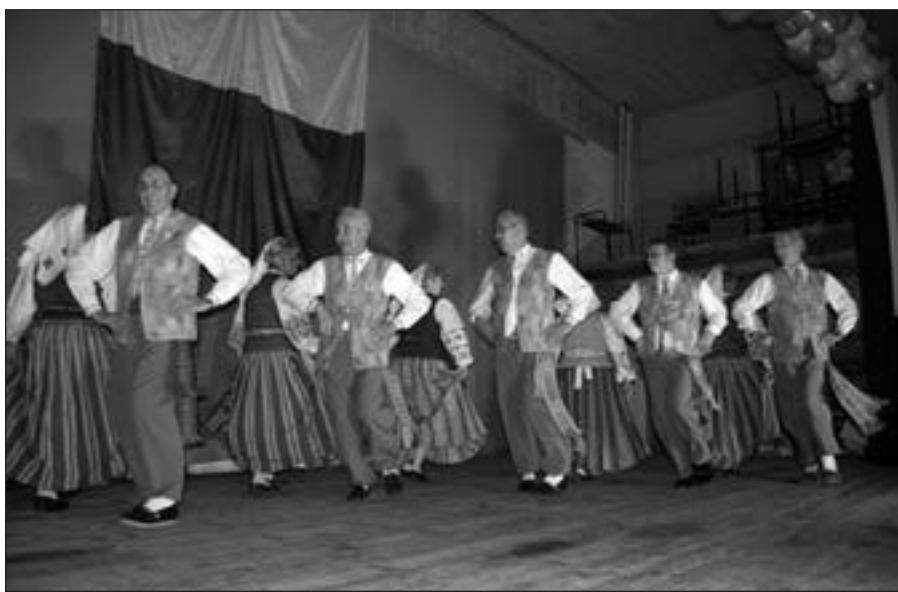
Šokių grupė „Pipiras“.