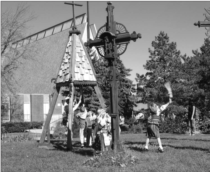
Lietuanistinės mokyklos mokinukai prie Pasaulio lietuvių centro.