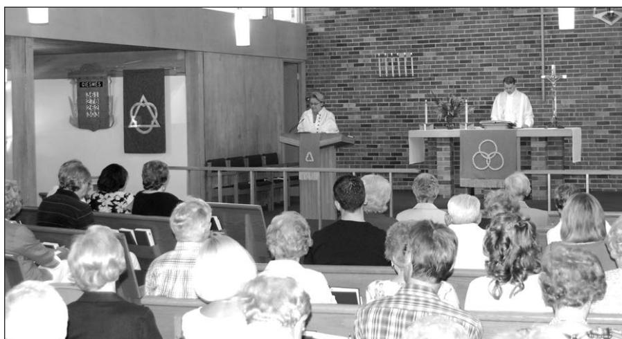
Gegužinė prasidėjo pamaldomis.