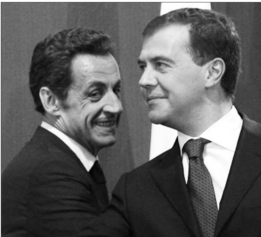
Prancūzijos prezidentas Nicolas Sarkozy ir Rusijos vadovas Dmitrij Medvedev.