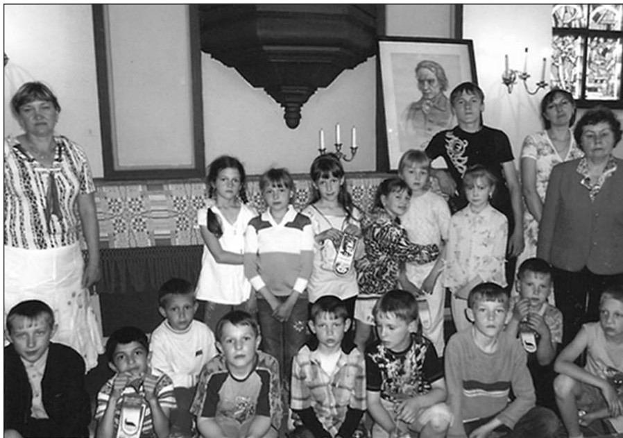
Kraupiškio (Uljanovo) lietuviukai K. Donelaičio muziejuje Tolminkiemyje.