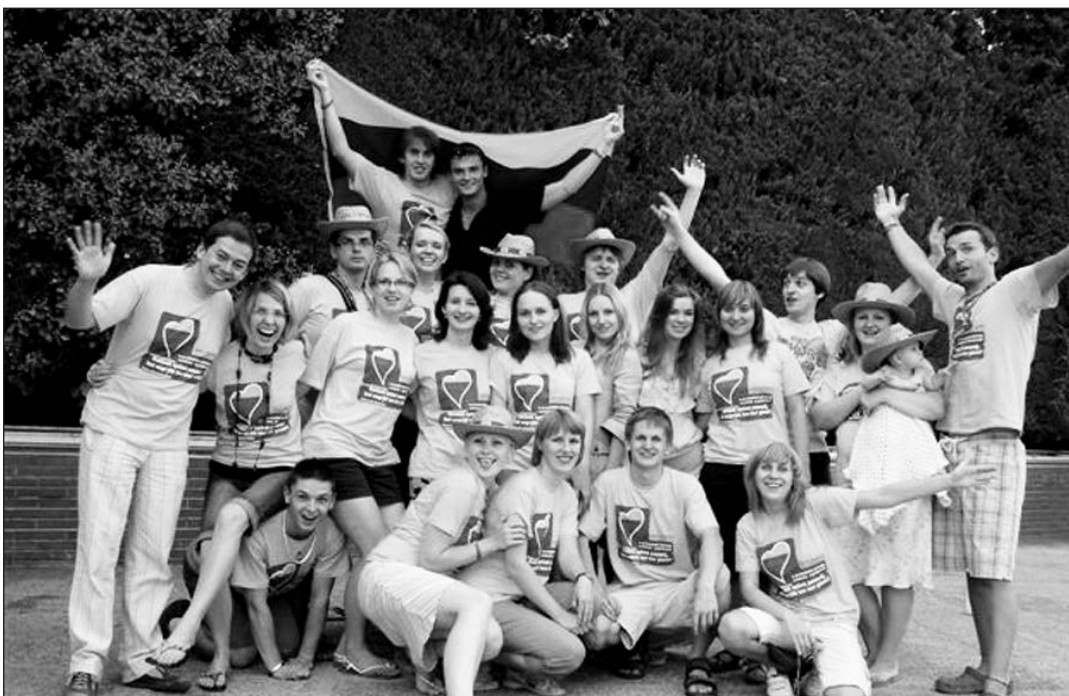
2007 m. suvažiavimo dalyviai.

Prieš pat Pasaulio Lietuvių Bendruomenės (PLB) ir Pasaulio Lietuvių jaunimo sąjungos kraštų pirmininkų suvažiavimą, rugpjūčio 8–9 dienomis sodyboje netoli Utenos į trečiąjį suvažiavimą rinksis Europos lietuviškas jaunimas.