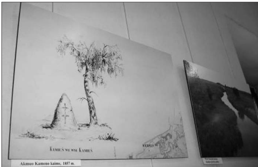
Akmuo Kameno kaime 1857 metais.

Lietuvos UNESCO komisijos salėje eksponuojama fotografijų paroda „Neris ir jos krantai. Konstantino Tiškevičiaus keliais po 150 metų” ne tik fiksuoja dabartines Neris pakrantes ir čia gyvenančius žmones bei jų buitį, bet ir prikelia istorinį – senosios Vilijos – prisiminimą, atgaivina stebuklingą, beveik nepakitusį nuo Konstantino Tiškevičiaus laikų keliautojų atradimo džiaugsmą.