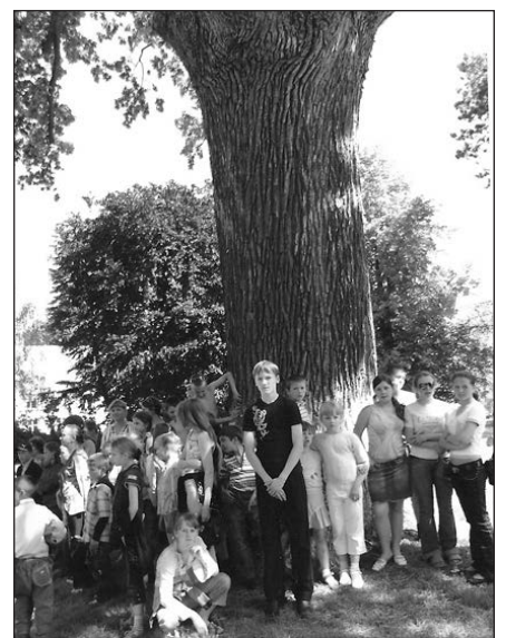
Kraupiškio (Uljanovo) lietuviukai Trakėnų (Jasnaja Poliana) parke prie ažuolo.

Tikėjomės sutikti daugiau žmonių, atvykusių į talką-šventę, bet, deja, tą dieną daugiau niekas neatvyko, nors „Donelaičio žemės“ š. m. nr. 3