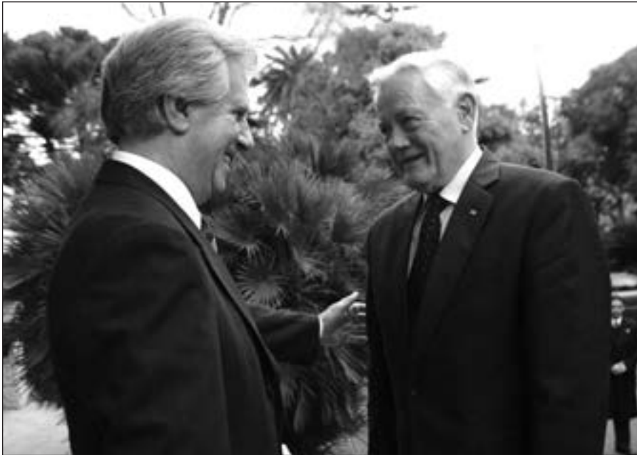
Lietuvos prezidentas Valdas Adamkus susitiko su Urugvajaus Rytų Respublikos prezidentu Tabare Ramon Vazquez Rosas.

Vilnius , liepos 22 d. (BNS) – Lietuvos ir Urugvajaus prezidentai Valdas Adamkus bei Tabare Vazquez bendrame pareiškime išreiškė norą plėsti dvišalius santykius ir tiesioginį dialogą tarp abiejų valstybių žmonių. Pareiškimą prezidentai pasirašė pirmadienį Urugvajaus sostinėje Montevideo.