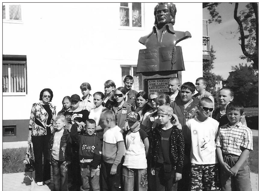
Lenkvičių (Lunino) pagrindinės mokyklos lietuviukai Gumbinėje (Guseve) prie K. Donelaičio paminklo.

poetą tęsinys: skaitėme K. Donelaičio patarimus mūsų laikų žmogui. Jie parašyti rusų, vokiečių ir lietuvių kalbomis. Tai: 1. Dirbk ir džiauksis. 2. Būk savimi. 3. Negirtuokliauk. 4. Mokykis iš gamtos. 5. Apribok savo norus.