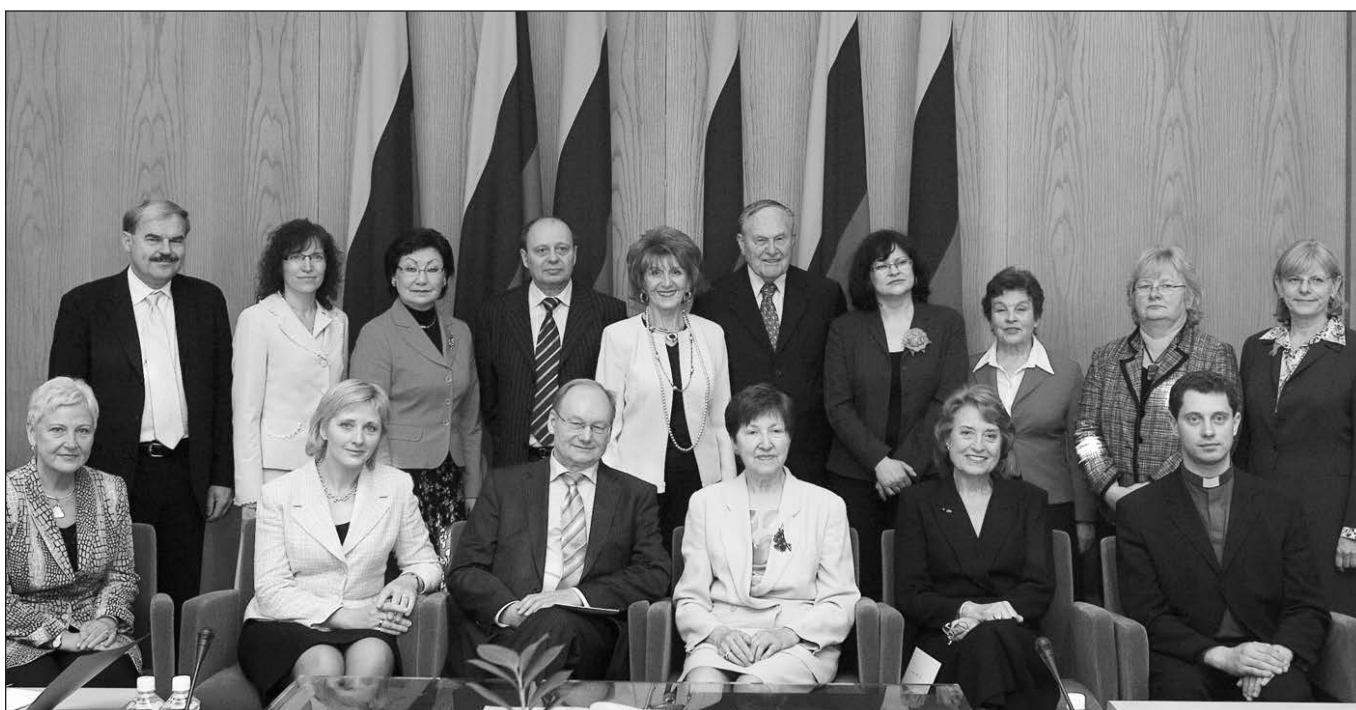
LR Seimo ir PLB Komisijos posėdžių dalyviai.

– Lietuvos televizijos transliavimo į užsienį klausimai, kaip „TV Lituania“ projekto vykdymas, lietuviškų programų sklaidos galimybės už Lietuvos ribų, Lietuvos nacionalinės televizijos atitikimas Lietuvos nacionalinio Nukelta į 11 psl.