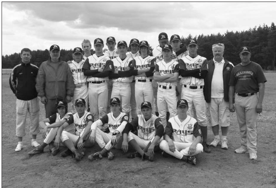
Į pasaulio pirmenybes Bangor, Maine valstijoje pasiruošusi važiuoti Lietuvos jaunuolių komanda su iš „Tampa Bay Rays“ profesionalų klubo gauta apranga.

Beje, jaunieji ir vyrai kamuoliukus mušinėjo per lietų, o pastarieji – dar ir medinėmis lazdomis.