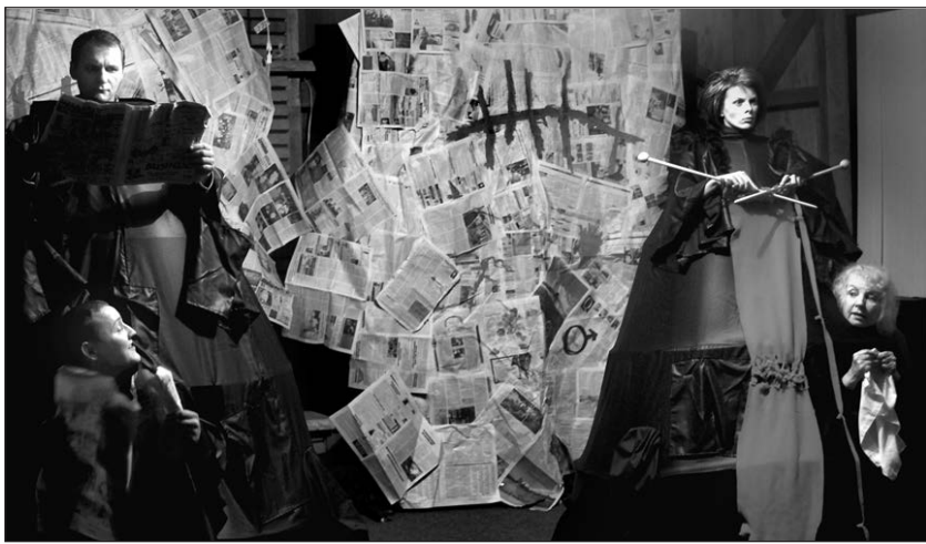
Teatro festivalyje dalyvaus „Žaltvykslės“ teatras iš Čikagos. Nuotraukoje: scena iš šio teatro pastatymo – Kosto Ostrausko „Gyveno kartą senelis ir senelė“.