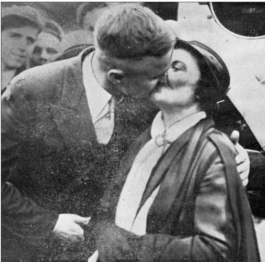
Steponas Darius atsisveikina su savo mama prieš skrydį.

Gaila, kad su Dariaus mirtimi Lietuva neteko ne tik drąsaus lakūno, bet ir puikaus sportininko ir sporto organizatoriaus, kuris dar galėjo daug padaryti ir sporto srityje.