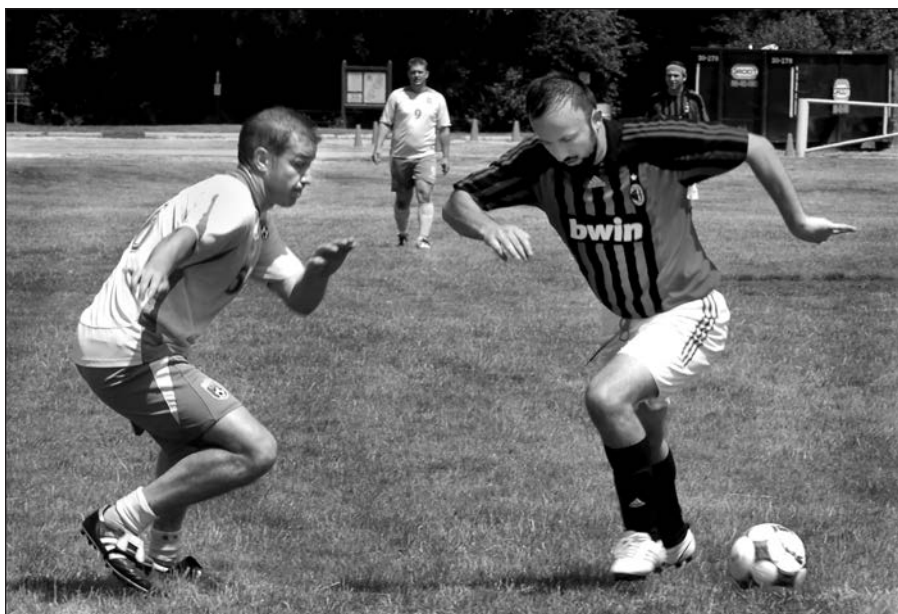
Akimirka iš futbolo rungtynių, vykusių „Lietuvių dienose“.

Po liepos 2 d. Rygoje vykusių Baltijos lygos ketvirtfinalio rungtynių tarp vietos „Skonto“ ir Vilniaus „Žalgirio“ (jas laimėjo rygiečiai 2:1) lietuviai sirgaliai sukėlė neramumus. Už stadiono ribų lietuviai sukėlė muštynes, po kurių policija sulaukė keliolika žmonių ir nuvežė į policijos būstinę. Ten policija surašė 12 administracinės teisės pažeidimų protokolų už chuliganizmą. Jau ne pirmas kartas, kada Lietuvos sirgaliai pasižymi savo blogu elgesiu Latvijoje. Gerokai didesnis lietuvių siautėjimas įvyko gegužės mėnesio pabaigoje.