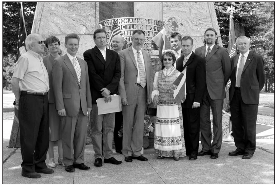
Prie Dariaus ir Girėno paminklo.