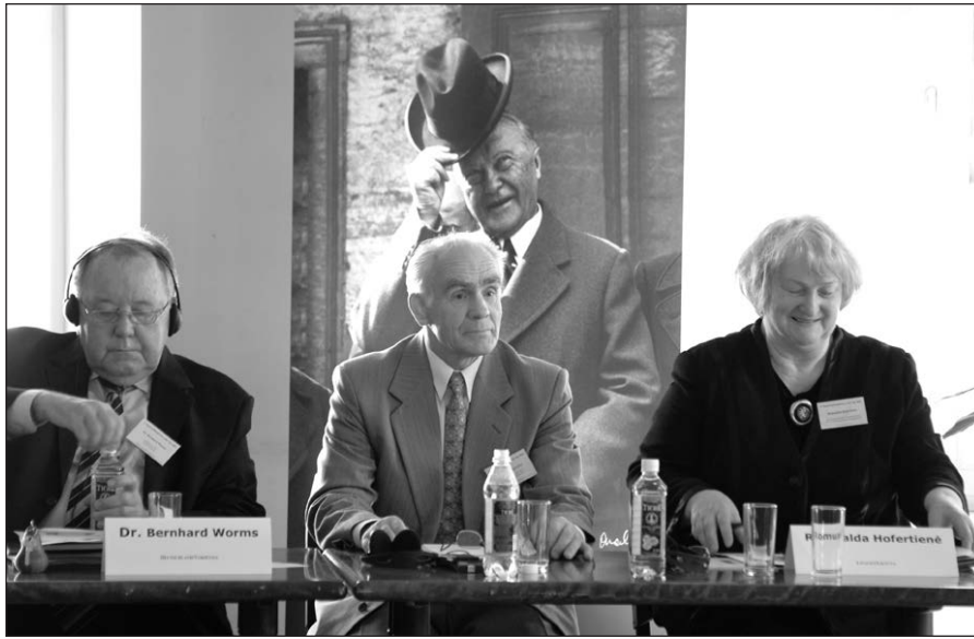
Prie vieno stalo spęstos užsienio ir Lietuvos senjorų problemos.