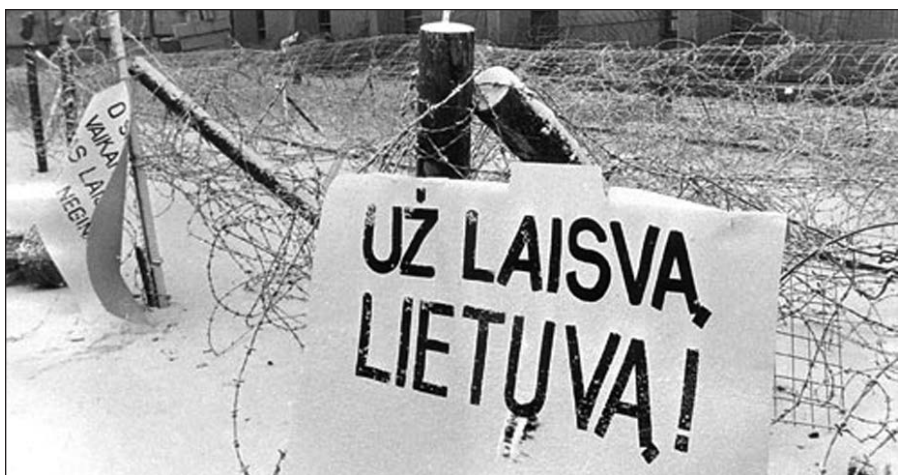
Barikados prie Aukščiausiosios Tarybos 1991 m.