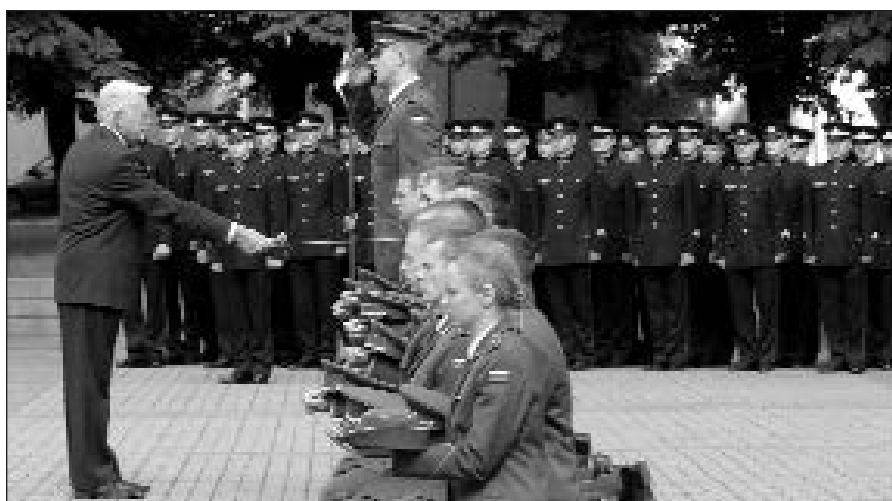
Prezidentas V. Adamkus pirmąjį karininko-leitenanto laipsnį suteikė 36 mokslus baigusiems Lietuvos karo akademijos kariūnams.

Vilnius , birželio 30 d. (ELTA) – Sostinės Daukanto aikštėje vyko pirmojo karininko laipsnio suteikimo Generolo Jono Žemaičio karo akademijos absolventams iškilmės. Jų metu prezidentas Valdas Adamkus jauniems Lietuvos karininkams linkėjo, kad tvirčiausių ir svarbiausių Lietuvos kariuomenės tradicijų tąsa