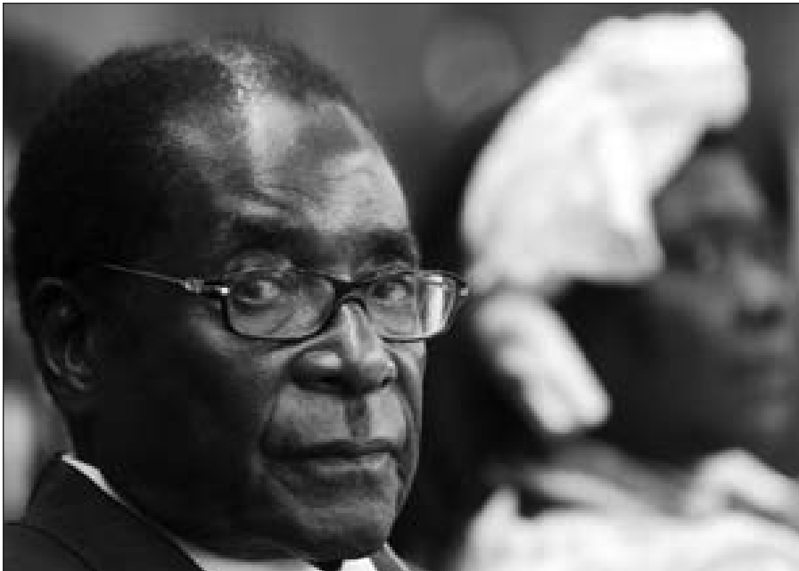
Zimbabvės prezidentas Robert Mugabe.