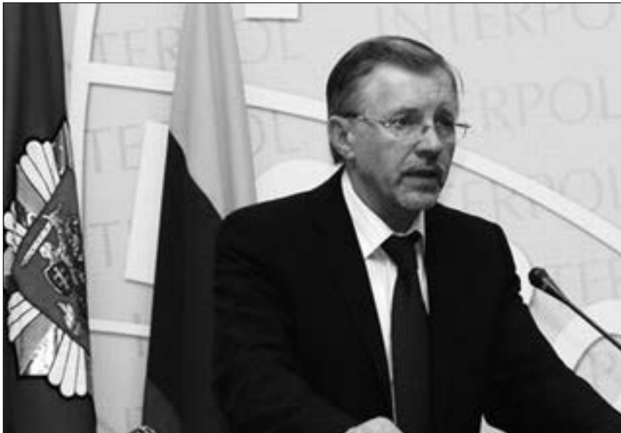
Lietuvos Respublikos ministro pirmininko G. Kirkilo nuomone, naujoji Pilietybės įstatymo redakcija sustiprins išeivijos ryšius su Lietuva.

New York , liepos 1 d. (ELTA) – Pirmąją apsilankymo Jungtinėse Amerikos Valstijose dieną New York ministro pirmininkas Gediminas Kirkilas kartu su Lietuvių Bendruomenės, Tautos fondo, kitų New York esančių lietuvių organizacijų nariais džiaugėsi nauja Pilietybės įstatymo redakcija, leidžiančia turėti dvigubą pilietybę, susitikime su žydų atstovais atsargiai žadėjo tiek lietuviams, tiek žydams priimtinius sprendimus dėl restitucijos ir teisinio įvertinimo. Premjero nuomone, naujoji Pi-