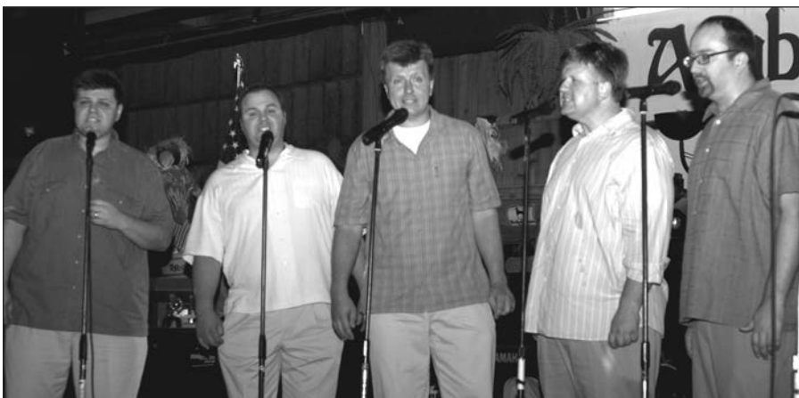
Dainuoja „Dainavos“ ansamblio vyrų vienetas.