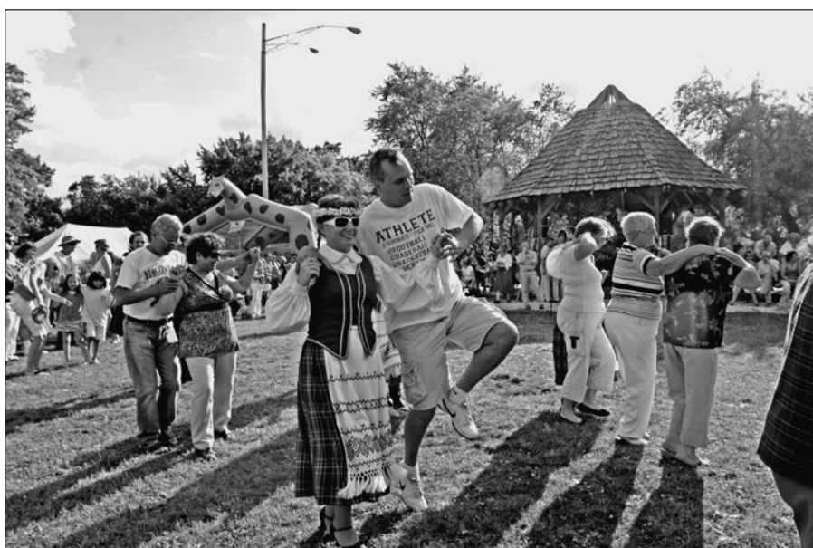
Visi šoka, kaip kas moka.