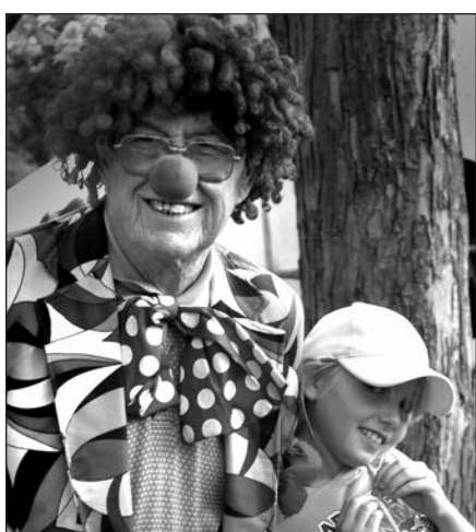
Kokia šventė be juokdario?