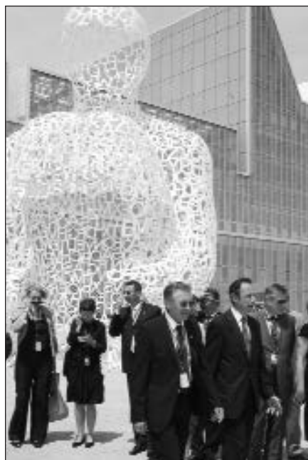
Lietuvos nacionalinę dieną iškilmingai pradėjo Ispanijoje viešintis ministras pirmininkas G. Kirkilas.

Saragosa , birželio 23 d. (ELTA) – Pasaulinėje parodoje „Expo 2008“ surengta Lietuvos nacionalinė diena.