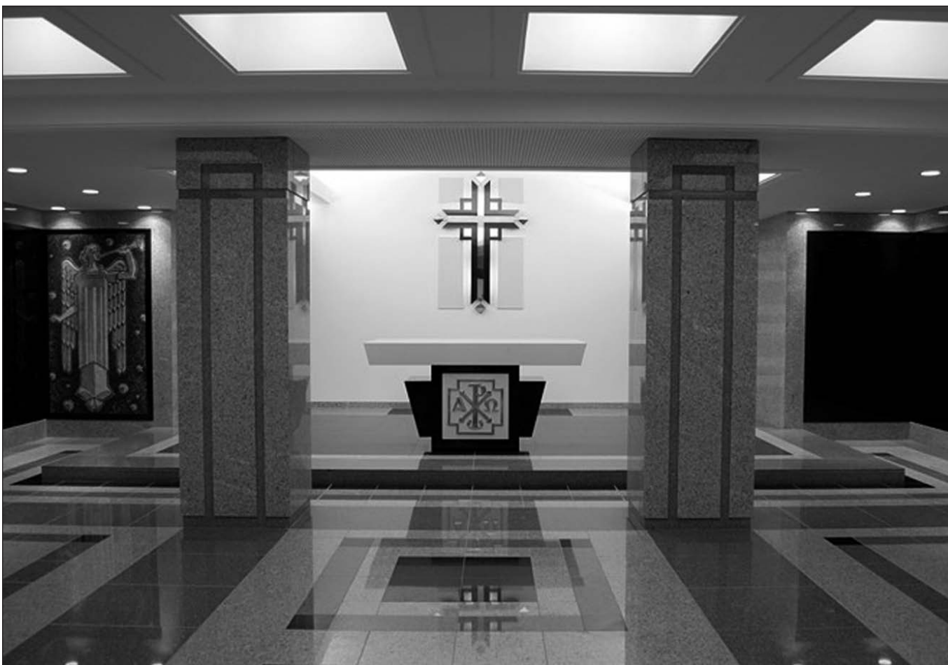
Prisikėlimo bažnyčios kolumbariumas.

– Be abejo. Turime labai senas tradicijas. Mūsų Valstybė buvo garsi savo tolerancija. Aš buvau net truputį nustebinta, kai sužinojau, kad Mykolas Radvila Juodasis su savo žmona – o jie buvo protestantai, jų tik vaikai grįžo į katalikybę – buvo palaidoti Vilniaus katedroje, ir tik vėliau, kuomet jau papūtė kiti vėjai, kai buvo nepalankiai žiūrima į kitatikius, giminės pasistengė iškelti juos iš Katedros į Dubingiuose įrengtą mauzoliejų. Bet tai jau buvo vėliau. Ir perlaidojimų tokių buvo daug, kaip tik dėl tų priežasčių, sakytumė, artimų mūsų politinėm situacijom, kintančiom pažiūrom. Radvilų sarkofagai atsidūrė Kėdainiuose. Vyžuonose – Radvilų mauzoliejus. Palikuonys labai rūpinosi savo tėvų ir protėvių palaikais, kad nebūtų išniekinti, kad nebūtų