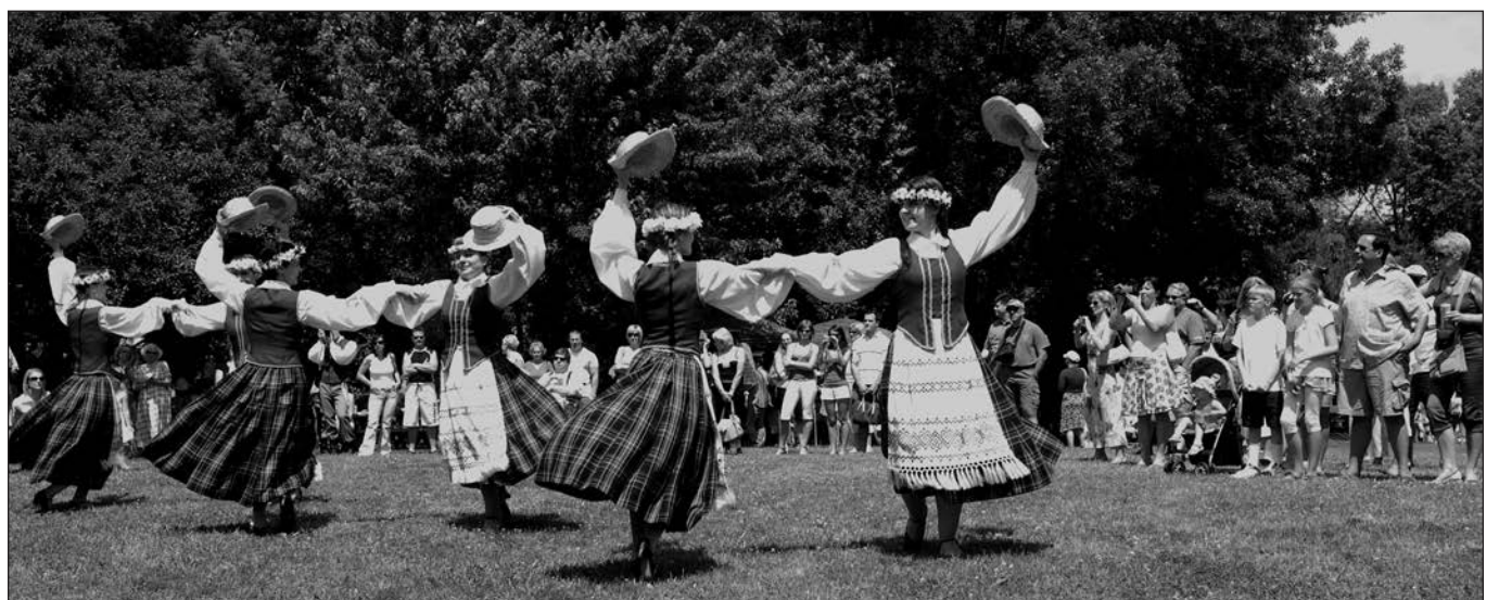
„Suktinis“ pasitinka svečius.