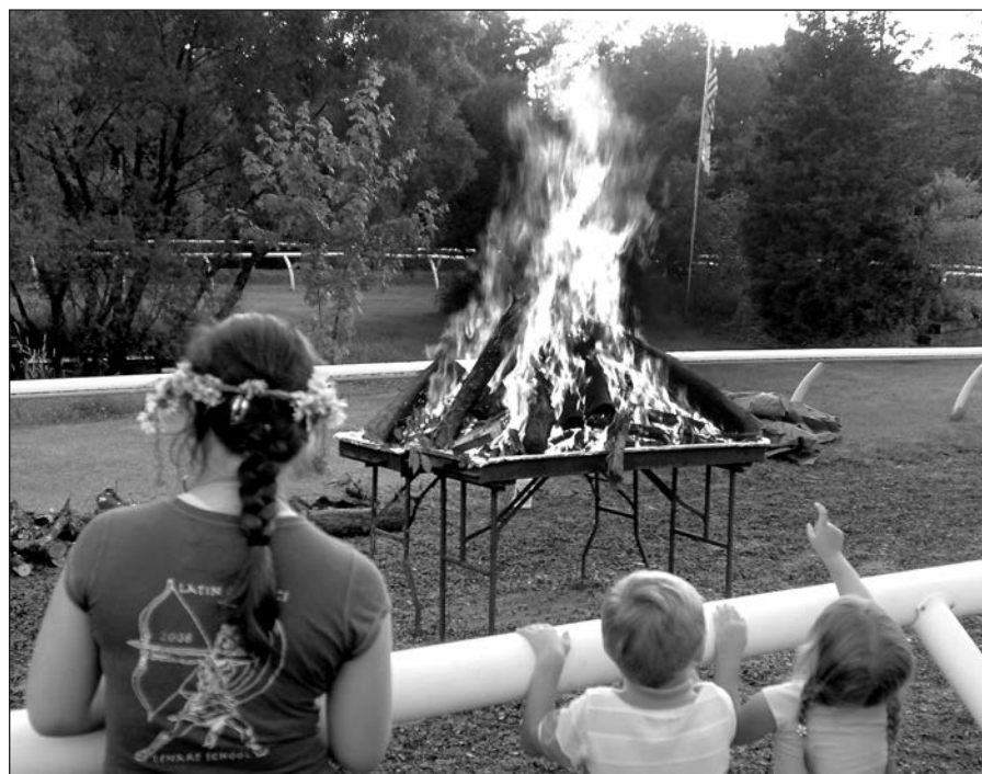
Kokios Joninės be laužo?