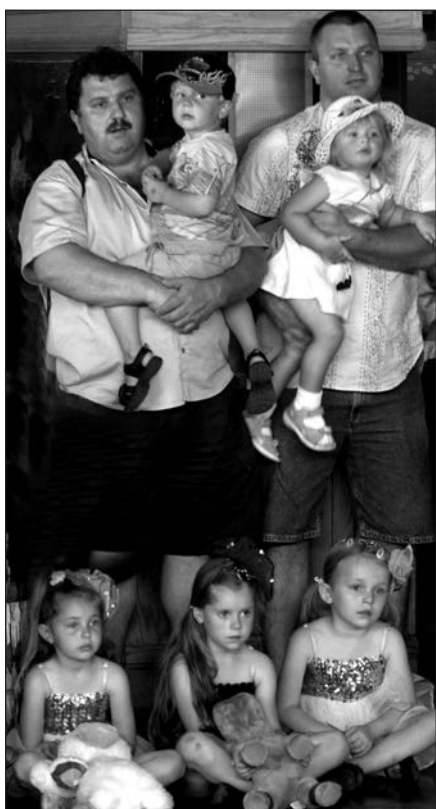
Įdomu dideliam ir mažam...