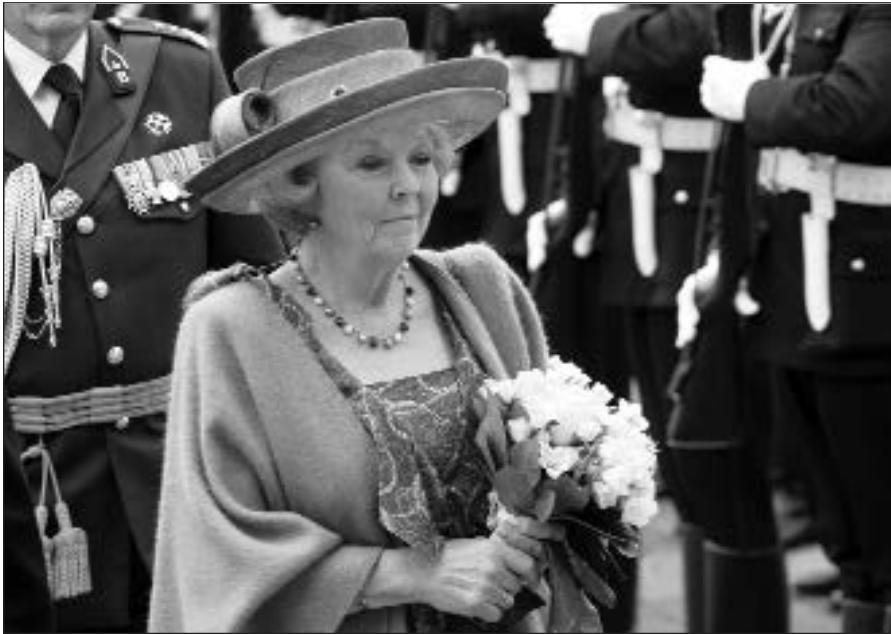
Prezidentūroje Nyderlandų karalienę Beatrix pasveikino garbės sargyba.