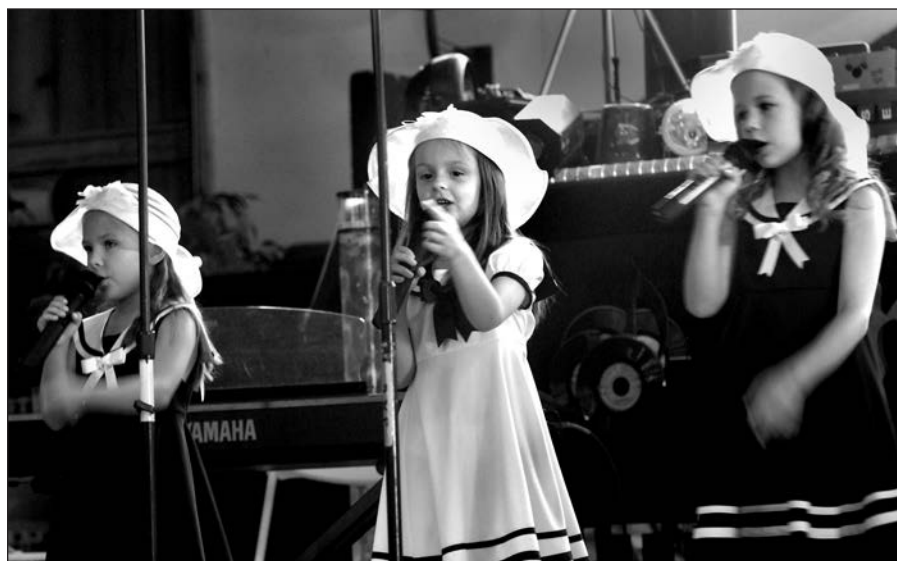
Mažosios „Tu ir aš“ dainininkės.