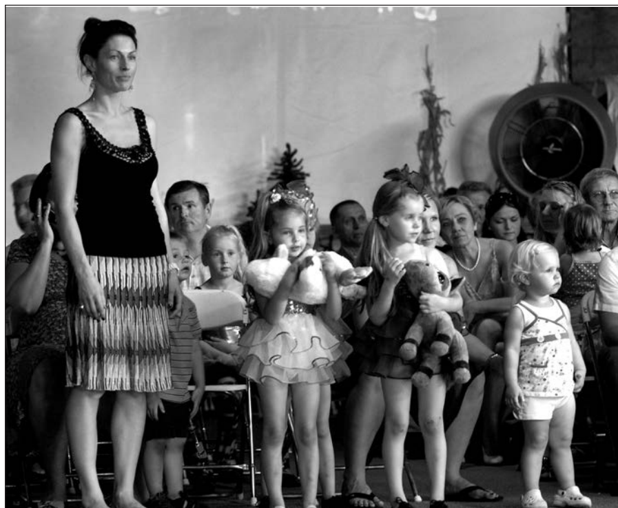
„Dance Duo“ šokėjėlės pasiruošusios šokti.