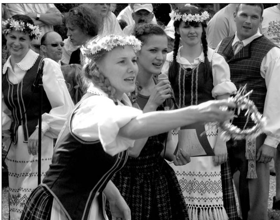
Kas toliau numes vainikėlį?