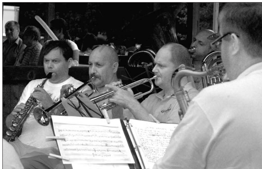
Dūdų orkestras „Gintaras“ Joninėse groja pirmą kartą.