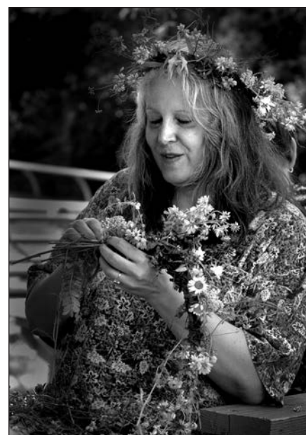
Pinsiu pinsiu vainikėlį.