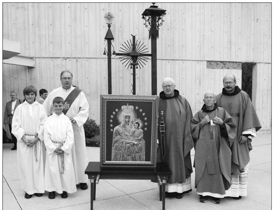
2008 m. gegužės 25 d. renkantis šv. Mišioms parapijiečius pasitiko Šiluvos M. Marijos paveikslas pastatytas prieš įėjimą į šventovę.