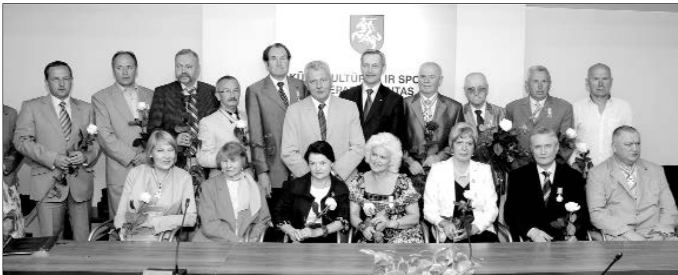
Buvo pagerbtas nemažas būrys Lietuvos sportui nusipelnusių sporto darbuotojų, veteranų bei sportą mylinčių žmonių.