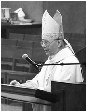
Sigitas Tamkevičius, SJ

Kartą kalbėjau universiteto studentams apie Dievo Motinos apsireiškimą Šiluvoje Lietuvos istorijos kontekste. Vienas iš klausytojų paklausė, kas nulėmė, kad esant labai nepalankioms istorinėms sąlygoms, Katalikų Bažnyčia Lietuvoje išaugo ir tapo gausiausia konfesija. (...) Į šį klausimą būtų nelengva atsakyti, jei atsižvelgtume grynai į žmogiškąjį faktorių. Natūraliai Bažnyčia turėjo sunykti. Tačiau Lietuvos istorijoje matome labai ryškiai išsipačiusias Dievo Motinos Marijos pėdas. Be abejo, jos yra ryškiausios Šiluvos žemėje, tačiau ne vienintelės. Aušros Vartai, Trakai, Pivašiūnai, Žemaičių Kalvarija, Krekenava, Pažaislis – tai vietos, kurias žino ir lanko piligrimai. Tose vietose tikinčiųjų didžiausias pagar-