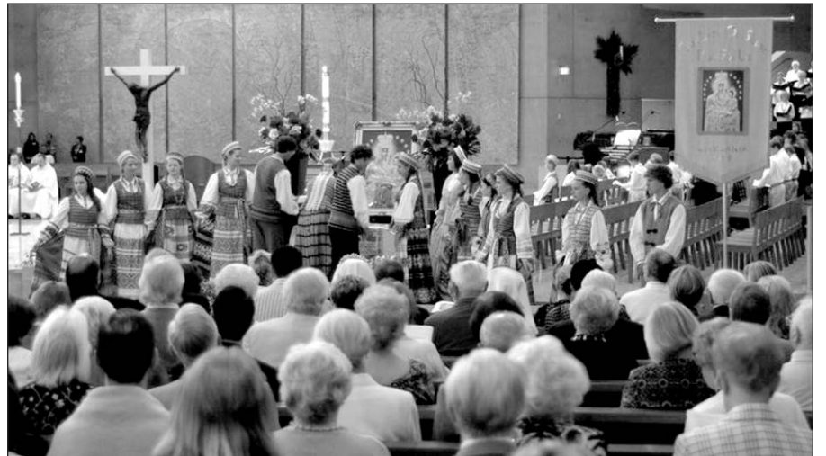
400 metų nuo Marijos apsireiškimo Šiluvoje jubiliejaus iškilmėse Los Angeles katedroje gegužės 4 d.

Dievo Motina Marija, globok čia susirinkusius ir po visą pasaulį pasklidusius Lietuvos vaikus. Amen.