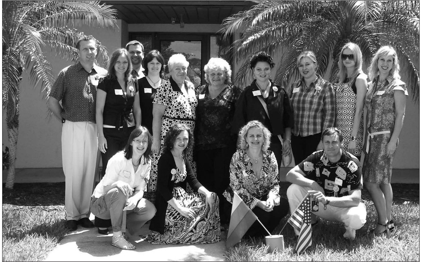
Bendra konferencijos dalyvių nuotrauka.

Ir problemos visose mokyklose panašios – vienam mokytojui tenka dirbti su skirtingo amžiaus ir turinčių skirtingą žinių lygį vaikais, sunku pasirinkti vadovėlius, trūksta pasiūlytų mokytojų, sutinkančių dirbti už simbolinį atlyginimą, brangi patalpų nuoma ir t. t. Tą sąrašą gali-