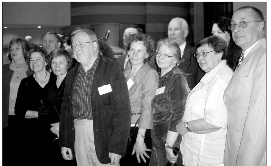
Gargždiečiai įsiamžino su prof. Vytautu Landsbergiu.

Gegužės 17-oji iš tiesų buvo neeilinė diena Lietuvos istorijoje, bet ar ji pakeis Lietuvos gyvenimą, priklausys nuo būsimųjų darbų.