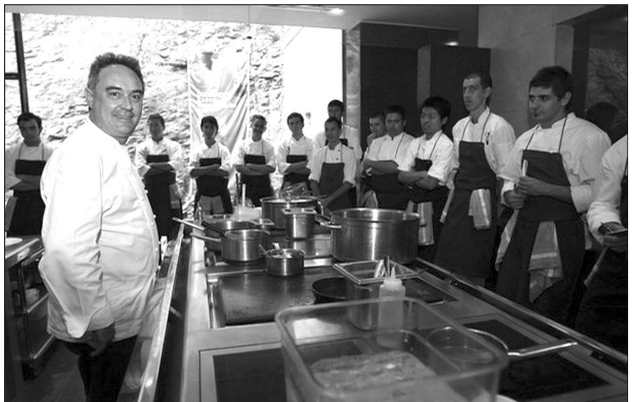
Europoje geriausiu pripažinto „el Bulli“ (Ispanija) restorano virtuvė.