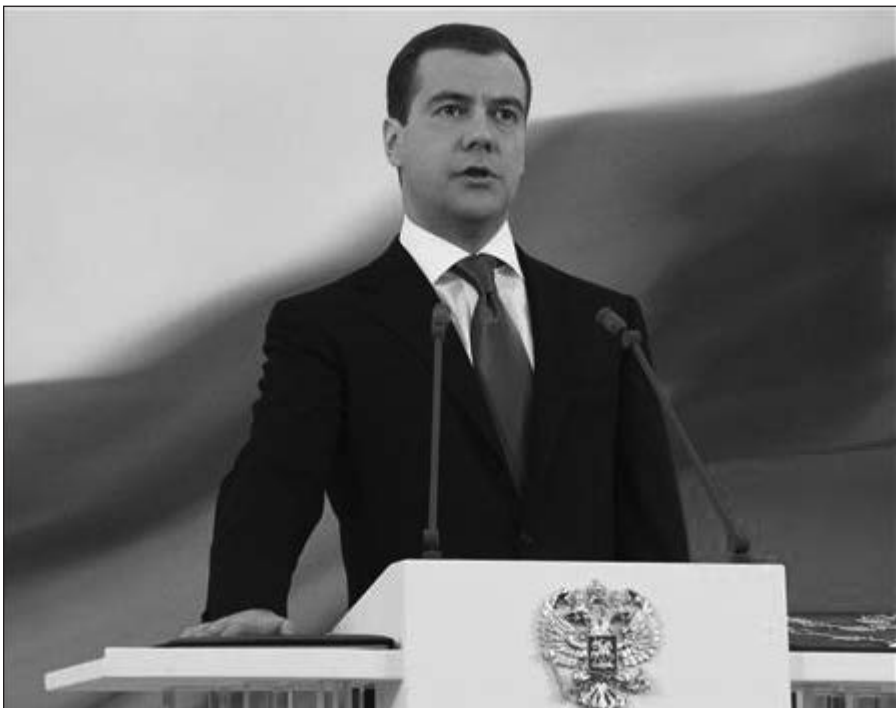
Kremliuje prisiekia naujasis Rusijos prezidentas Dmitrij Medvedev.

Maskva , gegužės 7 d. (AFP–„Reuters“–„Interfax“–BNS) – Kremliuje trečiadienį naujuoju Rusijos prezidentu iškilmingai buvo prisaiškintas Dmitrij Medvedev, kuris savo svarbiausiu uždaviniu nurodė žmogaus teisių ir ekonominių laisvių gynimą.