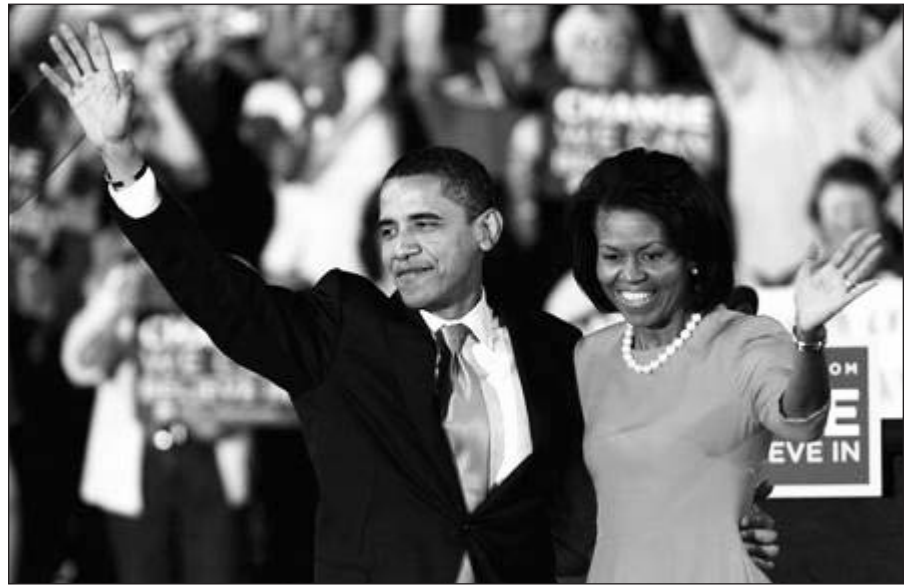
Barack Obama yra aiškus antradienio nugalėtojas.