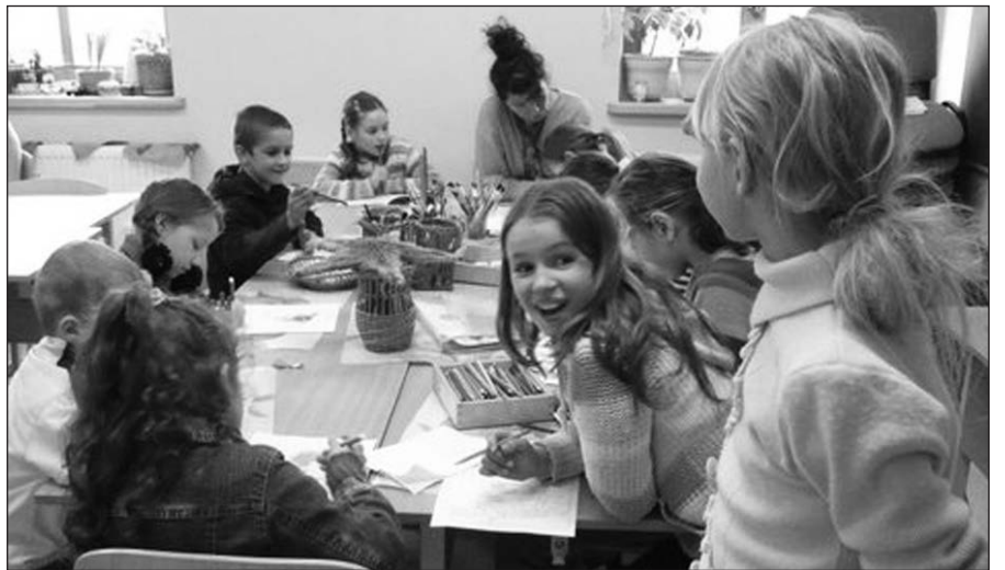
Žemaičių Kalvarijos „Vilties vėrinėlių” dienos centro lankytojos palinkusios prie meno darbų.

JAV organizacijos nariai telkia lėšas ir į Lietuvą siunčia užimtumo ir mokslo priemones. Redakcinis kolektyvas rašo charakterio ugdymo programas, skirtas centrų. Centruose vaikai atlieka pamokas, pavalgo ir yra prasmingai užimami rūpestingų suaugusiųjų. Į centrų šventes kviečiami centrus lankančių vaikų tėvai