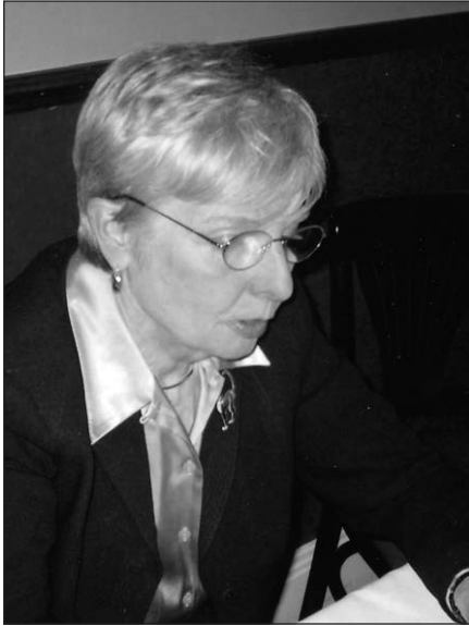
E. Clift, atvykusi iš Washington, DC, pristato savo knygą „Two Weeks of Life – A Memoir of Love, Death, and Politics“ Cleveland.

„Dvi gyvenimo savaitės – prisiminimai apie meilę, mirtį ir politiką“, toks lietuviškos knygos pavadinimas, kurią parašė Eleanor Clift, nuolatinė TV „The McLaughlin Group“ politinės analizės programos dalyvė.