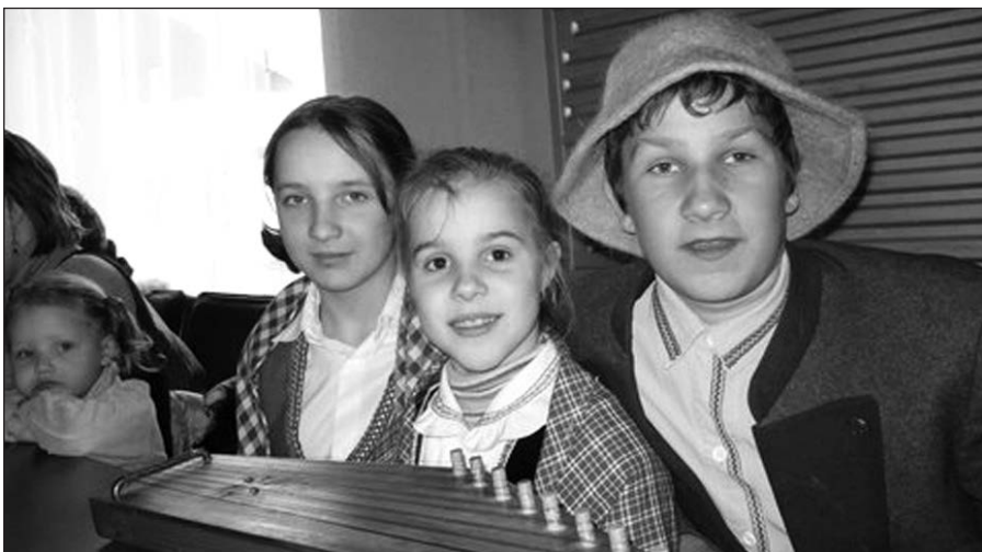
Žemaičių Kalvarijos „Vilties vėrinėlių” dienos centro liaudies muzikos kapela.

„Vilties vėrinėlių” dienos centro nuotr.