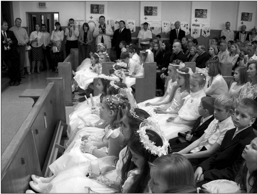
Nemažas būrelis Čikagos lituanistinės mokyklos mokinių priėmė Pirmąją Komuniją.