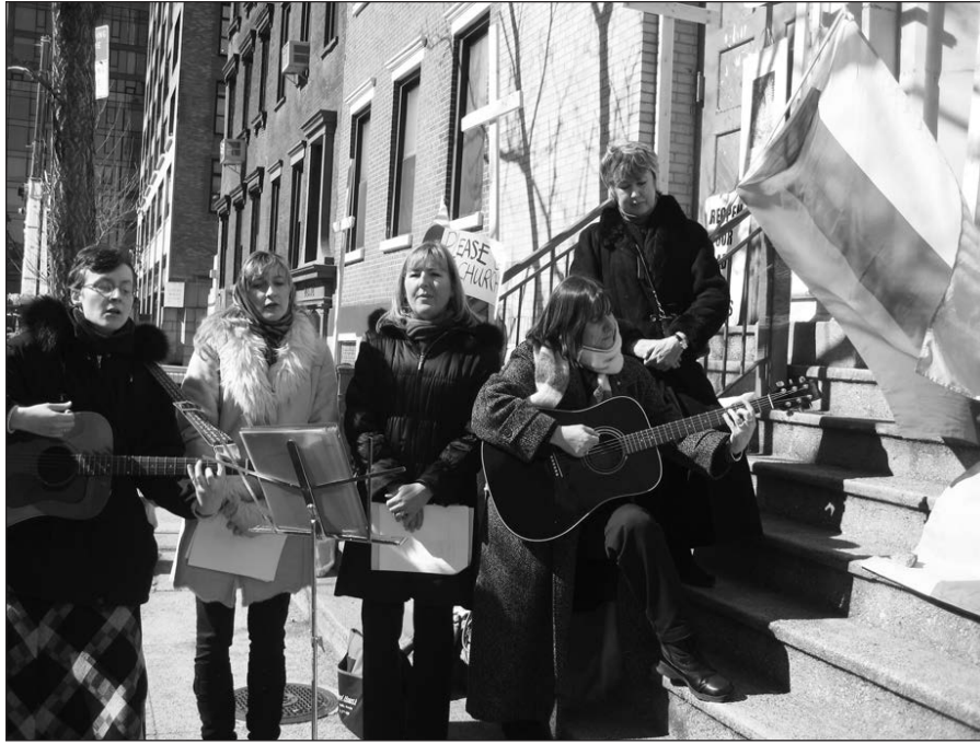
„Jaunų širdžių“ ansamblis gieda ant AV bažnyčios laiptų New York.

Kai aš 2006 metais buvau Pasaulio Lietuvių Bendruomenės suvažiavime Lietuvoje, Lietuvos prezidentas Valdas Adamkus savo kalboje minėjo,