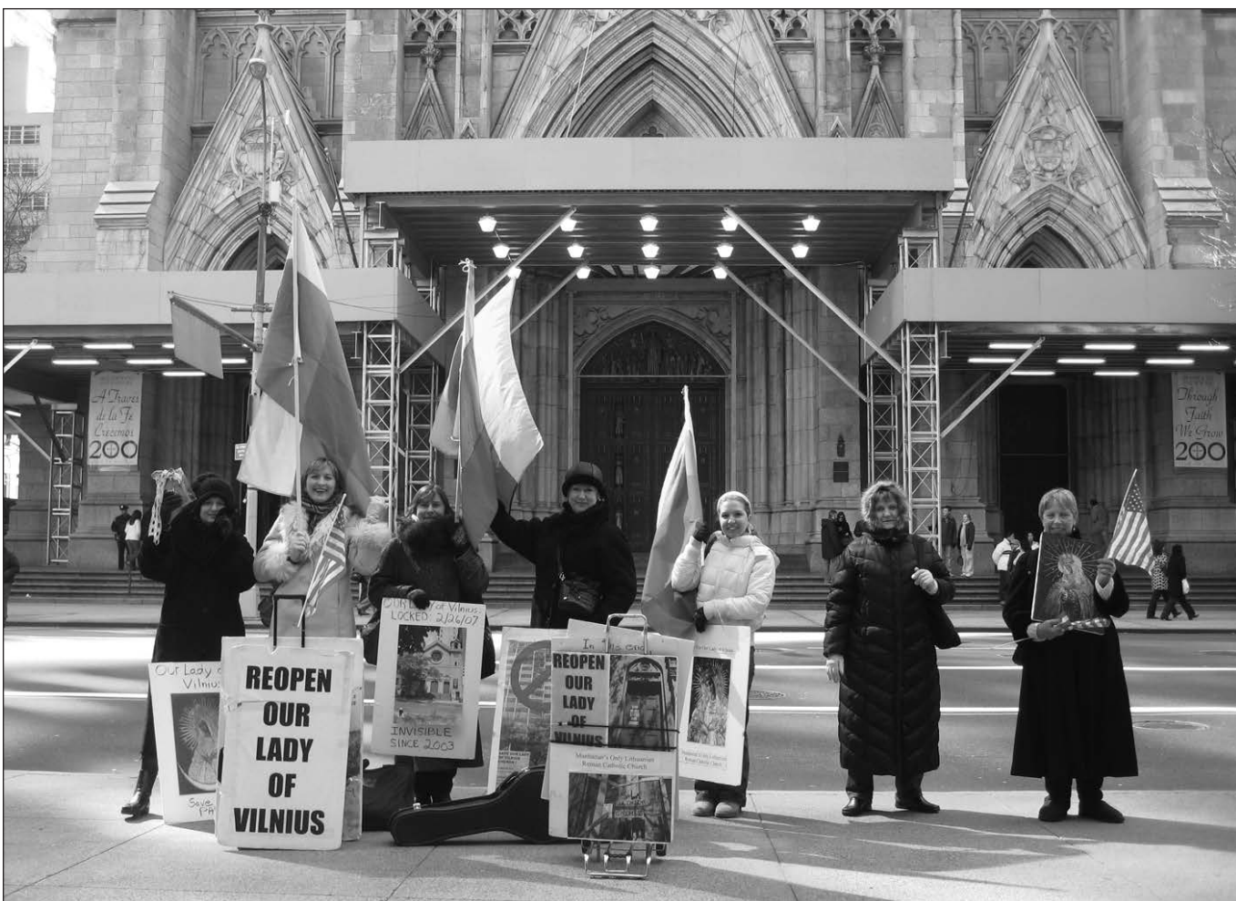
Protesto akcija ant šaligatvio prieš New York katedrą kardinolo Eagan Mišų metu.