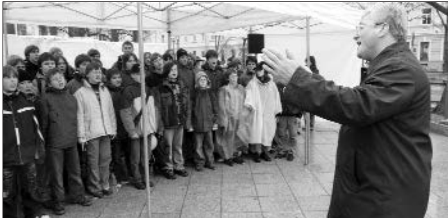
Prie Vyriausybės „Ažuoliuko“ choras surengė tariamą Dainų šventės repeticiją.

Vilnius , balandžio 20 d. (ELTA) – Vyriausybė nutarė 200 mln. Lt iš Privatizavimo fondo skirti nebe Nacionalinio stadiono statyboms, o mokytojų algoms kelti.