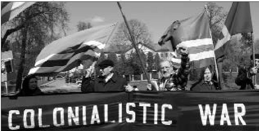
Čečėnijos rėmėjų mitingas.