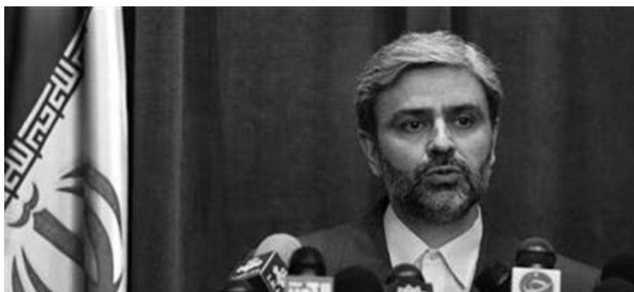
Irano užsienio reikalų ministro Mohammad Ali Hosseini spaudos konferencija.