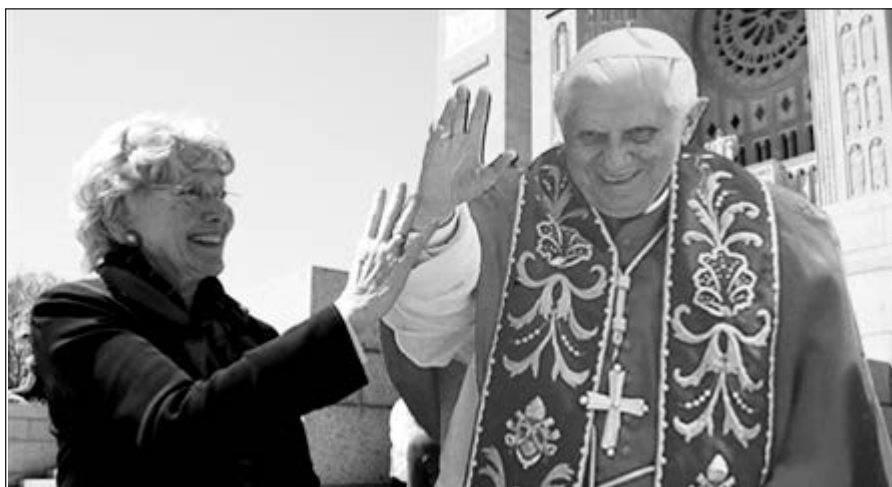
Popiežius Benediktas XVI susitiko su JAV tikinčiaisiais.