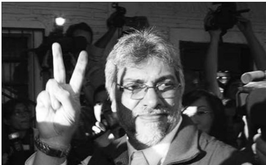
Buvęs vyskupas Fernando Lugo laimėjo Paragvajaus prezidento rinkimus.

Asunsjonas , balandžio 21 d. (AFP-BNS) – Kairiųjų pažiūrų buvęs vyskupas Fernando Lugo sekmadienį laimėjo istorinius Paragvajaus prezidento rinkimus – jis įveikė valdančiosios „Kolorado“ partijos kandidatę Blanca Ovelar ir nutraukė 61 metus trukusį šios partijos viešpatavimą.