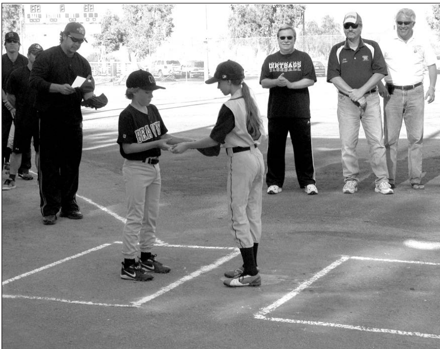
Akimirkos iš beisbolo varžybų Kalifornijos valstijoje.

Antrąją viešnağės savaitę vilniečiai sužais dar 8 rungtynes. Taip pat aplankys ir visame pasaulyje garsų „Disneyland” pramogų centrą. Į namus vilniečiai su palydovais pajudės balandžio 7 d.