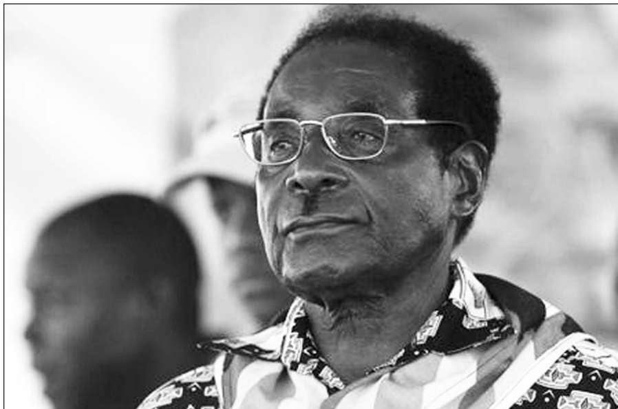
Zimbabvės prezidentas Robert Mugabe.