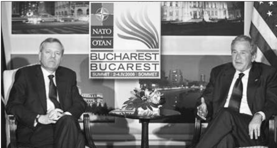
NATO generalinis sekretorius Jaap de Hoop Scheffer (k.) ir JAV prezidentas G. W. Bush susitikimo Bukarešte metu.

Bukareštas , balandžio 3 d. („Reuters“/BNS) – NATO patvirtino, kad netrukus oficialiai pakvies Balkanų kaimynes Kroatiją ir Albaniją įstoti į šią karinę sąjungą, bet dėl Graikijos priešinosi atidėjo kvietimą Makedonijai. Vienas NATO pareigūnas sakė, kad kvietimai jau pat-