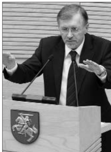
Ministras pirmininkas G. Kirkilas.

Vilnius , balandžio 3 d. (ELTA) – Ministras pirmininkas Gediminas Kirkilas, įveikęs jam parlamentarų grupės pradėtą nepasitikėjimo procedūrą, išsilaiškė premjero pareigose.