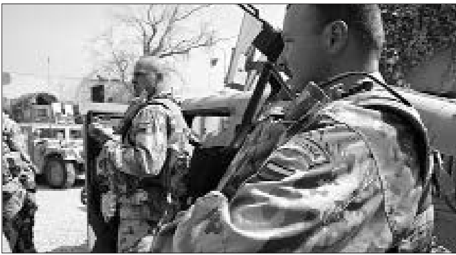
Lietuvos kariai Irake.