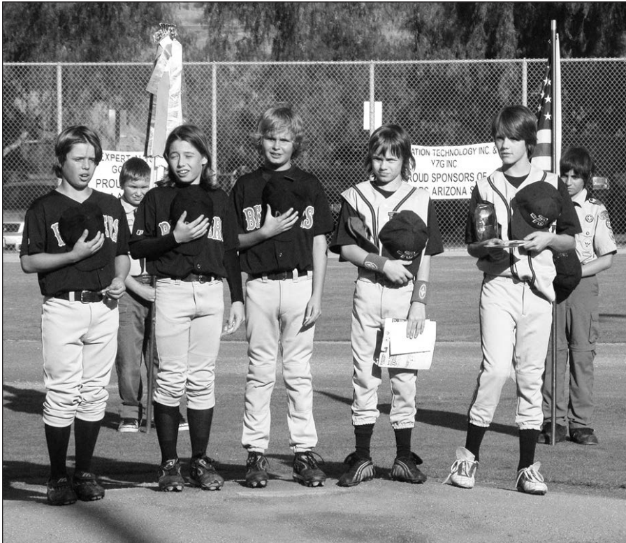
„Sporto vilkų” klubo jaunieji žaidėjai.