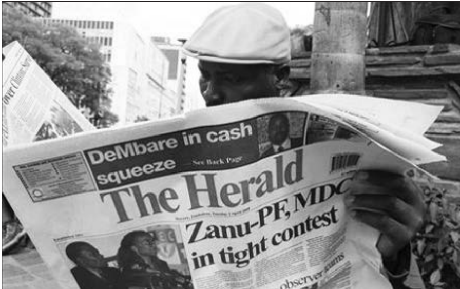
Zimbabvės gyventojai domisi rinkimų rezultatais.