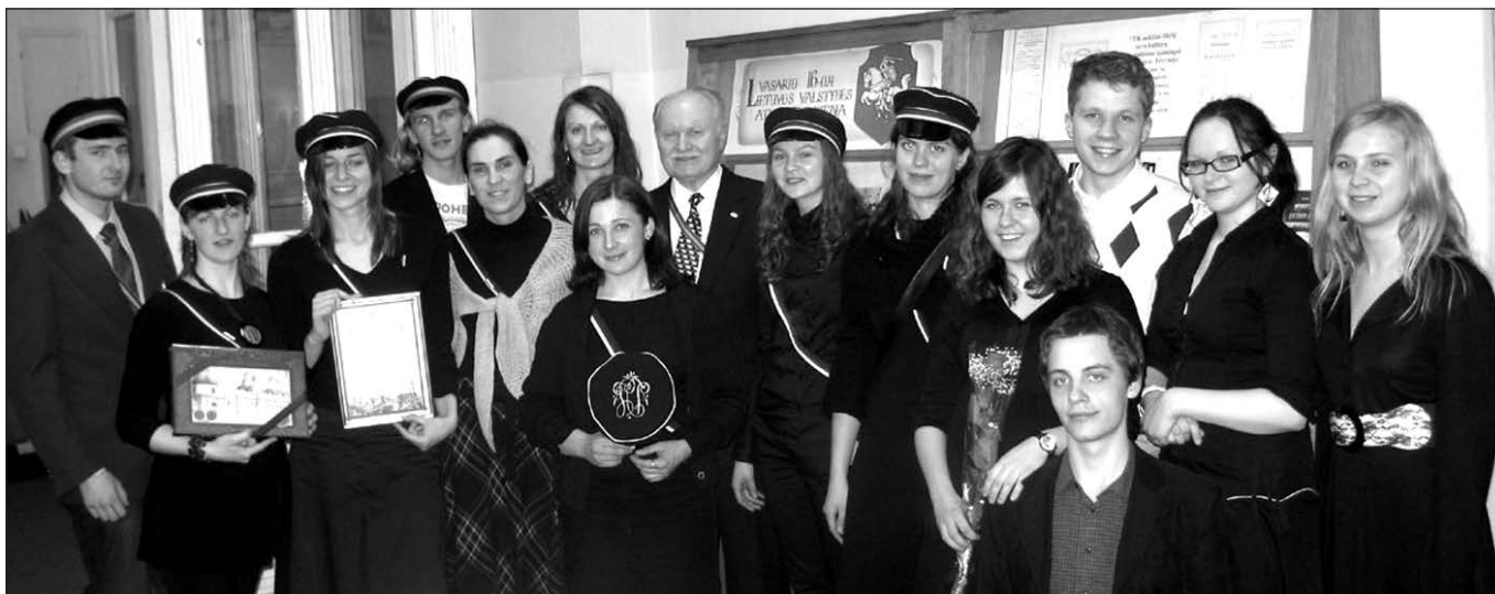
Konkurso ir koncerto talkininkai, Studentų skautų organizacijos nariai.