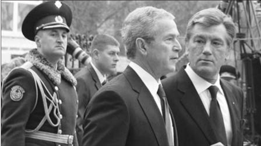
JAV ir Ukrainos prezidentai iškilmingo susitikimo metu Kijeve.

Kijevas , balandžio 1 d. („Interfax“/BNS) – JAV suteiks visokeriopą pagalbą Ukrainos siekiui įstoti į NATO, Kijeve pareiškė prezidentas George W. Bush. „Jūs žinote, jog numatyta keletas veiksmų, kuriuos turi atlikti Ukraina, siekdama įstoti į NATO, ir jūs žinote, kad JAV teikia visokeriopą pagalbą Ukrainos stojimui į NATO“, – sakė jis spaudos konferen-