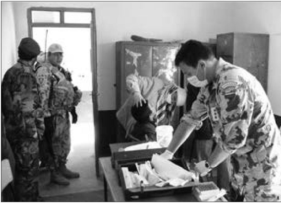
Afganistano gyventojams suteikiama medicinos pagalba.