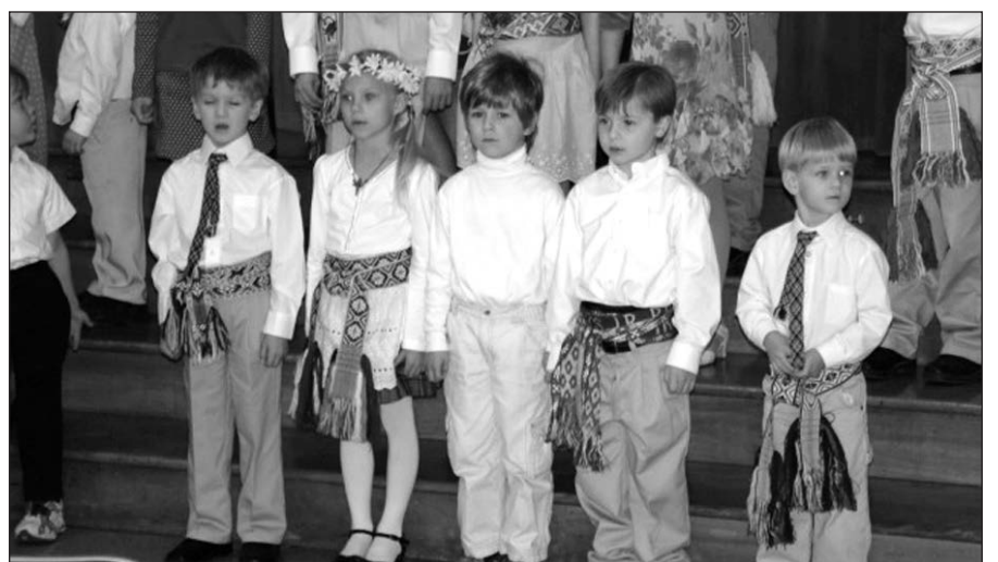
Jaunieji minėjimo dalyviai.