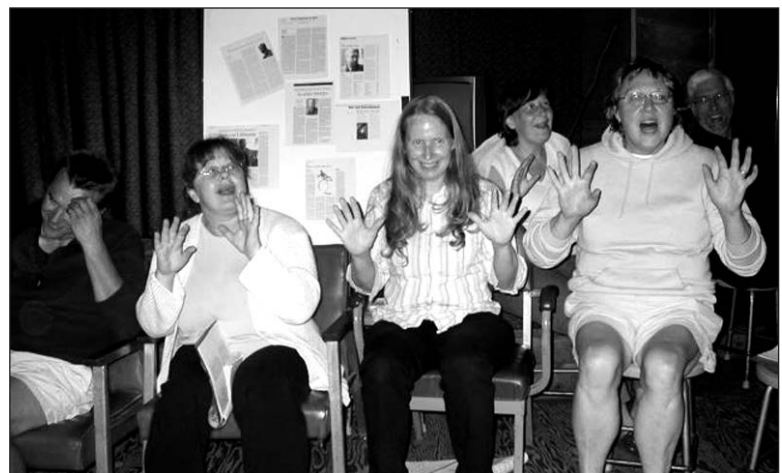
Nuotraukoje: Meno8Dienos dalyviai Neringoje 2007 m.

Kiekvieną vakarą vyks teminės vakaronės. Daugiau informacijos: Neringos tinklalapyje: www.neringa.org