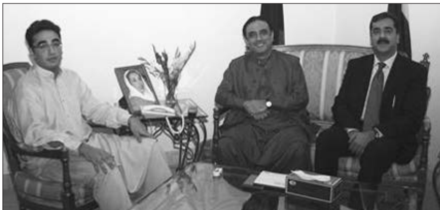
Naujasis Pakistano ministras pirmininkas Yousaf Raza Gilani (d) su partijos vadovais Bilawal Bhutto Zardari (k) ir Asif Ali Zardari (c).

Islamabadas , kovo 24 d. („Reuters“/BNS) – Pakistano Nacionalinė Asamblėja pirmadienį ministru pirmininku išrinko Yousaf Raza Gilani, kurį kandidatą į šias pareigas iškėlė nužudytosios ministrės pirmininkės Benazir Bhutto partija.