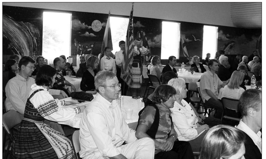
Salė buvo pilna ne tik dalyvių, bet ir žiūrovų.