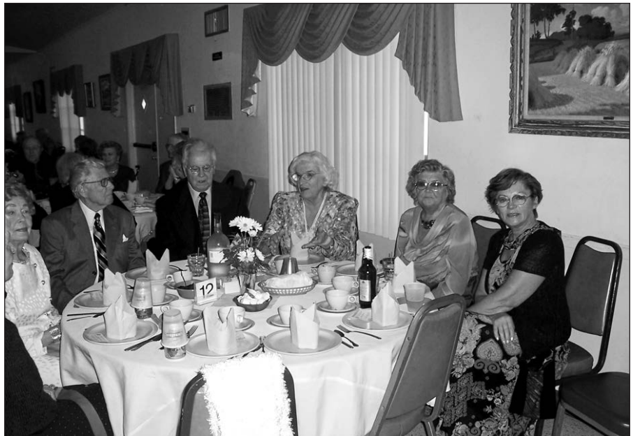
Dalis vakarienės dalyvių.