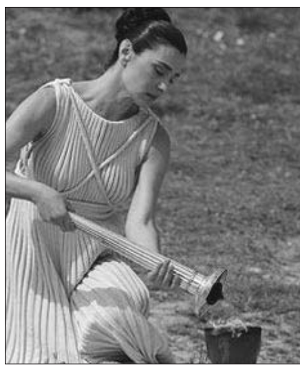
Uždegama olimpinė ugnis.

Olimpija, Graikija , kovo 24 d. (AFP/BNS) – Olimpijoje, kur užgimė olimpinės žaidynės, per ceremoniją sustiprinto saugumo sąlygomis buvo uždegta Bejing olimpiados ugnis.