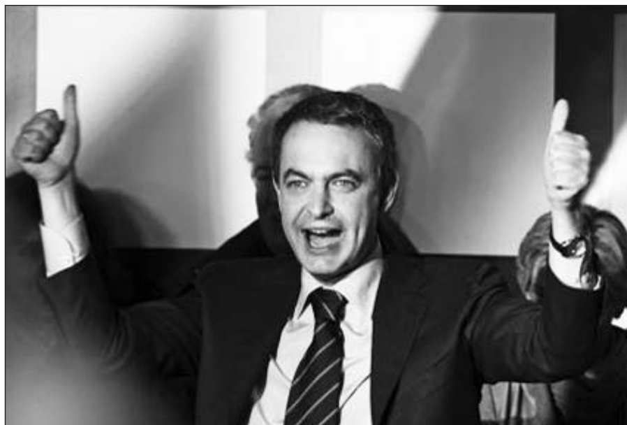
Ispanijos valdantieji socialistai džiaugiasi pergale.