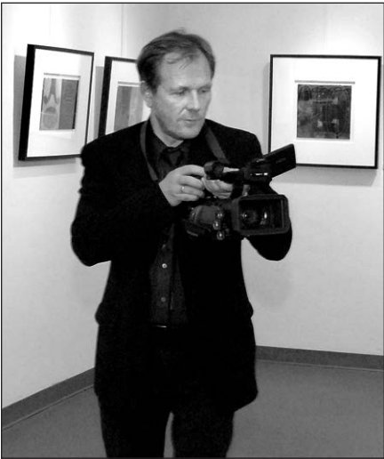
Dailininkas Rimas Čiurlionis.