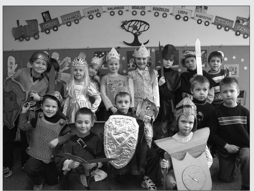
Čikagos lituanistinės mokyklos darželinukai šventė Kovo 11–ąją. Ta proga visi berniukai tapo karžygiais, o mergaitės – karalaitėmis.