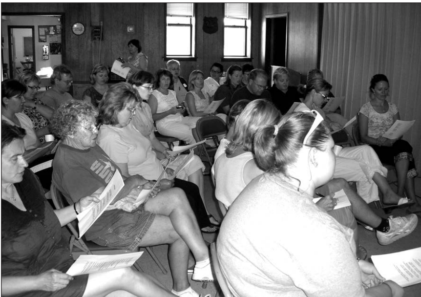
2007 m. Mokytojų tobulinimosi ir Lituanistikos kursų dalyviai stovyklos choro repeticijoje.