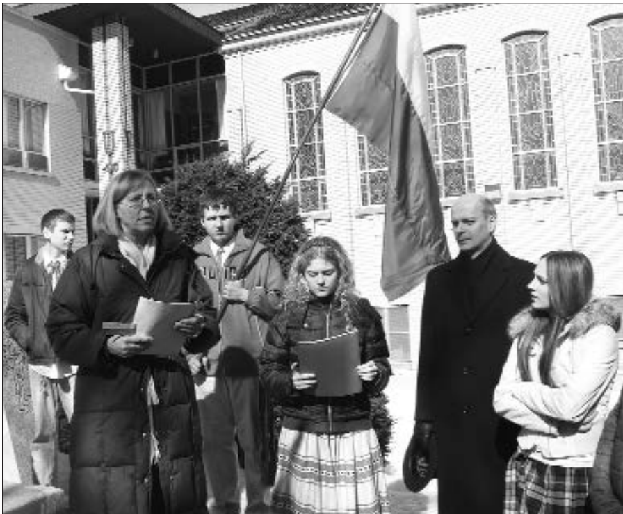
Tylos minute buvo pagerbti žuvusieji už mūsų tėvynės laisvę.