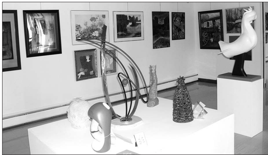
Vasario 22 d. atsidarančios parodos ekspozicijos dalis.