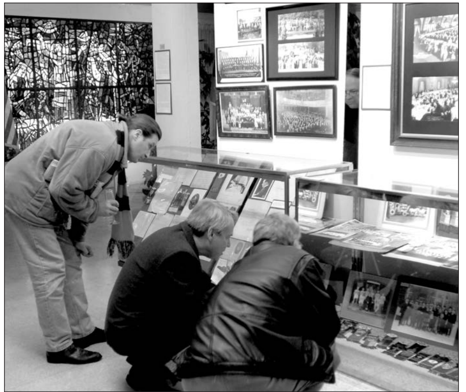
Parodos lankytojai apžiūri eksponatus.

PIRKSIU: A.Varno, A. Valeškos, P. Domšaičio, B. Murino, A. Dargio ir A. Rukštelės tapybos darbus. Tel. 708-349-0348.