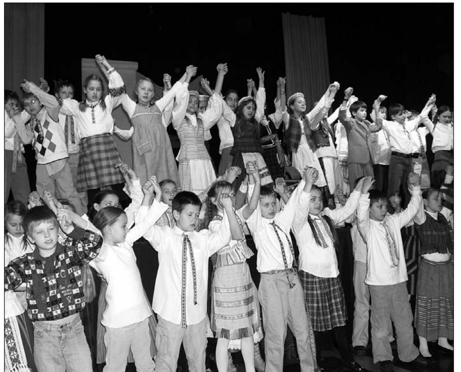
Dainą skiriame Lietuvai.