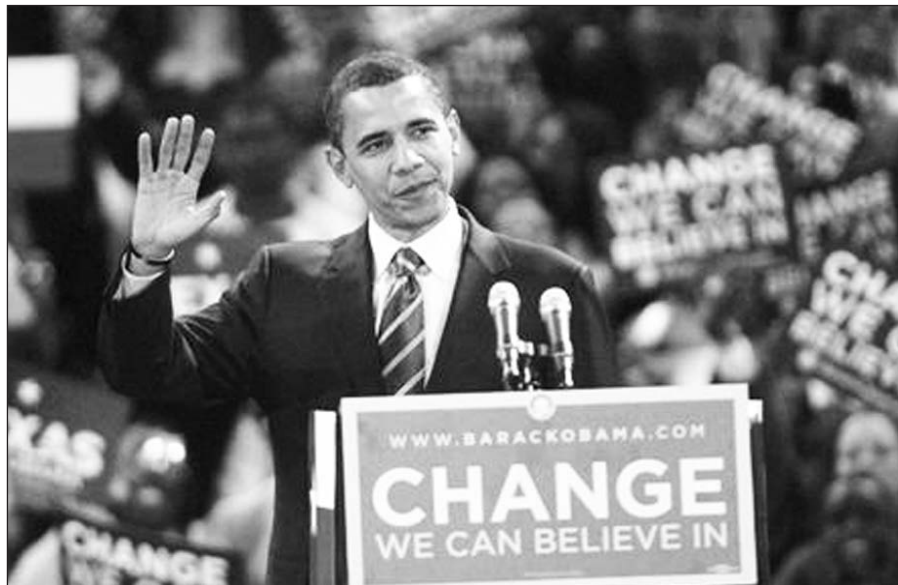
Barack Obama ryžtingai veržiasi į priekį.