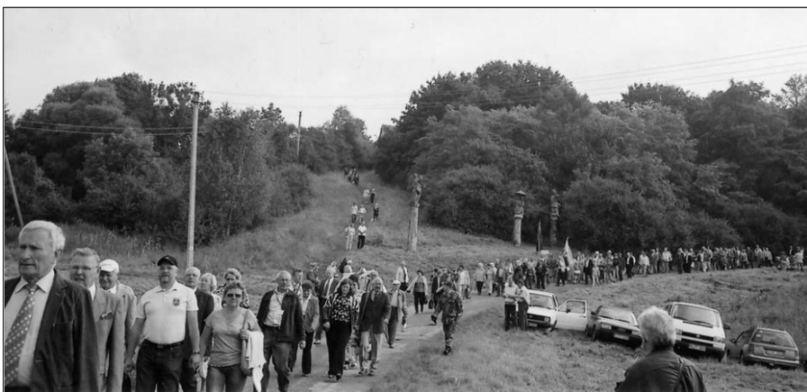
Tremtinių eisena į Dubysos slėnį Ariogaloje.