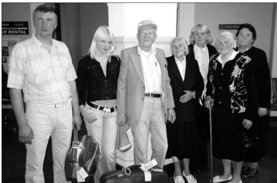
Pasitinka giminės Vilniuje.