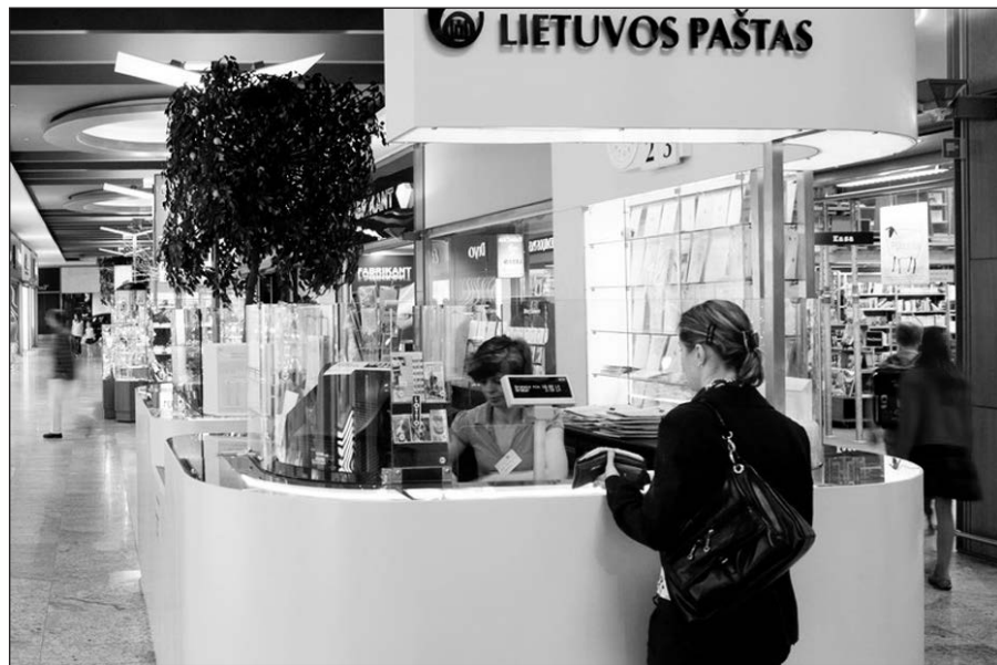
Gražiai įrengti Lietuvos pašto kioski.