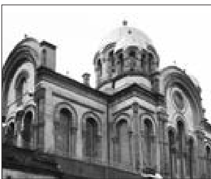
Lukiškių tardymo izoliatorius.