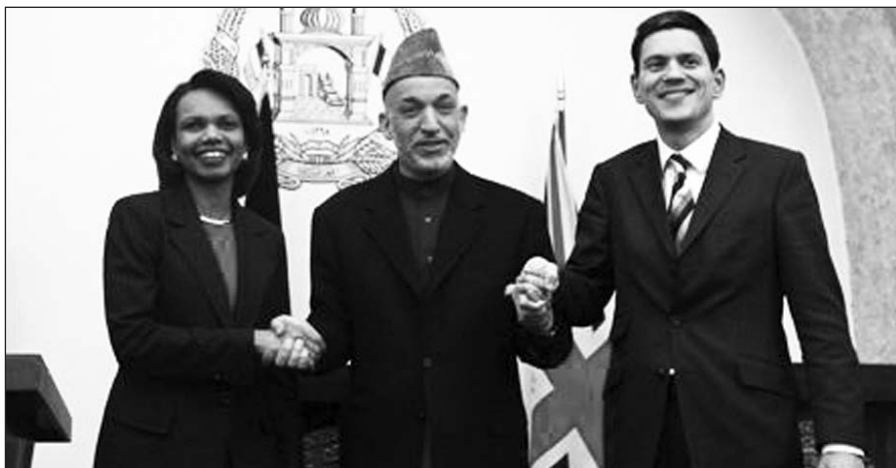
C. Rice, Afganistano prezidentas Hamid Karzai ir D. Miliband.

Kabulas–Washington, DC , vasario 7 d. (AFP–BNS) – JAV valstybės sekretorė Condoleezza Rice ir britų užsienio reikalų sekretorius David Miliband ketvirtadienį atvyko netikėtai vizito į Afganistaną.