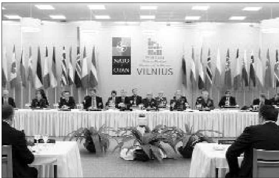
Vilniuje vyksta NATO šalių gynybos ministrų susitikimas.

Vilnius , vasario 7 d. (ELTA) – Vilniuje prasidėjo neformalus NATO gynybos ministrų susitikimas, kuriam vadovauja NATO generalinis sekretorius Jaap de Hoop Scheffer. Šis susitikimas yra pats didžiausias každa nors Lietuvoje organizuotas NATO renginys. Jame dalyvauja dau-