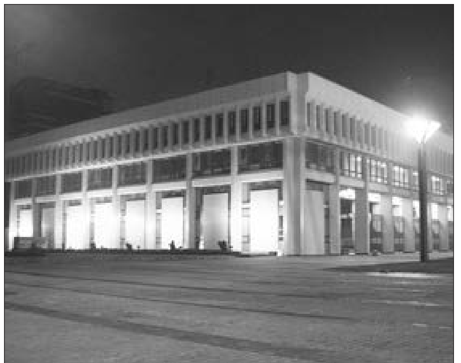
Istorinio sprendimo padarinius pajusime vėliau.