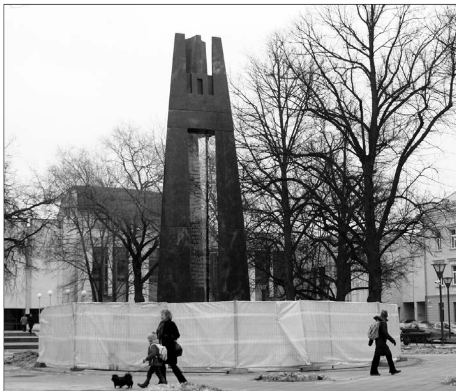
Savivaldybės aikštėje kyla paminklas V. Kudirkai.