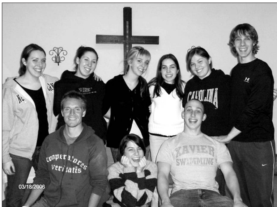
Rekolekcijų, vykusių Dainavoje, dalyviai.

Užsienio lietuvių katalikų jaunimo sielovados vedėja