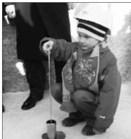
Bus statomas Nacionalinis stadionas.

Vilnius, vasario 4 d. (BNS) – Vilniuje oficialiai pradėtos daug visuomenės ginčų sukėlusios Nacionalinio stadiono statybos. Simbolinės kapsulės atėties kartoms įkasimo ceremonijoje dalyvavo Vyriausybės, savivaldybės, stadioną statančios bendrovės „Veikmė” ir kitų institucijų atstovai.