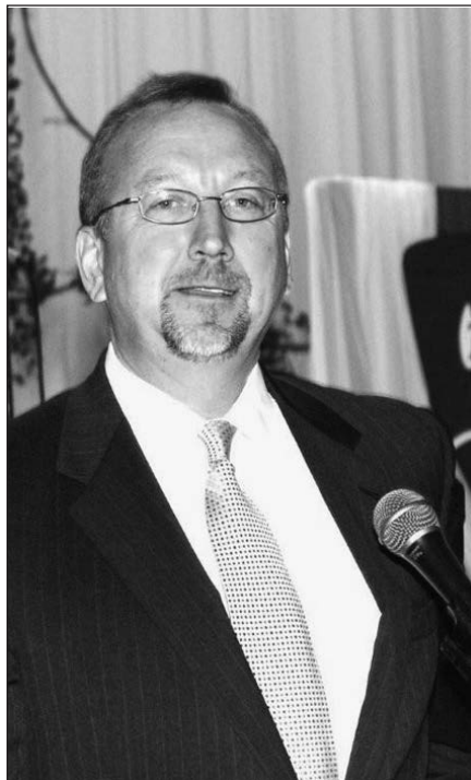
Michigano respublikonų partijos pirmininkas kalba JAV LB Detroito apylinkės Vasario 16-tos minėjime 2007 m.

Į minėjimą yra pakviesti dalyvauti Kongreso nariai Joe Knollenberg ir Thaddeus McCotter. Abu šie atstovai yra mums brangūs, nes jie Lietuvai daug padėjo, ypač kai ta pagalba buvo itin reikalinga, pavyzdžiui, dirbant dėl Lietuvos įstojimo į NATO. Kongreso narys McCotter yra vienas iš Kongreso rezoliucijos nr. 128 autorių, kurioje teigiama, jog Rusija turi atsiprašyti Lietuvos, Latvijos ir Estijos už neteisėtą okupaciją ir aneksiją nuo 1940 m. iki 1991 metų. Rezoliuciją Kongresui pasiūlė John Shimkus (R-IL) kartu su aštuoniais kitais nariais, tarp kurių yra ir Thaddeus McCotter (R-MI) ir kitas Michigano valstijos Kongreso narys Michael Rogers (R-MI). Ši rezoliucija yra labai svarbus dokumentas Lietuvos valstybei, ja primenama, kad Lietuva buvo nepriklausoma nuo 1918, o ne nuo 1991 metų. Rusija, nors ir buvo pripažinusi 1918 m. Lietuvos nepriklausomybės paskelbimą, dabar to fakto prisiminti nenori.