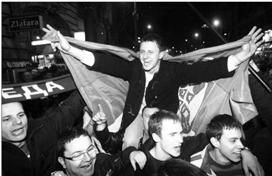
Paskelbus rinkimų rezultatus Belgrade prasidėjo linksmybės.

Belgradas , vasario 4 d. (AFP – BNS) – Serbijos prezidento rinkimuose sekmadienį antrajai kadencijai perrinktas provakarietišku pažiūrų Boris Tadić, rodo rezultatai, kuriuos paskelbus Belgrade prasidėjo linksmybės, nors ir baiminamasi dėl artėjančios Kosovo nepriklausomybės.