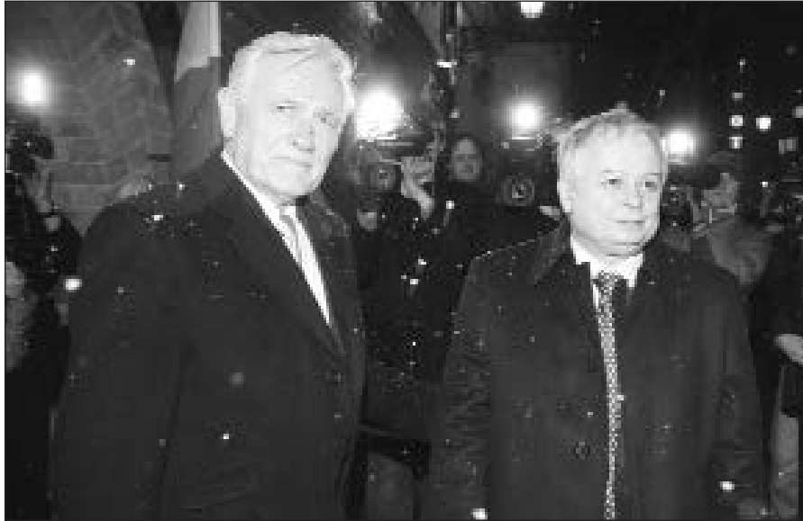
V. Adamkus (kairėje) susitiko su Lenkijos vadovu L. Kaczyński.