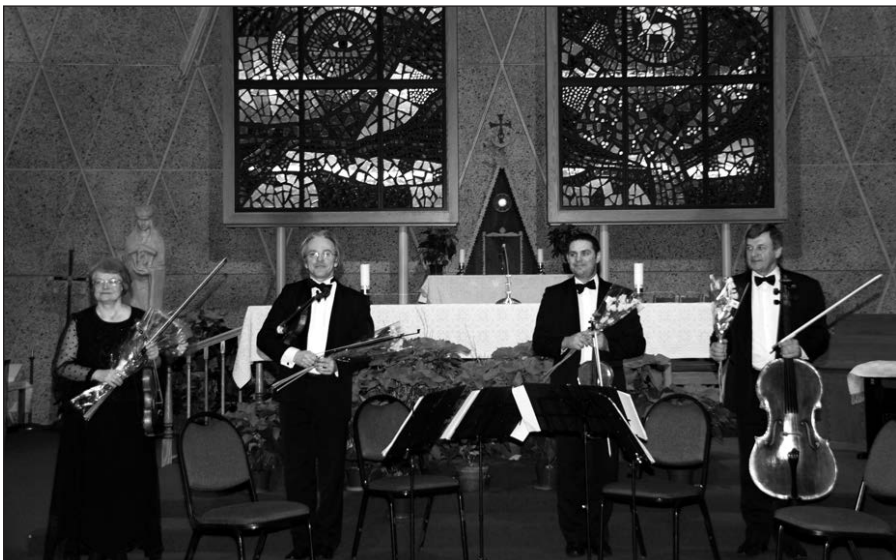
Palaimintojo Jurgio Matulaičio misijos bažnyčioje vykęs kamerinės muzikos koncertas sulaukė audringo pasisekimo.