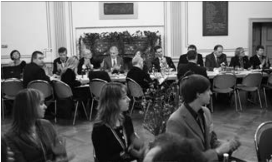
Europos kraštų lietuvių susitikimo dalyviai.