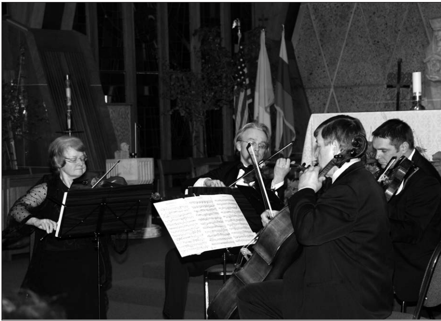
Griežia Vilniaus styginių kvartetas.