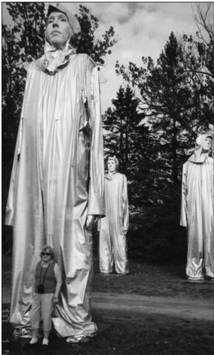
Skulptūra „Erdvės žmonės“. Prieky jų stovi straipsnio autorė.