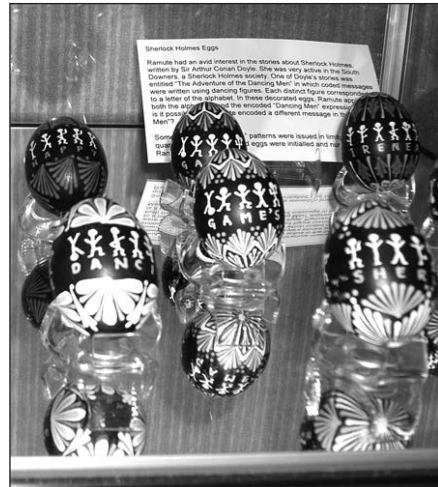
„Sherlock Holmes“ margučiai Balzeko Laimos Apanavičienės nuotraukos

Gal aš ir klystu, tačiau man gražiausi jos darbai – lietuviški margučiai. Kiek reikia turėti talento, meilės, kiek reikia žinoti meno paslapčių, kad galėtum sukurti tokius – nepabijosiu šio žodžio – sedevrus. Balzeko