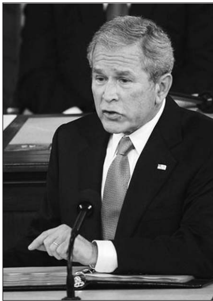
Prezidentas George W. Bush

„Tai, ką jis pasiūlė, buvo tas pats erzinantis išipareigojimas tai pačiai žlugusiai politikai, kuri padėjo kol kas didžiausią perteklių paversti