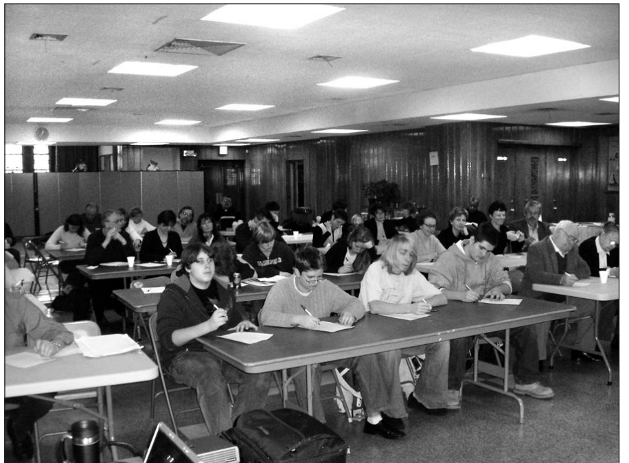
Niujorko lietuviai rašo diktantą.

LR generalinio konsulato Niujorko informacija