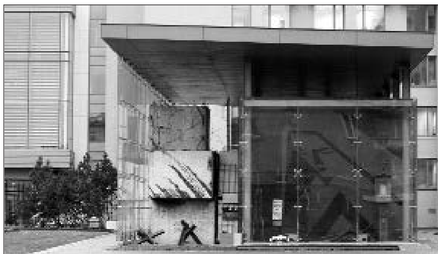
Sausio 13-osios atminimo muziejus.