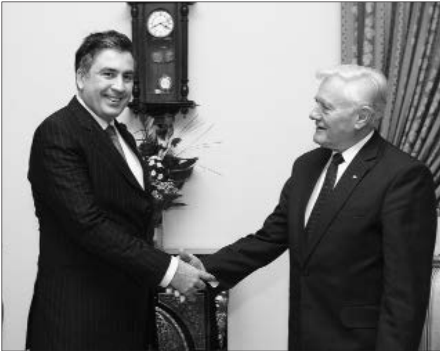
Gruzijos prezidentą sveikina Lietuvos vadovas V. Adamkus.