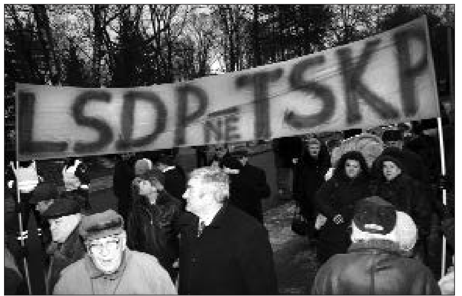
Protestuota prieš oligarchams tarnaujančius politikus.

Konkursas „Lietuvos kultūros sostinė 2008“ prasideda sausio 21 d., Konkurso laimėtojas bus skelbiamas balandžio 15 d. – Kultūros diena.