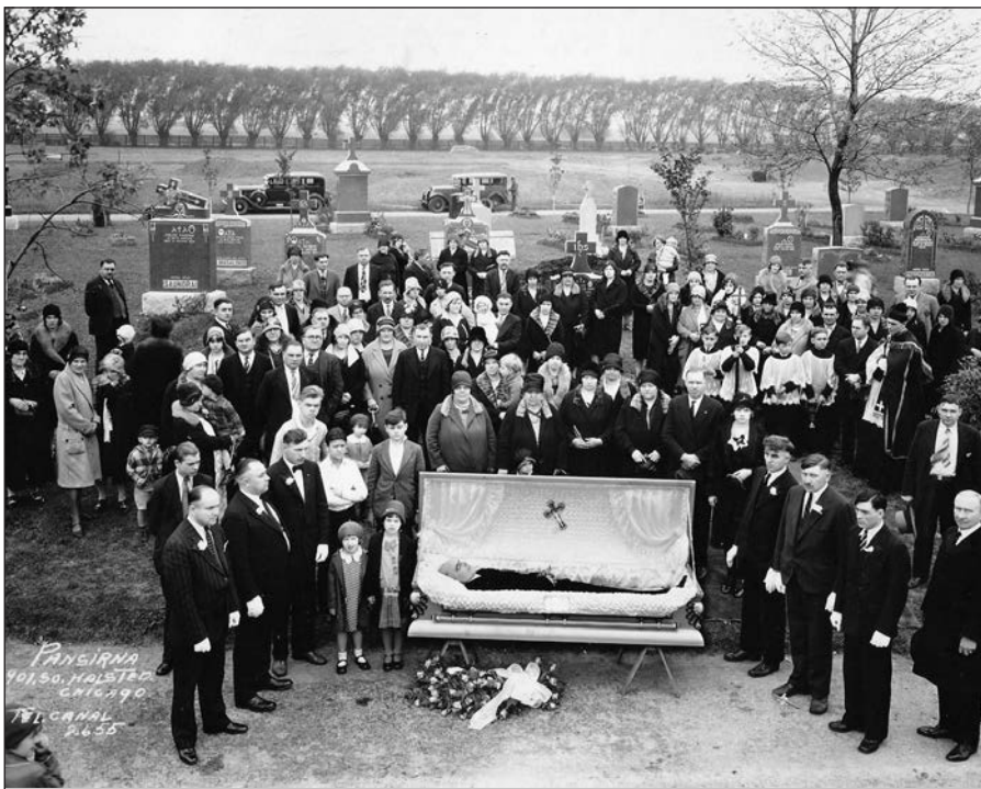
1929 m. laidotuvių vaizdas Šv. Kazimiero lietuvių kapinėse Chicagoje.