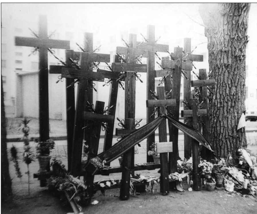
Po 1991 m. sausio 13-osios, aukų atminimo kryžiai prie Radijo ir televizijos pastato Vilniuje. Prano Bielskaus nuotr.