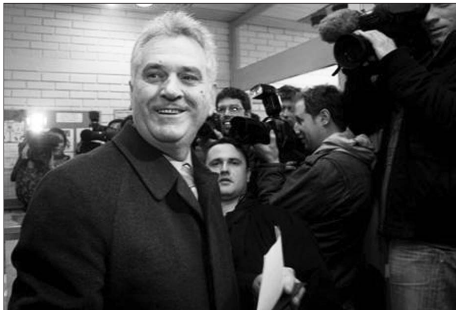
Per pirmąjį Serbijos prezidento rinkimų ratą nugalėjo nacionalistas Tomislav Nikolić.