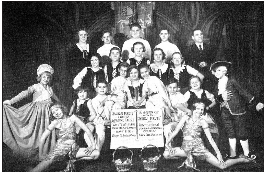
1932 m. „Jaunosios Birutės“ šokėjos, laimėjusios auksinę taurę už lietuviškus šokius Navy Pier, Chicagoje, varžybose.

Tie pirmieji JAV lietuviai aiškiai ir be abejonės išsprendė tą šiandien vargingai nagrinėjamą klausimą apie dvigubą pilietybę: „Mylėsime Ameriką, priimtą mūsų motiną, bet labiausia mylėsime ir didesnio labo geisime dėl tikrosios motinos Lietuvos. Amerikiečiai būsime dėl to, kad Amerikos duoną valgome, o lietuviais, kad iš