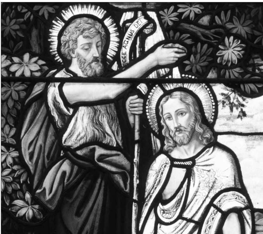
Jonas Krikštytojas ir Jėzus.

Pagal „Vatikano radiją“ parengė N. Šmerauskas