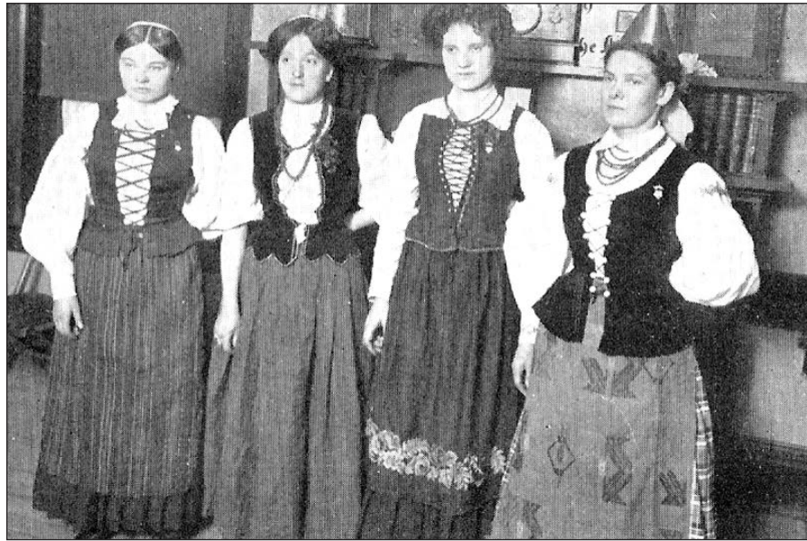
1910 m. Chicagos moterų draugija „Apšvieta“ narės, surengusios pirmą Amerikos lietuvių moterų rankdarbių parodą Fellowship House patalpose, Chicagoje.

Tarp sėkmingai peržengusių sieną buvo ir žymūs lietuvių veikėjai, visuomeninkai, kurie Amerikoje steigė lietuviškus laikraščius, lietuviškas organizacijas ir kitokiais būdais ragino tuos kaimo bernus ir mergas laivintis ir šviestis. Buvo ir kunigų, kurie, steigdami tas dabar uždarytas parapijas, bažnyčias ir mokyklas, irgi švietė Amerikoje atsiradusius