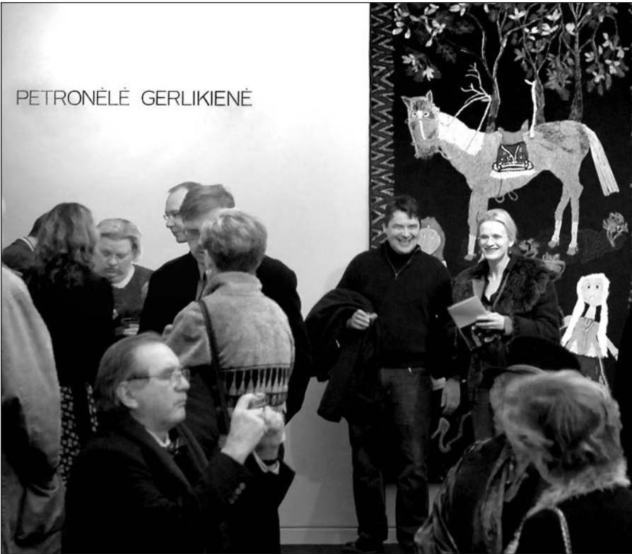
Parodos atidarymo akimirka.