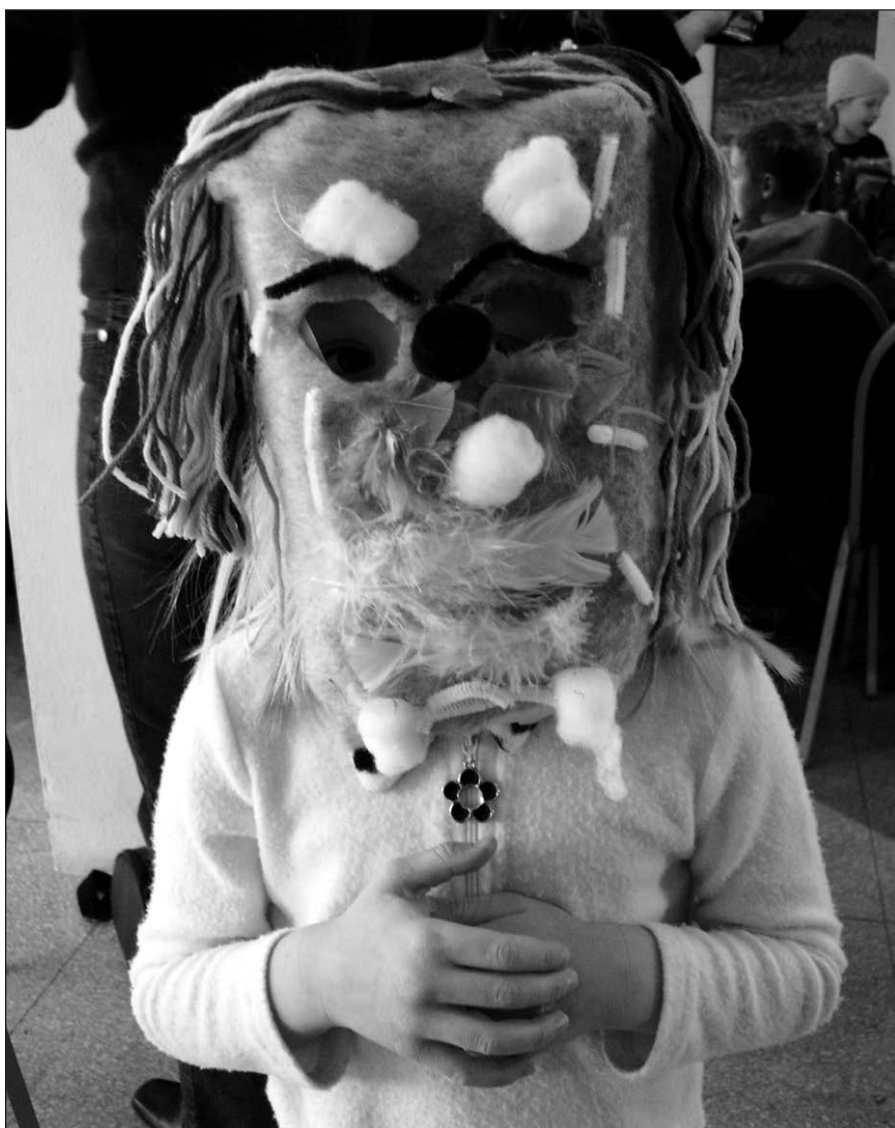
Nuotraukoje: Užgavėnių šventės dalyvė Balzeko muziejuje. 2007 m.