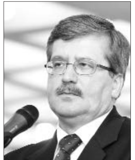
Lenkijos Seimo pirmininkas B. Komorowski.

Nors kariškiams pavyko užimti televizijos bokštą bei Lietuvos radijo ir televizijos pastatą, jie neišdrįso pulti tūkstančių žmonių saugomo tuometinės Aukščiausiosios Tarybos – Atkuriamojo Seimo pastato.