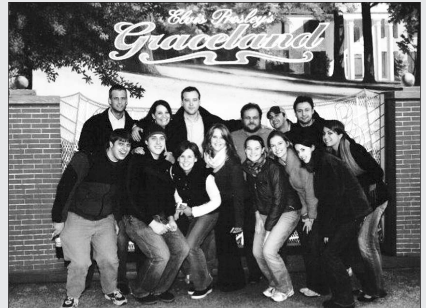
JAV LJS suvažiavimo, vykusio 2007 m. Memphis, TN, Graceland, dalyviai.