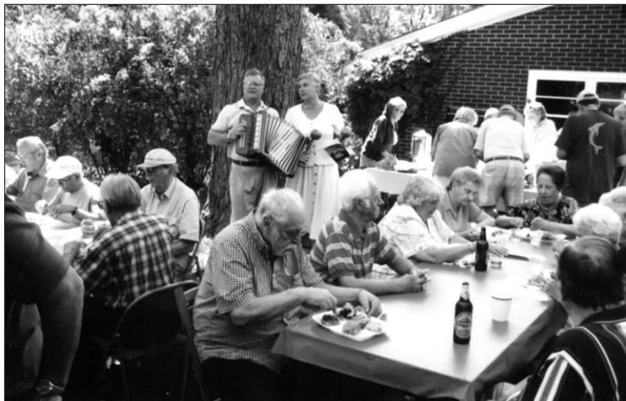
Dalis gegužinės dalyvių JAV LB East Chicago apylinkės valdybos surengtoje gegužinėje Vilučių sodyboje Schererville, IN.