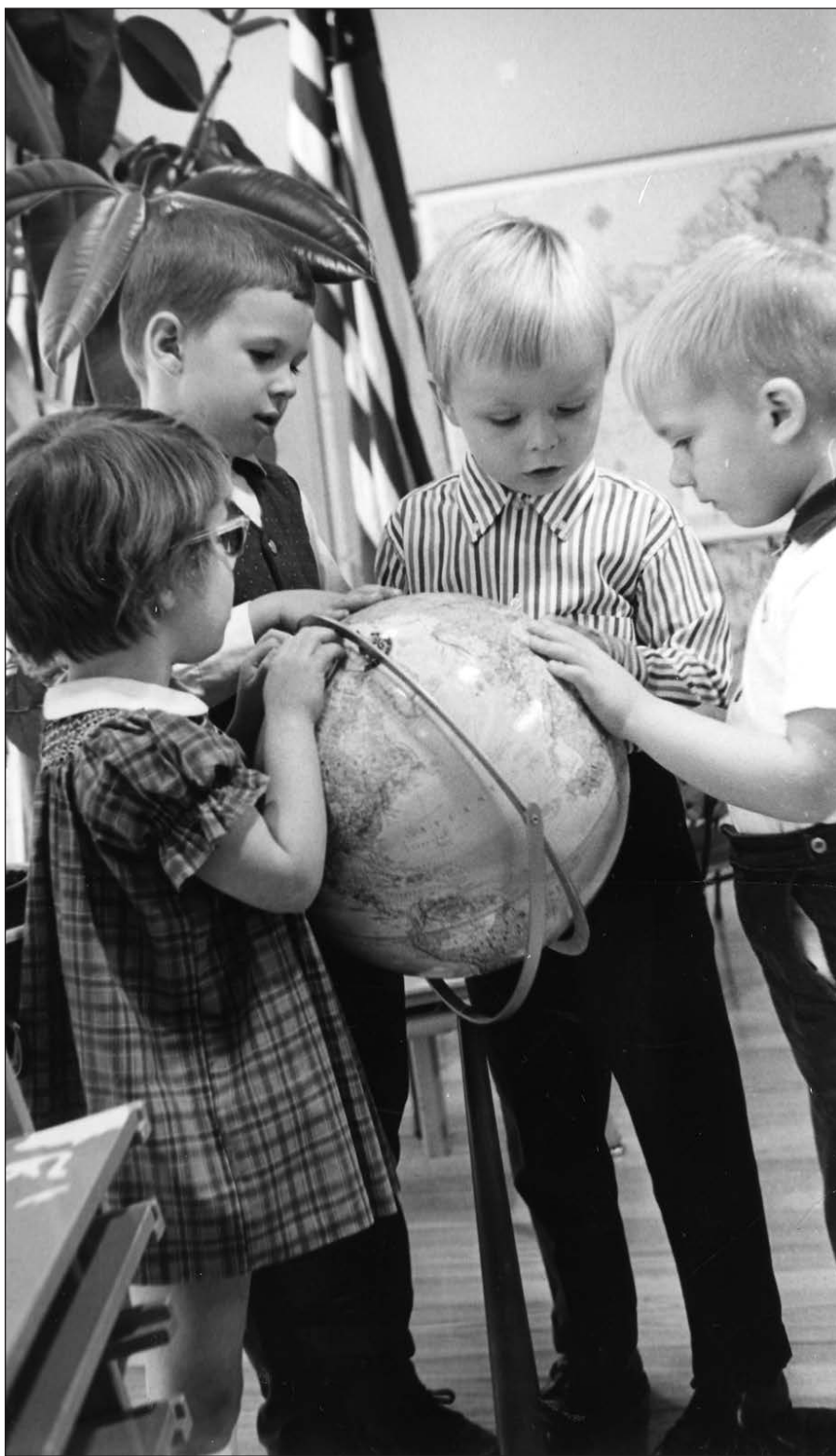
Vaikai – didžiausias gamtos sukurtas stebuklas, o juk kiekviename stebukle slypi ir kruopelė paslapties.