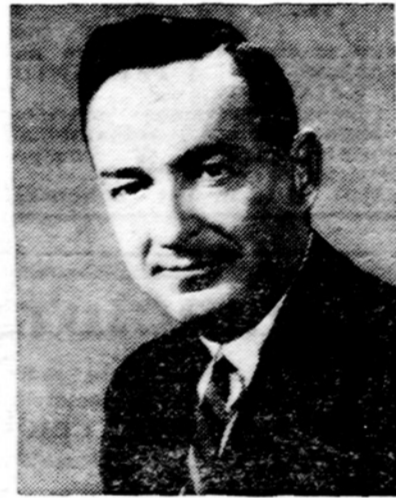
Respublikonų kandidatas į viceprezidentus kongr. Miller.